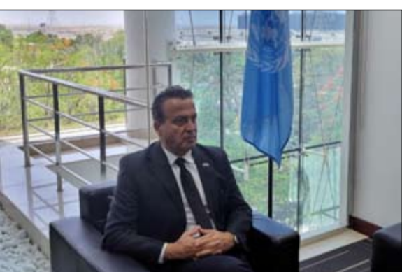
وذكر أن "الفاو" ومكتبها الخاص بدول مجلس التعاون الخليجي واليمن يتطلعان لتعاون أوسع مع دولة الإمارات لدعم الاستثمار في الزراعة، مؤكداً أهمية ذلك لتحقيق التنمية المستدامة. كما أكد أهمية مخرجات مؤتمر المناخ "COP28" والتي شددت على ضرورة التصدي الفوري للتحديات البيئية والمناخية التي تواجه الزراعة في العالم والتي تترجم حالياً في جهود إماراتية عالية لتسريع العمل على تحقيق مخرجات القمة.

تحقيق أهداف التنمية المستدامة وأهداف المناخ، مما يلقي الضوء على التحديات في قطاعات مثل التصنيع والزراعة. وأكد مستشار منظمة الأغذية والزراعة للأمم المتحدة لدول مجلس التعاون الخليجي واليمن "الفاو"، أن القضاء على الجوع يبطل أولوية قصوى لمنظمة الأغذية والزراعة وشركائها، مشيراً إلى دعم الإمارات القوي في هذا المجال من خلال مبادراتها المتعددة، وهو ما يعد أمراً حيوياً لتحقيق هدفنا المشترك في عالم خالٍ من الجوع. كما أكد أهمية مخرجات مؤتمر