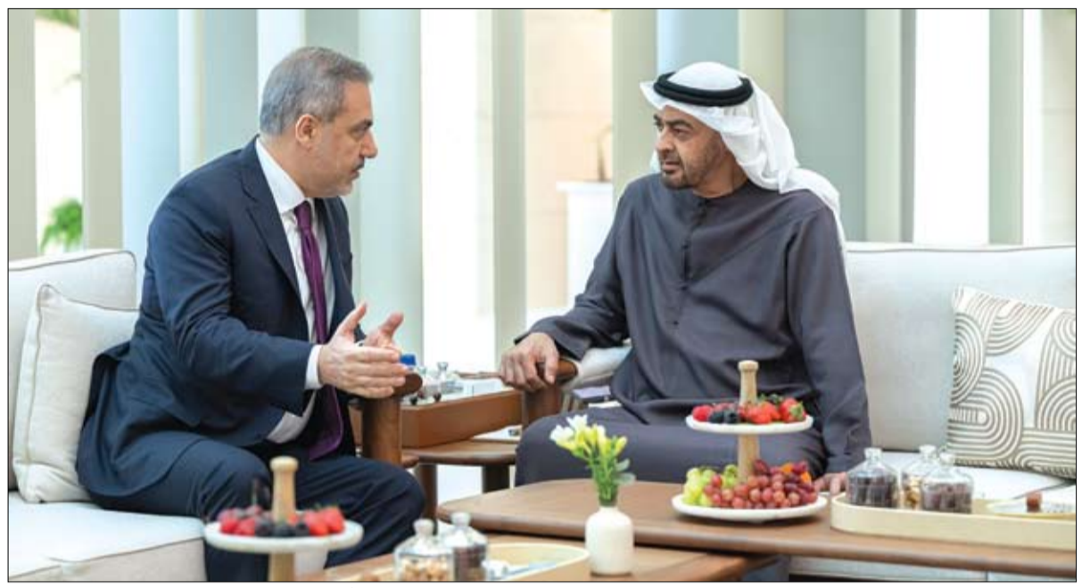
رئيس الدولة خلال استقباله وزير الخارجية التركي

•• أبوظبي-وام: نعى ديوان الرئاسة المغفور له الشيخ هزاع بن سلطان بن زايد آل نهيان الذي وافته المنية أمس. وأصدر ديوان الرئاسة البيان التالي .. بسم الله الرحمن الرحيم .. (يا أيُّتها النفس المطمئنة ارجعي إلى ربك راضية مرضية فإدخلي في عبادي وأدخلي جنتي).. صدق الله العظيم. بقلوب مؤمنة بقضاء الله وقدره، ينعى ديوان الرئاسة المغفور له الشيخ هزاع بن سلطان بن زايد آل نهيان الذي وافته المنية أمس. ويعرب الديوان عن خالص عزائه ومواساته سانلا المولى عز وجل أن يتعمد الفقيد بواسع رحمته وعظيم غفرانه وأن يلهم أهله وذويه الصبر والسلوان (إن الله وإن إليه راجعون). وقد أدى سمو الشيوخ والجموع أمس صلاة العزاء على جثمان الفقيد الشيخ هزاع بن سلطان بن زايد آل نهيان رحمه الله في مسجد الشيخ سلطان بن زايد الأول في أبوظبي. وقد قدم صاحب السمو الشيخ