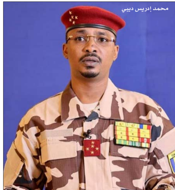
محمد إدريس ديبي

«يجب أن نبقى، وبالطبع سنبقى»، هذا ما أعلنه جان ماري بوكل، «المبعوث الشخصي» لإيمانويل ماكرون، في 7 مارس-آذار، بعد مقابلة مع الرئيس التشادي الانتقالي محمد إدريس ديبي. وحاول الأخير، الذي أجلسه مجموعة من الجنرالات على كرسي والده إدريس ديبي، الذي قُتل في معركة ضد متمردين عام 2021، بعد ثلاثة عقود من الحكم المنفرد، بدعم من فرنسا، يوم الاثنين 6 مايو-آيار، إضفاء الشرعية على حكومة السلطة المكتسبة خارج أي إطار دستوري.