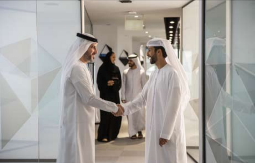
عبر موقعها الإلكتروني ومنها خدمة "شورك"، وعلى المؤمن عليهم الراغبين بالاستفادة من الخدمة زيارة موقع الهيئة عبر الرابط: https://gpssa.gov.ae/ar/Pages/MergeServicePeriod.aspx

تأخير، مع ضرورة متابعة استكمال إجراءات الضم مع جهة العمل الجديدة وعدم تجاوزها لضمان الاستفادة من "شورك". - حالات لا يمكنها الاستفادة من "شورك" يستهدف "شورك" تحسين جودة حياة المؤمن عليهم وتحقيق الاستقرار المالي لهم ولأسرهم، لاسيما وأنه يساعد المؤمن عليهم في ضم الخدمة دون تحمل أي تكاليف إضافية إلا أن هناك حالات لا يمكنها الاستفادة من "شورك" وهي: باعتبار أنهم لا يستحقون مكافأة نهاية خدمة عن المدة التي تقل عن سنة، والجدير بالذكر أن الهيئة توفر خدماتها