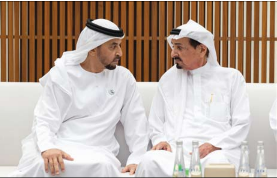
حاكم عجمان يقدم العزاء الى حمدان بن زايد بوفاة هزاع بن سلطان بن زايد آل نهيان (وام)

الشيخ خالد بن محمد بن زايد آل نهيان ولي عهد أبوظبي، وسمو الشيخ حمدان بن زايد آل نهيان ممثل الحاكم في منطقة الظفرة، وسمو الشيخ سيف بن محمد آل نهيان، وسمو الشيخ سرور بن محمد آل نهيان، (التفاصيل ص2) المشرف في أبوظبي، سمو الشيخ عمار بن حميد النعيمي ولي عهد عجمان، وسمو الشيخ محمد بن حمد بن محمد الشرقي ولي عهد الفجيرة، وعدد من سمو الشيوخ والمسؤولين وجموع من المواطنين. وتقبل التعازي كل من، سمو