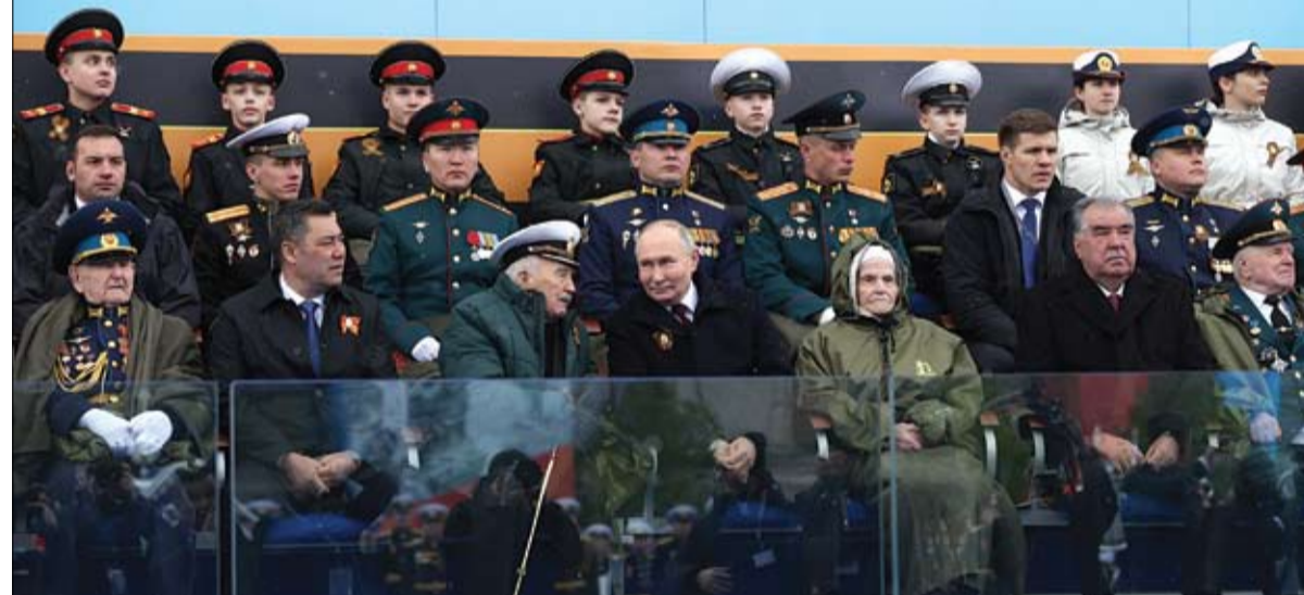
الرئيس الروسي خلال حضوره العرض العسكري ليوم النصر في الساحة الحمراء بوسط موسكو.

•• موسكو-وكالات: خلال العرض العسكري السنوي لإحياء عيد النصر في موسكو، أكد الرئيس الروسي فلاديمير بوتين أن قوات بلاده النووية الاستراتيجية في حالة تأهب دائم. كما أضاف أن الغرب يحاول إثارة الصراعات والعداء بين الدول في العالم، ويسعى لاحتواء مراكز التنمية السيادية، حسب ما نقلت وكالة تاس. واستغل بوتين المناسبة للإشادة بجنوده والمحاربين القدامى في جيشه ولاستعراض المعدات العسكرية الروسية التي يأمل بأن يراها الجميع حول العالم. وكان الرئيس الروسي أكد مرارا بأن الحرب التي تخوضها بلاده في أوكرانيا حاليا هي معركة وجودية في وجه النازية. إلى هذا، عززت السلطات الإجراءات الأمنية في العاصمة الروسية قبيل عرض هذا العام الذي يأتي على وقع سلسلة هجمات أوكرانية بالمسيرات تستهدف الأراضي الروسية. وجرت بروفات ليلية قبله بأسابيع فيما أغلقت أجزاء من وسط موسكو من أجل مرور المركبات العسكرية ورفعت لافتات ضخمة على طول جدران الكرملين في الساحة الحمراء. آتت هذه الاحتفالات بعد يومين على تعهد بوتين خلال حفل تنصيب يراخ الثلاثة بتحقيق النصر للروس، ليبدأ ولاية رئاسية خامسة قياسية. كما كُتف بوتين أيضا تهديداته النووية مصدرا أوامر في وقت سابق هذا الأسبوع للجيش الروسي، لإقامة تدريبات على انتشار الأسلحة. ميدانيا قال مصدر في الدفاع الأوكراني لوكالة فرانس برس الخميس أن أوكرانيا قصفت بمسيرة مصفاة نفط روسية في جمهورية باشكورتستان على مسافة قياسية تبلغ نحو 1200 كيلومتر من حدودها. تنتباهو يتحدى بايدن بعد قرار تعليق إرسال الأسلحة بالدولة الفلسطينية كشكل من أشكال الضغط لإنهاء الصراع في غزة. وفي بيان تم توقيعه بشكل مشترك مع وزراء الدول المذكورة سلفا إنهم ناقشوا استعدادهم للاعتراف بفلسطين، مؤكدا أننا سنضلع ذلك