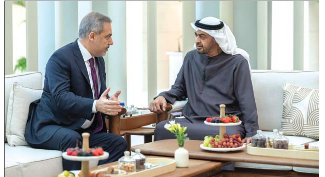
بحث مع وزير الخارجية التركي علاقات البلدين والأوضاع في الشرق الأوسط