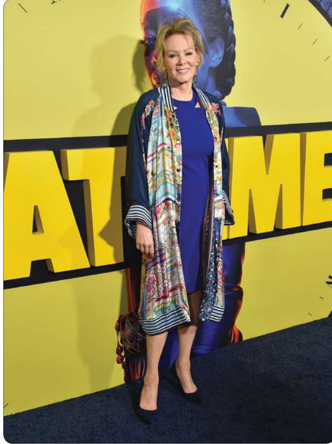
الممثلة الأمريكية جان سمار لدى وصولها لحضور العرض الأول لسلسلة HBO الجديدة «الحراس» في هوليوود.

ترقق العظام يسبب الألم؛ لا. فتضائل الكثافة العظمية لا يسبب أي ألم، بل تتفاقم المشكلة بشكل صامت طوال سنوات عدة. ولا يتم تشخيص ترقق العظام إلا في حال حصول كسر في المعصم أو الفخذ أو إحدى الفقرات. لا بد من إجراء صورة شعاعية لقياس كثافة العظام للتأكد من وجود الترقق أم لا.