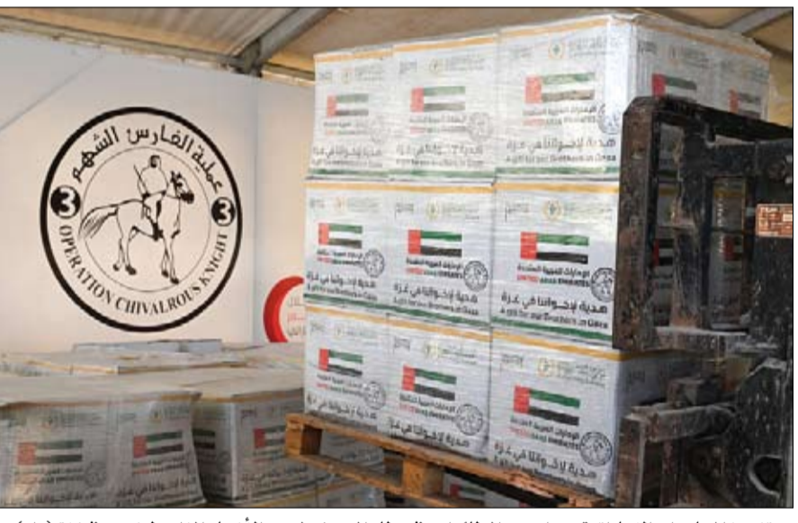
تفريغ المساعدات الإماراتية من إحدى الطائرات في مطار العريش لدعم الأشقاء الفلسطينيين في غزة