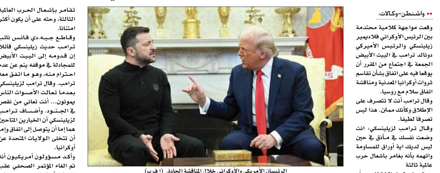
الرئيسان الأمريكي والأوكراني خلال المناقشة الحادة.

واشنطن- وكالات: وقعت مواجهة كلامية محتدمة بين الرئيس الأوكراني فلاديمير زيلينسكي والرئيس الأمريكي دونالد ترامب في البيت الأبيض الجمعة في اجتماع من المقرر أن يوقعا فيه على اتفاق بشأن تقاسم ثروات أوكرانيا المعدنية ومناقشة اتفاق سلام مع روسيا. وقال ترامب أنت لا تتصرف على الإطلاق وكأنك ممتن. هذا ليس تصرفا لطيفا. وقال ترامب لزيلينسكي: انت وضعت نفسك في مأذق في حين ليس لديك اية أوراق للمساومة واتهمه بأنه بفاهم بإشغال حرب عالمية ثالثة وعقب استخدام النقاش حذر الرئيس الأمريكي دونالد ترامب الجمعة نظيره الأوكراني فولوديمير زيلينسكي من أن على كييف التوصل إلى اتفاق مع الولايات المتحدة في صفقة المعادن والنادرة في أوكرانيا والا ستوقف واشنطن الدعم الذي تقدمه منذ الغزو الروسي وسوف يتعد. وقال ترامب في البيت الأبيض في مواجهة كلامية حادة شعبك إن المدن الأوكرانية تحولت إلى شجاع، لكن عليك أن تتوصل إلى اتفاق وإلا سنسحب مضيضا لا تملك أي أوراق للمساومة. ورفض زيلينسكي قول ترامب وقال إن المدن الأوكرانية تحولت إلى أنقاض بسبب الحرب المستمرة منذ ثلاث سنوات. وأكد ترامب أن بوتين يريد إبرام اتفاق. وقال ترامب لزيلينسكي أنت