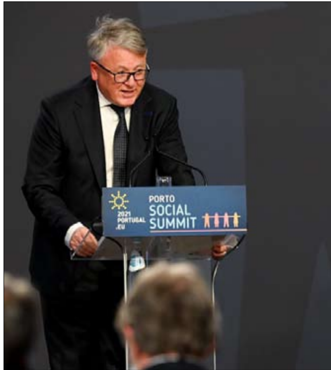
نيكولاس شولز، أوروبا حددت ثلاثة أهداف