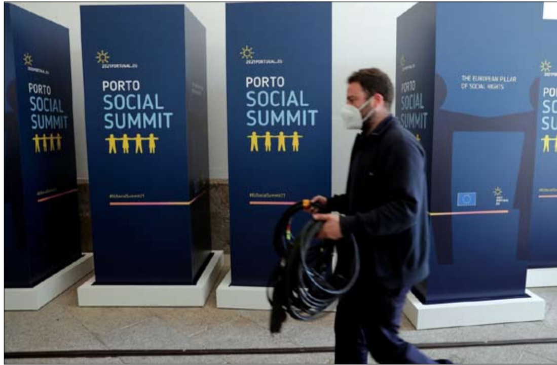
القمة الأوروبية الاجتماعية برئاسة برتغالية