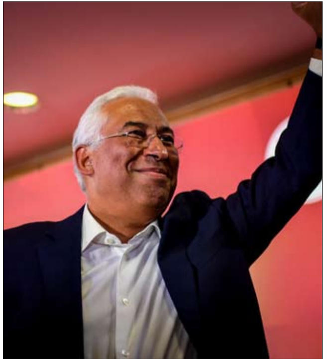
أنطونيو كوستا... تغيير نموذج الحكومة الاقتصادية في أوروبا

النصف تقريباً بين عامي 2017 و2019 - وهو أكبر انخفاض في جميع المناطق الصينية والأكثر تفرقاً على مستوى العالم منذ عام 1950، وفقاً لتحليل أجراه معهد السياسة الاستراتيجية الأسترالي.