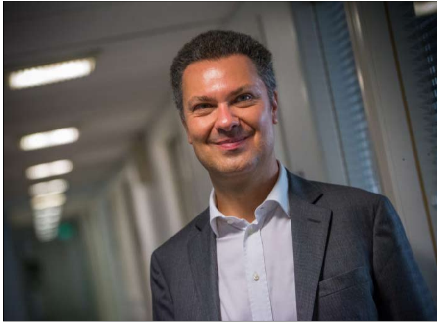
لوكا فيسينتيني... الإصلاح الاجتماعي يتطلب مراجعة النموذج الاقتصادي

نجحت دول الشمال الأوروبي في البقاء في السلطة، فقد يكون ذلك على وجه التحديد، من بين أسباب أخرى، أنها لم تتخل أبداً عن تعزيز دولة الرفاهية الاجتماعية، وهي ركيزة الهوية الاشتراكية الديمقراطية.