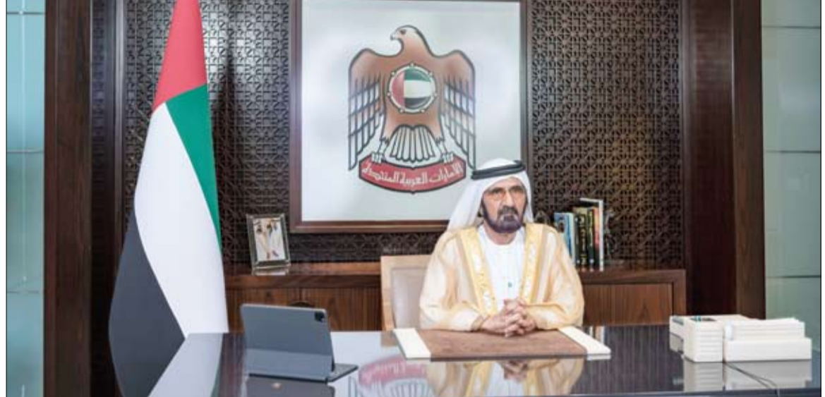
محمد بن راشد يشهد حفل تخريج الدفعة الـ 41 من طلبة وطالبات جامعة الامارات الذي أقيم افتراضيا