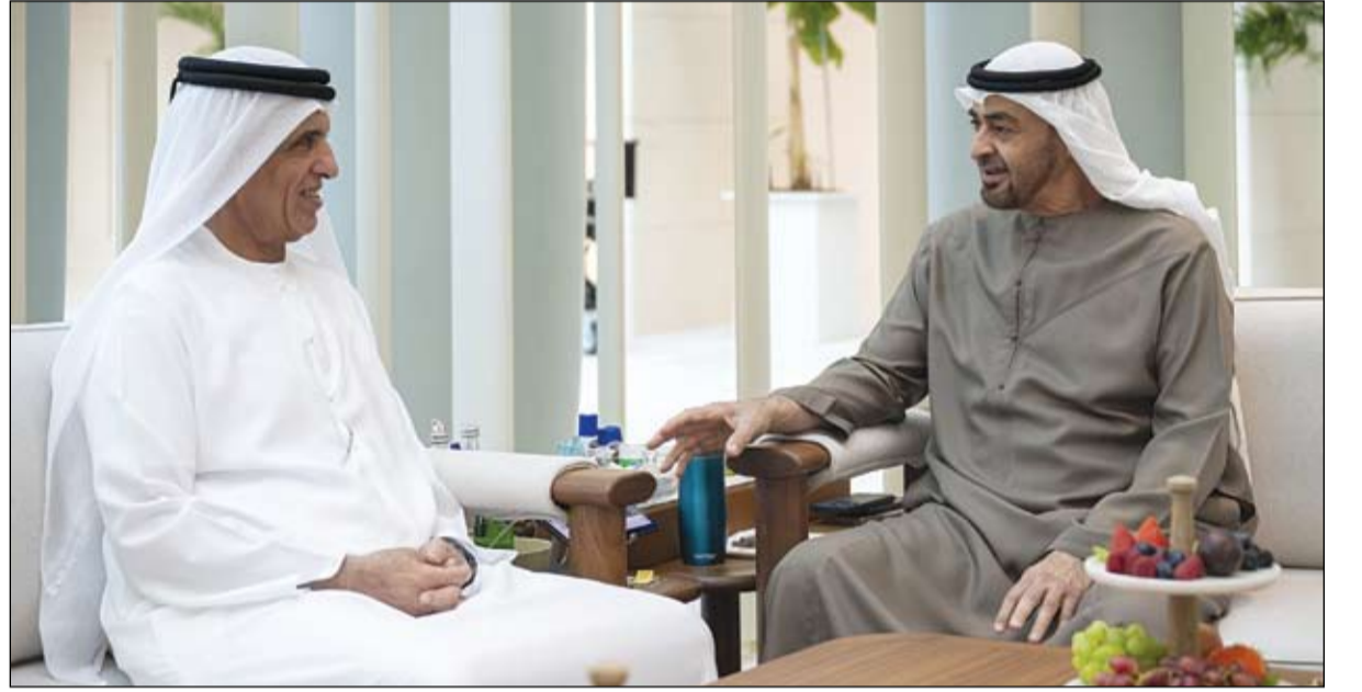
رئيس الدولة خلال استقباله سعود بن صقر القاسمي

المالية، والفريق سمو الشيخ سيف بن زايد آل نهيان، نائب رئيس مجلس الوزراء وزير الداخلية. وقال صاحب السمو الشيخ محمد بن راشد آل مكتوم: ترأست اليوم اجتماعاً لمجلس الوزراء بقصر الوطن بأبوظبي.. اعتمدنا في بدايته الأجددة الوطنية للشباب حتى العام 2031... توجيهات المجلس لوزير الشباب التركيز على خمس قضايا مهمة... تمكين شبابنا اقتصادياً.. تطوير مهاراتهم علمياً.. ترسيخ هويتهم وطنياً.. تعزيز مساهماتهم مجتمعياً.. وتفعل دورهم لتمثيل بلادهم دولياً. (التفاصيل ص3)