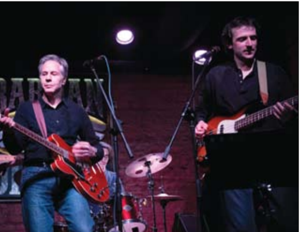
وزير الخارجية الأمريكي يعزف ويغني في عرض موسيقي وسط أوكرانيا

•• عواصم-وكالات: أعلنت وزارة الدفاع الروسية، الأربعاء، السيطرة على بلديتين إضافيتين في منطقة خاركيف وبلدة ثالثة منطقة زابوريجيا. وأكدت الوزارة سيطرة القوات الروسية على بلدة روبيوتنا الاستراتيجية في زابوريجيا جنوبي أوكرانيا، وعلى بلديتي علوبوكوي ولوكيانسكي في مقاطعة خاركيف بشمال شرق أوكرانيا. وكانت القوات الروسية نجحت خلال الأيام القليلة الماضية في السيطرة على أكثر من 10 قرى وبلدات في مقاطعة خاركيف، وسيطرت على مساحة واسعة من المناطق المحاذية لحدودها. وقالت هيئة الأركان الأوكرانية، عبر وسائل التواصل الاجتماعي في بعض المناطق قرب لوكيانسكي وفوقتشانسك وبسبب هصف العدو وهجوم للمشاة، تراجع وحداتنا باتجاه مواقع مناسبة أكثر لإنقاذ أرواح جنودنا وتجنب تسجيل خسائر.. والحركة مستمرة، وفقاً لفرانس برس. فلاديمير بوتين الأربعاء، بتقدم قوات بلاده على جميع الجبهات في ساحة المعركة في أوكرانيا. في حين انتقد العديد من الأوكرانيين رسالة الدعم التي وجهها وزير الخارجية الأمريكي أنتوني بلينكن من خلال عزفه أغنية Rock in The Free World في إحدى حانات العاصمة الأوكرانية مساء الثلاثاء، واعتبروها غير مناسبة في ظل