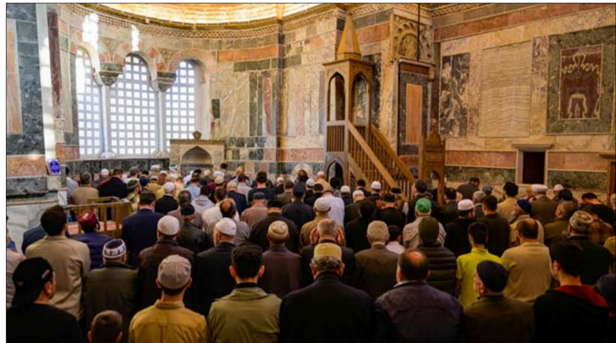
مصلون داخل الكنيسة الأرثوذكسية القديمة التي تم تحويلها إلى مسجد كاريه في إسطنبول

« يبدو أن الزمن قد تغير، ورئيس الحكومة اليونانية رجب، في أنقرة، الاثنين 13 مايو-أيار، بالمسار الإيجابي، الذي سلطته الدولتان. وأشار رئيس الوزراء إلى أن هذا كان الاجتماع الرابع خلال عشرة أشهر مع السيد أردوغان. وأضاف أن هذا التقارب في الأوقات الصعبة للسلام وفي سياق زعزعة استقرار المنطقة، كان ضرورياً. وقبل هذا اللقاء في العاصمة التركية، تبادل رئيسا الدولتين الجماملات. وقد أشار السيد ميتسوتاكيس عدة مرات في صحيفة ميليت التركية اليومية إلى موضوع التقدم في الحوار الدائم. وأشار السيد أردوغان، في صحيفة كاثيميريوني اليونانية، إلى «الهدف الممثل في تعزيز صداقتهم من خلال حل المشاكل، ومعالجة جميع القضايا معاً». وفي القصر الرئاسي، استمرت اللقاءات الثنائية ساعتين قبل عقد مؤتمر صحفي. وحاول القادة تسليم الضوء على ذوبان الجليد في العلاقات بين بلديهما، دون أن ينجحاً في إخفاء مناطق التوتر. وأشار السيد أردوغان إلى أنه لم يكن لديه نفس التعريف لحماس مثل نظيره اليوناني.