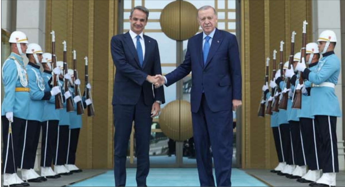
مصافحة وابتساماً قد تخفي ملفات التوتر

نفسها. في عام 2023، في مجال الهجرة الأساسي، أدى تعاون شرطتنا وخفر السواحل لدينا إلى نتائج وسيستمر «لتعزيز»، ابتهج السيد ميتسوتاكيس أيضاً، مؤكداً إن تدفقات الهجرة أخذت في التناقص ولم يعد موضوع الهجرة يمثل مشكلة يمكن للبيمين المتطرف أن يوظفها قبل الانتخابات الأوروبية. ومنذ عدة أشهر، لم يتم الإبلاغ عن أي انتهاكات تقريباً للمجال الجوي اليوناني من قبل الطائرات التركية. كما وعدت اليونان سيكون مفيداً لتكلا البلدين والمنطقة، مشدداً على «عقد اجتماع مثمر وصادق وبناء للغاية». وأضاف السيد ميتسوتاكيس، لقد أظهرنا اليوم أنه إلى جانب خلافاتنا الراسخة، يمكننا كتابة صفحة جديدة. ووافق المسؤولون على زيادة حجم التجارة الثنائية بينهما من نحو 6 مليارات دولار إلى 10 مليارات، بحسب أردوغان. منذ التوقيع في ديسمبر=كانون الأول الماضي على إعلان الصداقة وعلاقات حسن الجوار، بدأ وضع «الأجندة الإيجابية، اليونانية التركية، مع إصدار «تأثيرات خاصة، للسياح الأتراك الراغبين بالذهاب إلى عشر جزر في بحر إيجه بالقرب من الساحل التركي. منذ الشهر الأول من التنفيذ، في أبريل، تضاعف عدد الزوار الأتراك ثلاث مرات مقارنة بالفترة