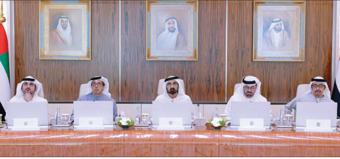
محمد بن راشد خلال ترؤسه اجتماع مجلس الوزراء (وام)