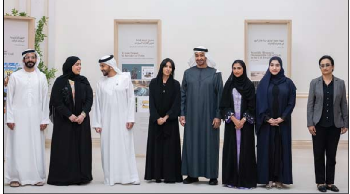
رئيس الدولة خلال استقباله عددا من رواد أعمال وشباب ومسؤولين معنيين بمجال البيئة (وام)

خالد بن محمد بن زايد يلتقي الرئيس التنفيذي لمجموعة بلاكتون للاستشارات المالية •• أبوظبى - وام: التقى سمو الشيخ خالد بن محمد بن زايد آل نهيان ولي عهد أبوظبي رئيس المجلس التنفيذي لإمارة أبوظبي، ستيفن آين شوارزمان الرئيس التنفيذي والشريك المؤسس لمجموعة بلاكتون للاستشارات المالية، إحدى أكبر شركات إدارة الأصول البديلة في العالم، والمتخصصة في تقديم الخدمات الاستشارية المالية وإدارة الأسهم وصناديق الاستثمارات العقارية للشركات والمؤسسات المالية والأفراد. جرى خلال اللقاء بحث سبل تعزيز التعاون المشترك في قطاع الأعمال، والفرص الاستثمارية التي تتيحها الإمارة أمام المؤسسات البنكية والمالية العالمية. عبدالله بن زايد ووزير الخارجية الأردني يدينان الاقتحامات الإسرائيلية للمسجد الأقصى المبارك •• أبوظبى - وام: أدان سمو الشيخ عبدالله بن زايد آل نهيان وزير الخارجية، ومعالي أيمن الصفدي نائب رئيس الوزراء ووزير الخارجية وشؤون المغتربين في المملكة الأردنية الهاشمية الشقيقة، أمس، استمرار الاقتحامات الإسرائيلية للمسجد الأقصى المبارك - الحرم القدسي الشريف، والتي كان آخرها اقتحام أحد الوزراء المتطرفين في الحكومة الإسرائيلية وأعضاء من الكنيست ومتطرفين، أمس، للمسجد تحت حماية شرطة الاحتلال الإسرائيلي.