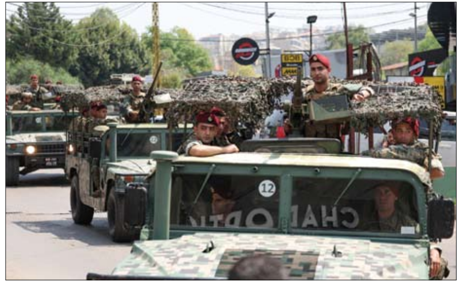
جنود من الجيش اللبناني يقومون بدوريات في المنطقة القريبة من السفارة الأميركية في عوكر.

إطلاق نار على السفارة الأميركية في بيروت واعتقال المنفذ •• بيروت - وكالات: تعرضت السفارة الأميركية في لبنان لإطلاق نار، صباح أمس الأربعاء. وفي آخر التطورات في القضية، تمكنت مديرية أمن الدولة في البقاع قبل قليل بالتنسيق مع مديرية المخابرات، وفي عملية خاطفة ونوعية في بلدة مجدل عنجر من توقيف شقيق مطلق النار على السفارة الأميركية في بيروت وهو من الجنسية السورية، بناء لإشارة النائب العام الاستثنائي في البقاع القاضي منفي بركات، وأودع السلطات المختصة وبوشرت التحقيقات. وأشارت المعلومات الى أن منفذ الهجوم استقل حافلة من بلدة مجدل عنجر وتوجه نحو محيط السفارة الأميركية في منطقة عوكر وهو الآن يخضع لعملية جراحية وقابع تحت الرقابة المشددة في المستشفى العسكري في بدارو. وفي وقت سابق، قال الجيش اللبناني إن السفارة الأميركية في منطقة عوكر تعرضت إلى إطلاق نار من قبل شخص يحمل الجنسية السورية، وإن عناصر الجيش المنتشرين في المنطقة ردوا بإطلاق النيران، ما أسفر عن إصابته. وأضاف الجيش في تدوينته على منصة إكس أنه تم توقيف مطلق النار، ونقله إلى أحد المستشفيات لتلقي العلاج وتحديد ملايبات الحادثة. ويعتقد أن الهجوم على السفارة في عوكر، جزء من سلسلة من الهجمات التي تستهدف السفارات الأجنبية في لبنان، وذلك في إطار عملية جارية، وذلك في إطار عملية جارية، وذلك في إطار عملية جارية.