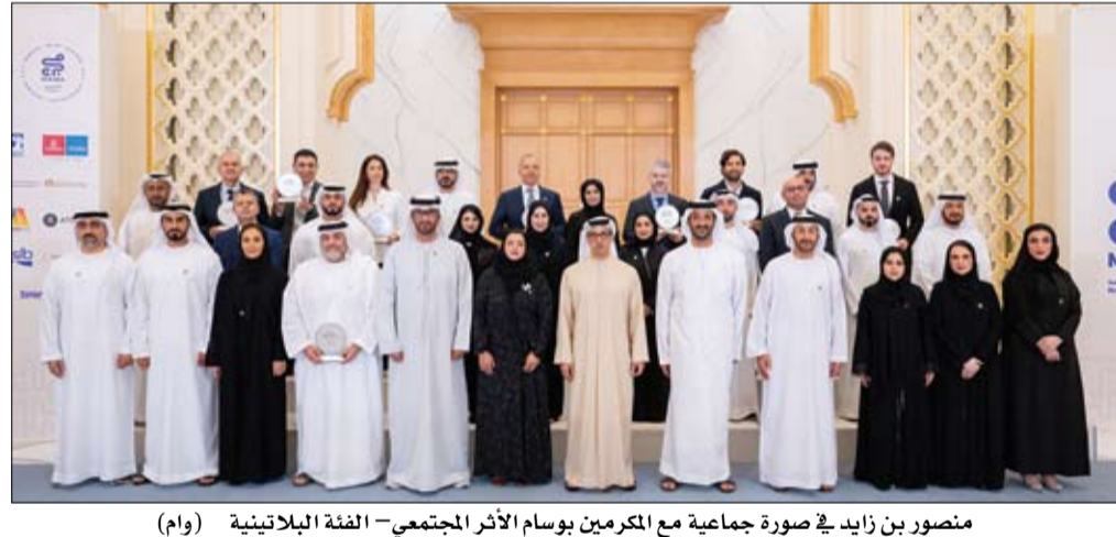
منصور بن زايد في صورة جماعية مع المكرمين بوسام الأثر المجتمعي - الفئة البلاطينية

أطلق سمو الشيخ منصور بن زايد آل نهيان، نائب رئيس الدولة، نائب رئيس مجلس الوزراء، رئيس ديوان الرئاسة، إستراتيجية شركات الإمارات من أجل الخير 2031، وذلك خلال فعالية نظمها مجرى - الصندوق الوطني للمسؤولية المجتمعية في قصر الوطن بأبوظبي على هامش اجتماع المجلس الوزاري للدكاء الاصطناعي والتنمية. وتشكّل الإستراتيجية إطاراً وطنياً شاملاً لتعزيز مساهمة القطاع الخاص في تحقيق الأثر المستدام، وترسيخ اقتصاد الأثر، ودعم تنافسية منظومة المسؤولية المجتمعية. (التفاصيل ص2)