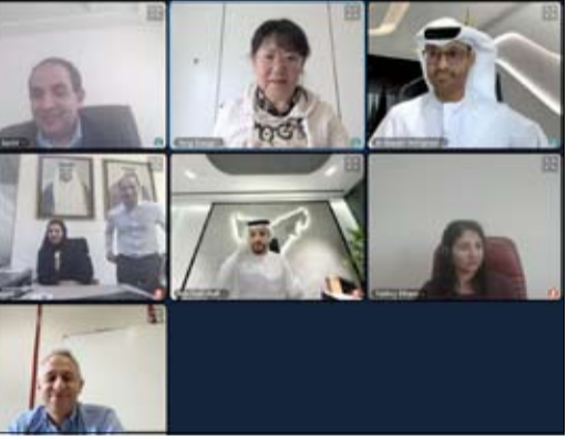
ويكس هذا التعيين ثقة المجتمع الدولي برويته وخبرته، ويجسد الدور المتنامي للمنطقة العربية في صياغة المعايير التي تركز عليها منظومة الأمن الرقمي العالمي.

أعلن الاتحاد الدولي للاتصالات، تعيين سعادة الدكتور محمد الكويتي، رئيس الأمن السيبراني لجهة الامارات، رئيساً للمجموعة الإقليمية العربية التابعة للجنة الدراسات الـ 17 بقطاع تقييم الاتصالات في الاتحاد (SG17RG-ARB)، وذلك عقب اختتام الاجتماع الافتراضي للمجموعة المعني بالدول العربية في 18 مايو 2026. تعد لجنة الدراسات الـ 17 التابعة لقطاع تقييم الاتصالات في الاتحاد الدولي للاتصالات، الجهة الدولية المعنية بجمال تقييم أمن المعلومات إذ تعمل على تطوير المعايير العالمية في مجالات الأمن السيبراني، وإدارة الهوية، والخصوصية، والتقنيات الناشئة، وتضطلع بدور محوري في الربط بين أولويات الأمن السيبراني الإقليمية والمعايير الدولية التي يتقو عليها مستقبل رقمي آمن وموثوق. ويتمتع الدكتور الكويتي، بسجل حافل في قيادة جهود الأمن السيبراني على المستويين الوطني والدولي، إذ أسهم في ترسيخ مكانة دولة الإمارات كقوة سيبرانية معترف بها عالمياً، وقاد جهود تعزيز التعاون الإقليمي في العالم العربي.