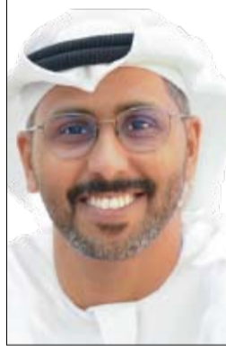
العلمي الدولي، واستشراف التحولات الجيوسياسية والتكنولوجية التي تشكل ملامح المرحلة المقبلة.

استثماراً لحضوره الدولي عبر مكاتبه الخارجية، يطلق «تريندز جلوبال»، التابع لجموعة تريندز، حواراً فكرياً وبحثياً استراتيجياً في العاصمة الإيطالية روما، خلال الفترة من 5 إلى 11 يوليو 2026، يتضمن ثلاثة مؤتمرات دولية رفيعة المستوى، إلى جانب حوارات وندوات مع مؤسسات بحثية إيطالية، في خطوة تجسد التزام بتوسيع حضوره العالمي وترسيخ مكانته منصة دولية للحوار والعري وصناعة الرؤى.