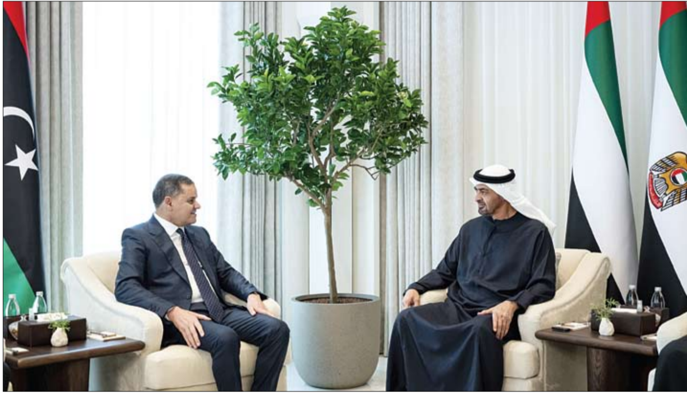
رئيس الدولة خلال مباحثاته مع رئيس حكومة الوحدة الوطنية في دولة ليبيا الشقيقة (وام)

حضر اللقاء.. سمو الشيخ خالد بن محمد بن زايد آل نهيان ولي عهد أبوظبي وسمو الشيخ حمدان بن محمد بن زايد آل نهيان نائب رئيس ديوان الرئاسة للشؤون الخاصة. (التفاصيل ص2)