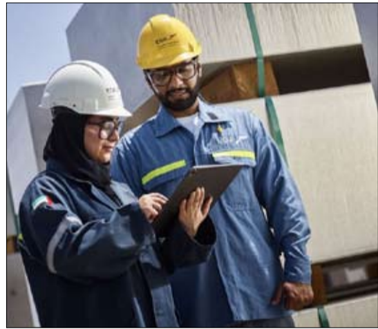
الاستثنائية لموظفيها، وستواصل الشركة الاحتكام كل فرصة متاحة لتسريع وتيرة الاستعادة وإعادة التشغيل.

إعادة تشغيلها إلى 89 خلية اختزال حتى اليوم. وسيرتفع إنتاج المنصهر تدريجياً مع إعادة تشغيل خلايا الاختزال، وقد يستغرق العمل عاماً كاملاً للوصول إلى مستويات الإنتاج قبل الحاد، فيما تواصل شركة الإمارات العالمية للألنيوم جهودها لتسريع عملية الاستعادة. وأنتج قسم عمليات المنصهر في الطويلة أول معدن مصبوب في 4 مايو، ويقوم الفريق بالتركيز على إعادة صهر المعدن المتجمد الذي تم استخراجها من خلايا الاختزال أثناء أعمال إعادة التشغيل، وذلك لإنتاج منتجات الألنيوم النهائية وصب المعدن المنصهر من خلايا الاختزال التي تمت إعادة تأهيلها. وكان مصنع إعادة التدوير في الطويلة قد دخل مرحلة التشغيل النهائي قبل وقوع الحادث بوقت قصير. واستؤنفت أعمال التشغيل النهائي خلال شهر أبريل، فيما بدأت عمليات إنتاج المعدن في بداية شهر مايو الماضي. ومن المتوقع أن يستغرق الوصول إلى الطاقة الإنتاجية الكاملة حوالي ستة أشهر، وفقاً للجدول الزمني الأساسي، وذلك بحسب توفر الخردة. وفي مصفاة الطويلة لتكرير الألومينا، من المتوقع استئناف عمليات الإنتاج خلال الربع