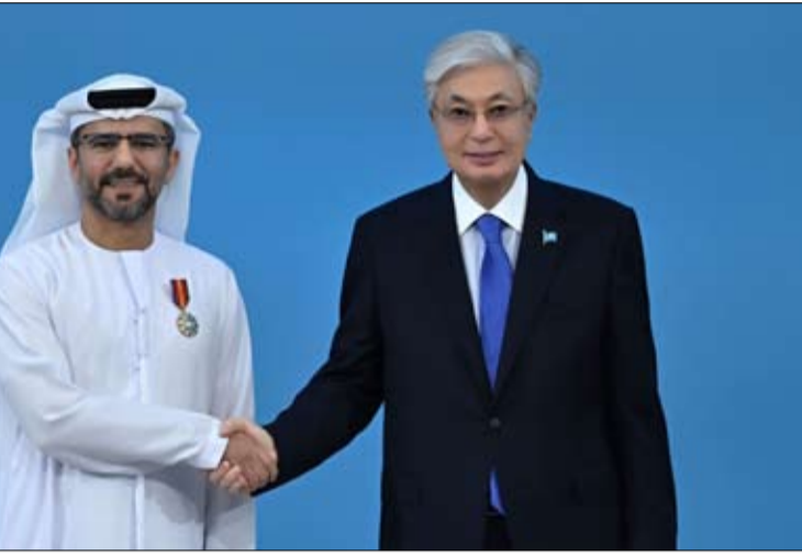
والشخصيات العامة الذين قدموا وإسهامات بارزة في تعزيز علاقات

الماضية باستثمارات تتجاوز 2.9 مليار درهم في قطاعات الموانئ والخدمات البحرية واللوجستية. وبهذه المناسبة، قال الكابتن محمد جمعة الشامسي: «يشرفني أن أتسلم وسام الصداقة من فخامة الرئيس قاسم جومارت توكاييف، رئيس جمهورية كازاخستان، في خطوة تعكس متانة العلاقات بين دولة الإمارات العربية المتحدة وجمهورية كازاخستان، ونجاح الجهود المشتركة في تعزيز التعاون على الصعيدين التجاري والاستثماري». وتماشية مع رؤى