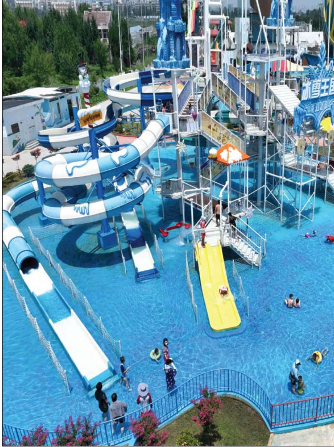
الناس يسترخون في حديقة مائية وسط طقس حار في مقاطعة جيانجسو شرق الصين.