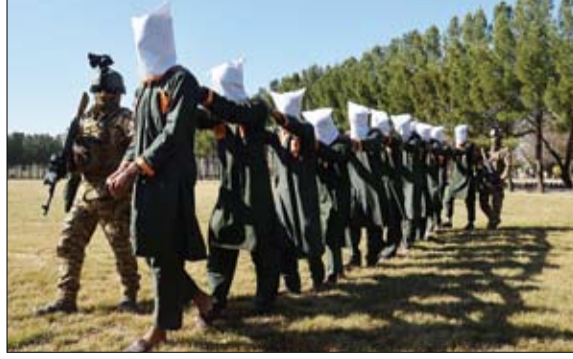
قوات الأمن الأفغانية ترافق معتقلين من طالبان في هرات

وقال المتحدث باسم طالبان لرويترز بأنه لا علاقة لهم بانفجارات كابول. وفي مدينة جلال آباد بشرق البلاد قال آية الله جوياني المتحدث باسم حاكم إقليم نكراهار لرويترز إن جنديا قتل وأصيب اثنان في انفجار استهدف سيارتهم. ووقع انفجار آخر في إقليم باروان بوسط البلاد استهدف مسئول أمن كبير.