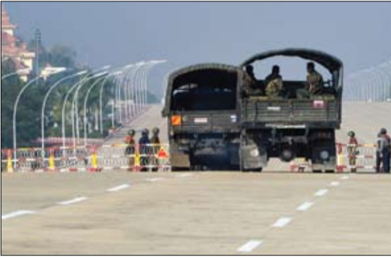
قوات الجيش تحاصر نواب البرلمان

ظل المئات من أعضاء البرلمان في ميانمار قيد الإقامة الجبرية داخل مقر استراحتهم الحكومية في العاصمة البلاد، الثلاثاء، في حين دعا حزب الرابطة الوطنية من أجل الديمقراطية قادة الجيش إلى إطلاق سراح زعيمته وزعيمة البلاد أونج سان سو تشي فوراً. وتأتي هذه التحركات بعد يوم من انقلاب نفذه الجيش، وتضمن اعتقال كبار السياسيين، ومن بينهم الزعيمة الحائزة على جائزة نوبل للسلام، أونج سان سو تشي. وقال أحد النواب إنه و400 من أعضاء البرلمان تمكنوا من التحدث داخل جمعيات الاستراحت، والتواصل مع دوائرهم الانتخابية عبر الهاتف، لكن لم يسمح لهم بمغادرة المجمع السكني في نايبيداو الذي يحاصره الجيش. وقال النائب إن السياسيين الذين ينتمون لحزب الرابطة الوطنية