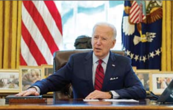
بايدن... مشاكله الداخلية قبل الخارجية

ويأمر الرئيس الديموقراطي أيضاً بمراجعة كل الضوابط على الهجرة الشرعية والاندماج التي طرحها سلفه دونالد ترامب ما سيؤدي إلى "تغييرات جذرية في سياسة الهجرة، كما أعلن مسؤولون كبار في الحكومة. وقال هؤلاء المسؤولون الكبار في الإدارة الأمريكية إن هذه التعليمات ستصدر في سلسلة من المراسم الخاصة بالهجرة التي سيقومها بايدن خلال النهار مؤكداً من خلالها رغبته في مواصلة تقليد الترحيب بالمهاجرين. وقالوا خلال تصريح صحابي إن استراتيجية تستند على أساس أن بلادنا أكثر أماناً ووفرة وازدهاراً بوجود نظام هجرة سليم وعقلاني وإسنادي.