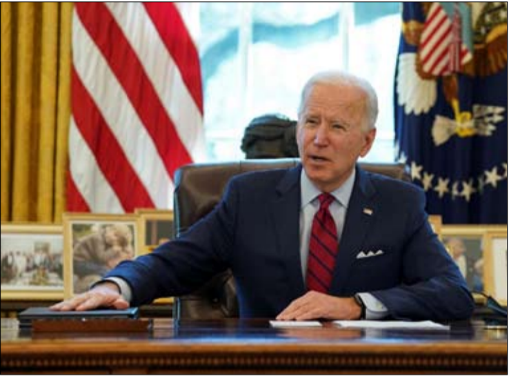
بايدن مشاكله الداخلية قبل الخارجية

ما سيفعله جوبايدن وشي جين بينغ سيكون حاسماً لبقية العالم