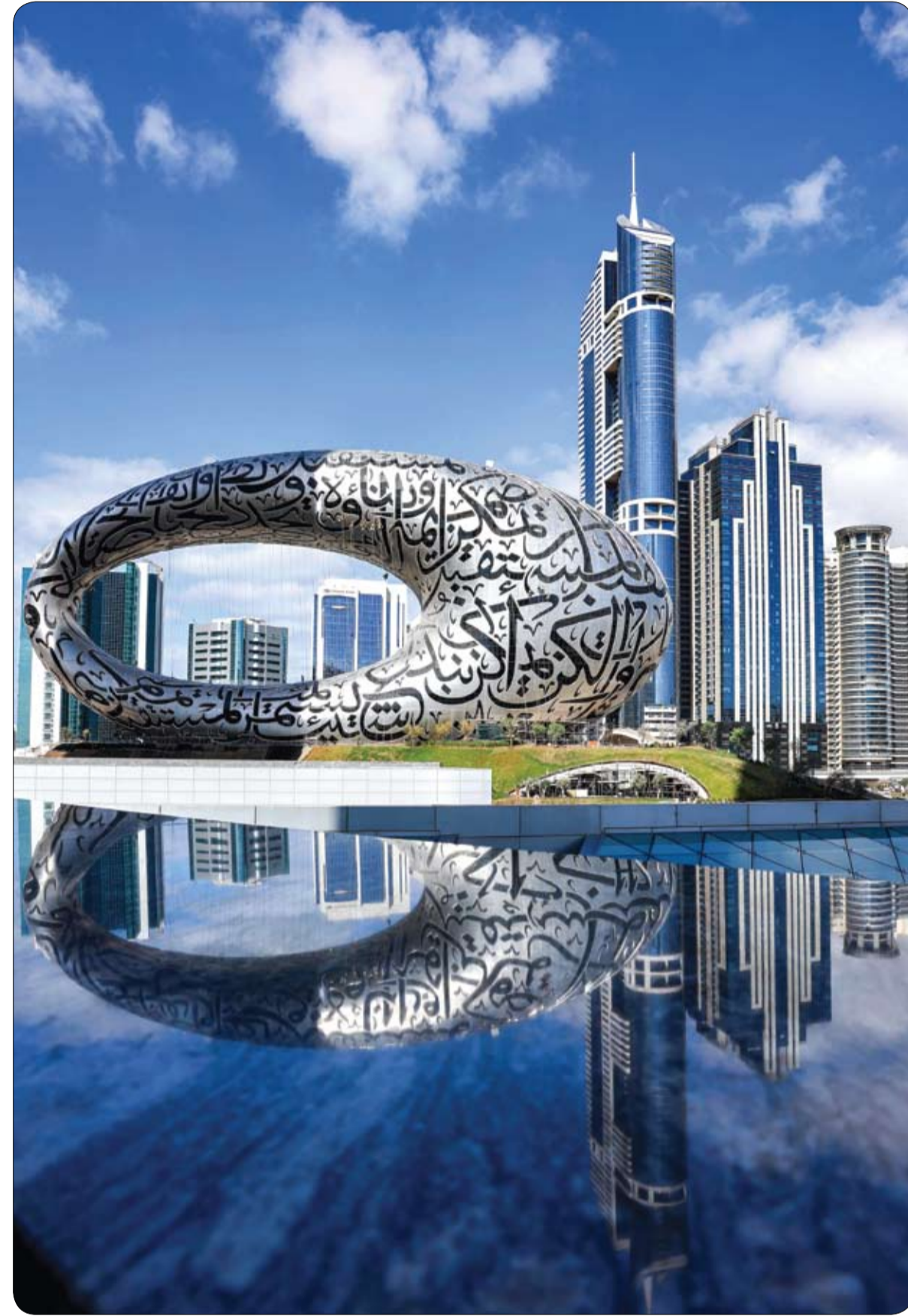
منظر رائع لمتحف المستقبل في دبي.

وتعددت حالات الإصابة بفيروس كورونا في جميع أنحاء العالم، حيث تم الإبلاغ عن أكثر من 100 ألف حالة في الولايات المتحدة وحدها، وبلغت حصيلة الوفيات أكثر من 30 ألفاً.