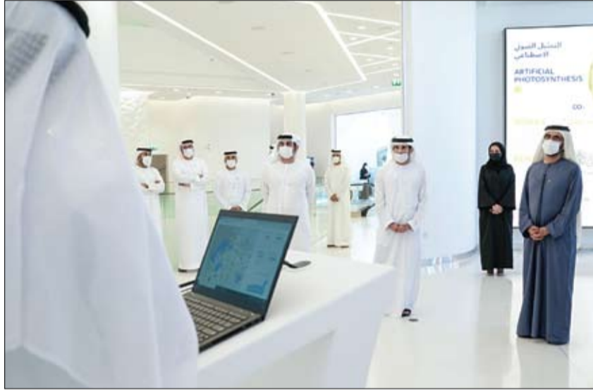
محمد بن راشد يطلق منصة (استثمر في دبي) (وام)

أعلنت هيئة الصحة في دبي عن وصول أول دفعة من لقاح "أسترازينيكا" إلى مطار دبي قادمة من الهند، وذلك في إطار خطط الهيئة لتتبع اللقاحات وإتاحة فرص الاختيار بين مختلف التطعيمات أمام المستهدفين من التطعيم، ونمادياً مع الجهود التي تبذلها مختلف أجهزة الدولة للسيطرة على كوفيد-19. وأعلنت هيئة الصحة في دبي عن شكرها وتقديرها للجهود التي تبذلها وزارتي الخارجية والتعاون الدولي، ووزارة الصحة ووقاية المجتمع، في مواجهة الجائحة والحد من انتشارها. (التفاصيل ص5)