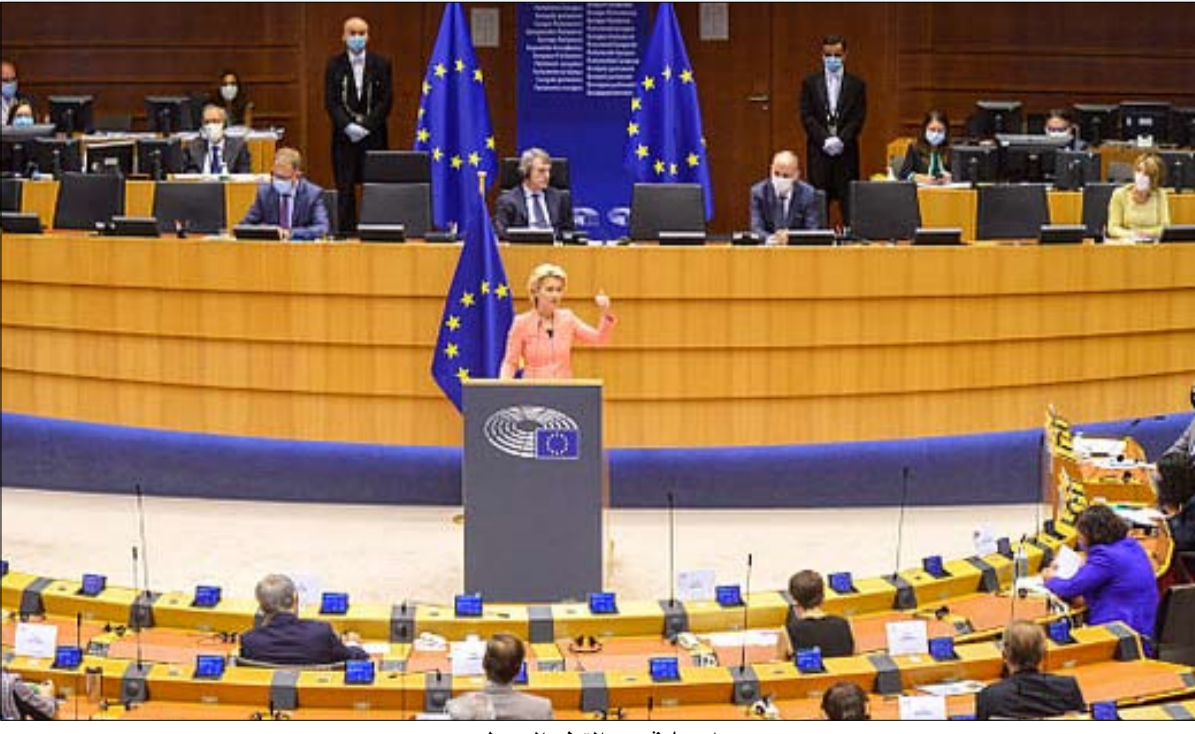
أوروبا في دور القطب الوسيط