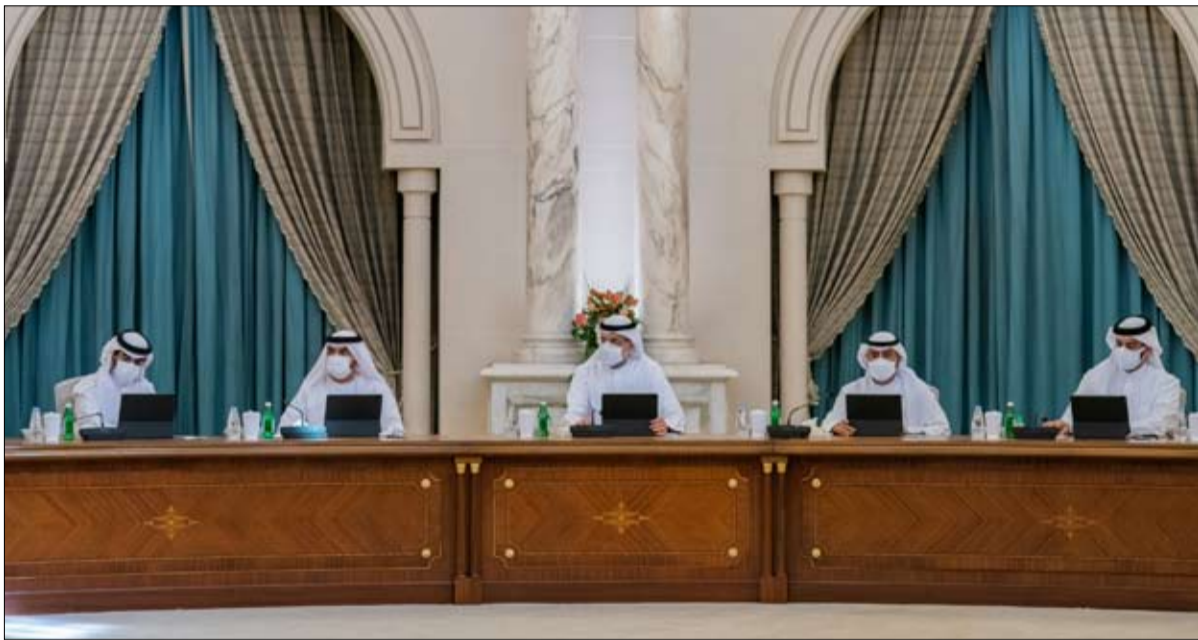
الارتقاء بجودة الخدمات المقدمة. الثاني من الفصل التشريعي العاشر والمجلس الاستشاري لإمارة الشارقة، التي ستعقد يوم الخميس المقبل، واطلع المجلس على جدول أعمال الجلسة العاشرة لدور الانعقاد العادي