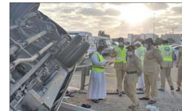
بسبب انحراف مفاجئ... وفاة شخصين وإصابة 10 آخرين في حادث سير بين 3 حافلات بدبي