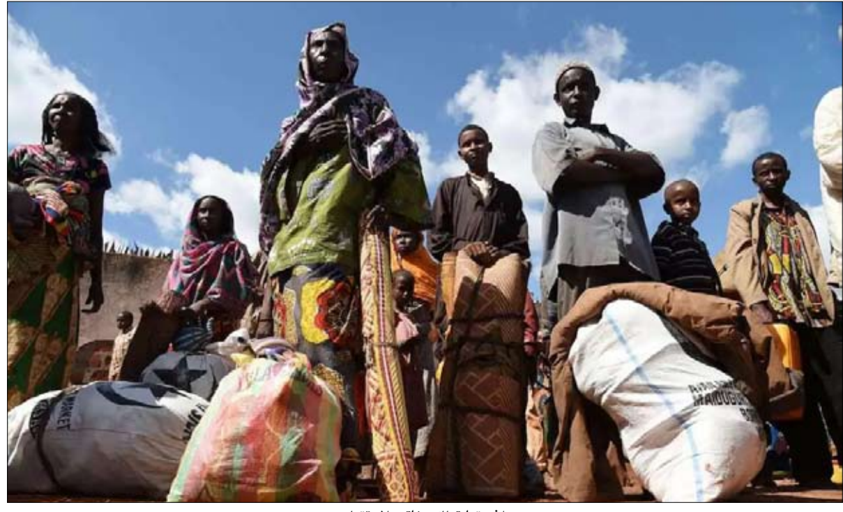
أفريقيا تملك مفاتيح المستقبل