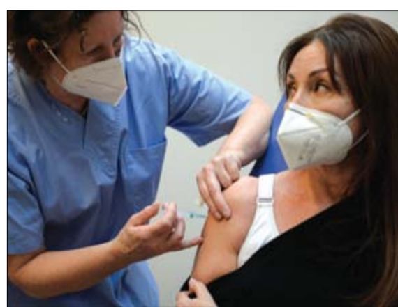
امرأة تتلقى لقاح كورونا في مركز تطعيم في بروكسل

شعبوية اللقاح. لم يبدأ أي بلد منخفض الدخل حتى الآن حملة تطعيم واسعة النطاق. تنتظر هذه البلدان استلام أول دفعة هذا الشهر من اللقاح ضمن آلية كوفاكس، التي وضعتها منظمة الصحة العالمية وتحالف اللقاحات غافي. وفي هذه الفئة، تعد غينيا، التي