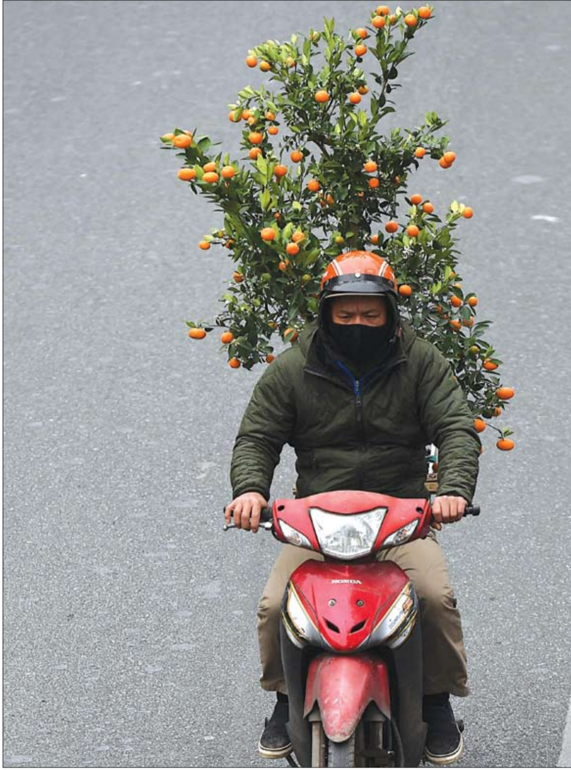
رجل ينقل شجرة برتقال على دراجة بخارية قبل حلول العام القمري الجديد في هانوي، فيتنام

تعد القرفة مضاداً طبيعياً للالتهابات يمنع إفراز حمض الأراكيدونيك، وهو حمض دهني يسبب الالتهاب. ويمكن أن يتسبب حمض الأراكيدونيك هذا أيضاً في تخثر الدم. وفي حين أن كل أنواع القرفة قد تبدو متشابهة، إلا أن هناك نوعين مختلفين: القرفة السليخة (Cassia cinnamon)، وهي الأكثر شيوعاً، والقرفة السيلانية (Ceylon cinnamon)، كلاهما يمتلكان الصفات المضادة للموتور. ومع ذلك، تحتوي قرفة السليخة على مادة الكومارين، وهي مركب موجود في بعض الأنواع النباتية يمكن أن يكون ضاراً إذا تم تناوله بكميات كبيرة.