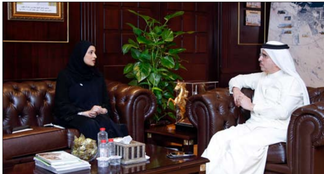
الأميركية والمركز الوطني الإسباني للطاقة المتجددة في مجال البحوث والتطوير والتعرف على أحدث التطورات العالمية في مجالات الطاقة والمياه والبيئة وتعاونها مع جامعة الإمارات العربية المتحدة وجامعة خليفة في مجال البحوث والدراسات المشتركة في مجالات الطاقة المتجددة والبيئة.

اطلعت معالي سارة بنت يوسف الأميري وزيرة دولة من سعادة سعيد محمد الطاير العضو المنتدب الرئيس التنفيذي لهيئة كهرباء ومياه دبي على جهود الهيئة في ترسيخ مكانة دولة الإمارات العربية المتحدة كنموذج عالمي متميز لبيئة حاضنة للأبحاث والعلوم وصناعة مستقبل أفضل للأجيال المقبلة. وقال الطاير خلال اللقاء انه لتحقيق هذا الهدف وضعت الهيئة خططاً استراتيجية واضحة لدعم أجنحة العلوم المتقدمة للارتقاء بالمعرفة وتشجيع البحث العلمي ما ينجم مع الأجنحة الوطنية لمئوية الامارات 2071 ورؤية الامارات 2021 وخطة دبي 2021. وتحدثت سعادته عن مركز البحوث