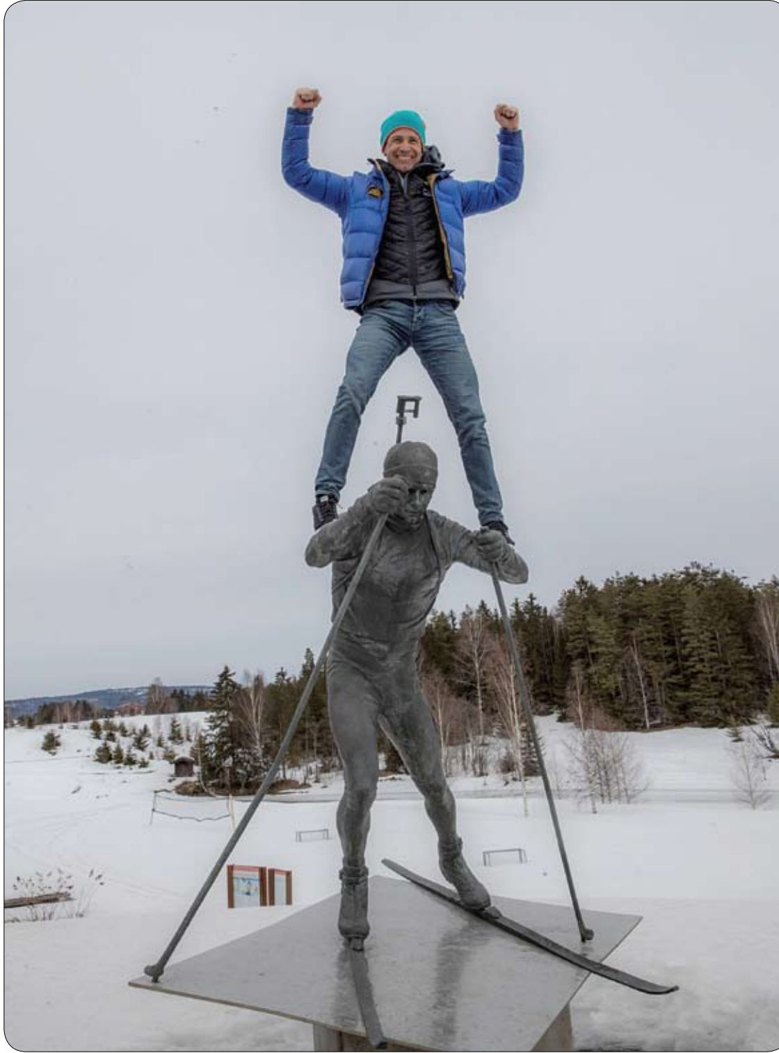
أولي إينار بيورنراندن يقف فوق تماثله ، بعد مؤتمر صحفي في النرويج حيث أعلن اعتزاله رياضة البياتلون.

لا بد من التوجه للطبيب على الفور لأنه يجب إعادة زرع السن المخلوعة خلال ساعة أو ساعتين بعد سقوطها، ويوضح (الطاروطي) أنه يتم علاج جذور السن وعمل جشو لها وتركيب جبيرة، ويساعد ذلك على تثبيتها في الفك مرة أخرى، مشيراً إلى أنه إذا كان المريض لا يزال طفلاً فيتم تركيب غطاء للسن بعدما يتم 14 عاماً.