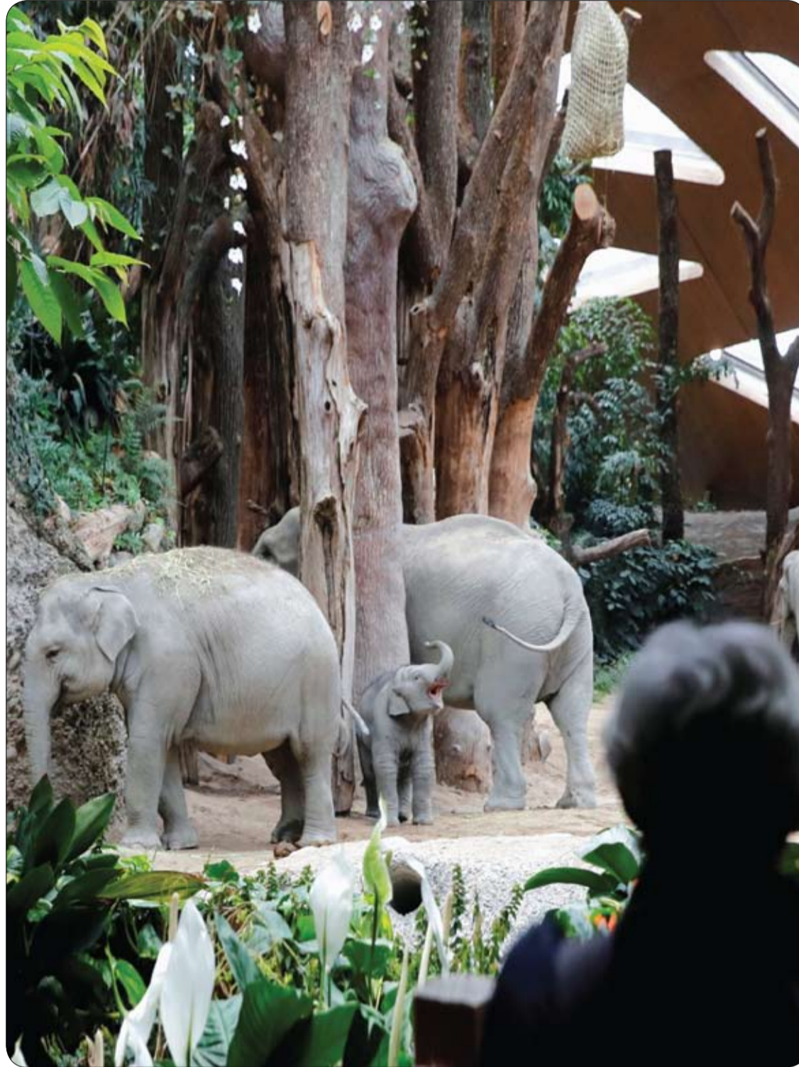
الزوار يشاهدون الأفيال في حديقة حيوان زيورخ التي أعيد فتحها عقب تخفيف إجراءات الإغلاق في سويسرا.