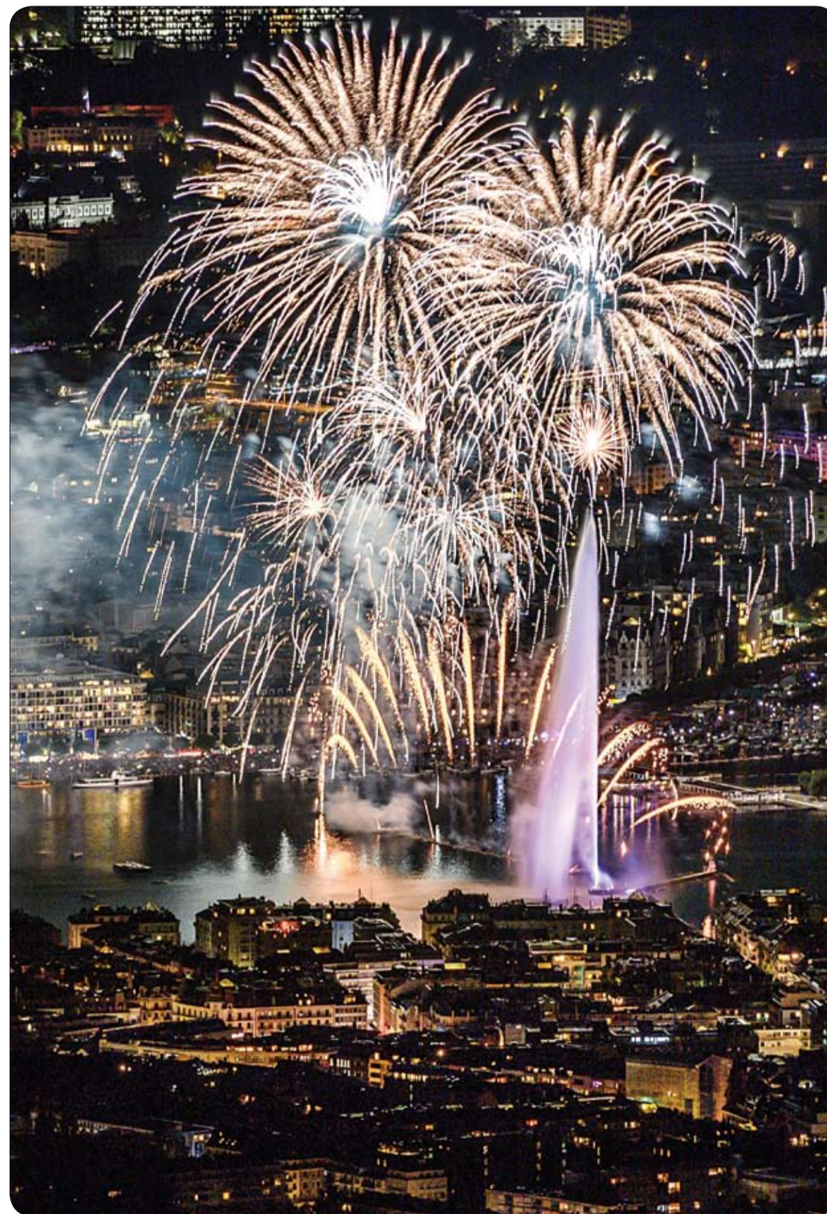
صورة التقطت من جبل فرنسي، تظهر الألعاب النارية التي تضفي مدينة جنيف خلال 45 دقيقة من عرض الألعاب النارية التقليدي. (ا ف ب)

ويقول الشاب البريطاني "الحق في السفر والعيش والعمل في أوروبا من دون العائلات الإدارية الضئيلة امتياز كبير"، مضيفاً: "سيكون من المؤسف حقاً تعقيد هذه الإجراءات".