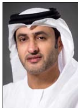
بن زايد آل نهيان رئيس الدولة "حفظه الله".

قالت نشرة أخبار الساعة إنه عندما انطلقت عاصفة الحزم قبل أكثر من ثلاث سنوات، لقيت دعماً يمينياً وعربياً ودولياً يكاد يكون غير مسبوq بالنظر إلى تحالفات أخرى نشأت بعيداً عن أي توافق إقليمي أو دولي. وأضافت في افتتاحيتها تحت عنوان "التحالف يساعد ويبنى والآخرين يخربون ويقتلون" أنه على عكس الكثير من تلك التحالفات، فإن التحالف العربي بقيادة المملكة العربية السعودية، استند بشكل فعلي إلى قرارات الجامعة العربية، وكذلك الشرعية الدولية، حيث صدرت قرارات من مجلس الأمن تؤيد العملية وتمتئها؛ تستند إلى ميثاق الأمم المتحدة الذي يجيز للحكومات الشرعية طلب المساعدة من دول أخرى؛ فالتحالف لم يأت إلا بعد أن طلب الرئيس عبدربه منصور هادي بشكل رسمي من المملكة العربية السعودية المساعدة بعد الانقلاب الذي دبره الحوثيون، بالترتيب مع قوى ودول شريرة لا تريد لليمن وللمنطقة إلا الخراب والدمار.. وذكرت أنه منذ ذلك الوقت والتحالف العربي يقوم بمهامه وما تتطلبه معطيات الواقع على الأرض بكل احترافية ومهنية، ويعمل بكل ما أمكن لضمان عدم إلحاق أي أذى بأي مدني، صغيراً كان أو كبيراً، رجلاً كان أو امرأة؛ فالتحالف جاء لمساعدتهم وإنقاذهم، وليس لإيذائهم أو تدمير مدتهم، بل إن التأخير في تحرير بعض المناطق وكذا كامل البلاد، حتى الآن من الميشتيات الحوثية، هو الحرص على المدنيين؛ فالتحالف يملك إمكانيات هائلة، ولا يوجد هناك شك في التفوق الجوي والبحري على المتمردين؛ ولو قام التحالف باتباع استراتيجيات الحرب المفتوحة والشاملة لتمكن من تحرير صنعاء وغيرها في غضون أسابيع وليس أشهر؛ ولكن ما يمنع التحالف من ذلك هو الحرص على المدنيين، والحفاظة على الممتلكات والبنى التحتية.