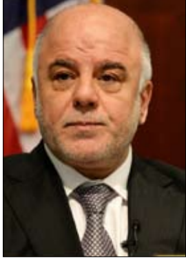
•• بغداد-أ ف ب: أعلن مسؤول حكومي عراقي امس ان رئيس الوزراء حيدر العبادي الذي كان مقررا ان يتوجه الى تركيا وايران الأسبوع الجاري سيقوم بزيارة أنقرة فقط دون طهران، بسبب ازحام جدول أعماله وعدم تكامل الاعداد لذلك. وقال مسؤول سياسي في وقت سابق، لفرانس برس إن العبدي سيزور الثلاثاء أنقرة والأربعا طهران، ليبحث قضايا اقتصادية مع الحليفين الاقتصاديين اللذين يتعرضان لعقوبات اميركية جديدة.

وقال المتحدث باسم وزارة الشؤون الخارجية الإيرانية برهم قاسمي لوكالة ايسنا شبه الرسمية "ليس لدينا أي معلومات عن مثل هذه الزيارة"، كما تحدثت وسائل اعلامية إيرانية عن هذه الزيارة. بدوره، قال مسؤول عراقي أن "السلطات الإيرانية اصرت على قيام العبدي بهذه الزيارة دون تكامل الأعداد المسبق لها.. من جهة اخرى، أكدت مصادر سياسية عراقية مطلعة ان الإيرانيين غير مرتاحين ازاء التصريحات الاخيرة للعبادي حول العقوبات الاميركية على طهران. وقد أعلن العبدي خلال