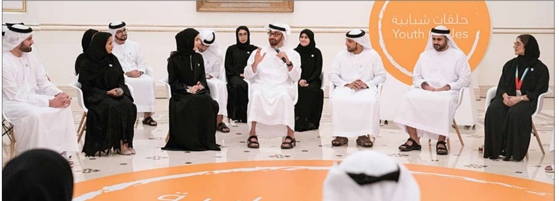
محمد بن زايد يدعو الشباب إلى نقل الصورة الحضارية المشرفة لدولتنا وقيمتها الأصيلة وثقافتها الغنية إلى شعوب العالم (وام)

الهلال الأحمر تكمل مشروع قسم الجراحة بمستشفى الشيخ زايد في مدينة فوشترى بكوسوفا •• فوشترى - كسوفافا-وام: أنجزت هيئة الهلال الأحمر الإماراتي وبدعم وتعاون هيئة الصحة -أبو ظبي مشروع قسم الجراحة بمستشفى الشيخ زايد بمدينة فوشترى بجمهورية كوسوفافا بتكلفة بلغت 1 مليوناً و387 ألف درهم، وذلك ضمن جهود الهيئة الإنسانية لتعزيز الخدمات الطبية والصحية لمستشفى الشيخ زايد بمدينة فوشترى بالإضافة الى تقديم العديد من المساعدات الإنسانية وخدمات البنية التحتية للمرافق والمباني الخدمية المختلفة التي نفذتها الهيئة في عدد من المدن بكوسوفا. (التفاصيل ص13)