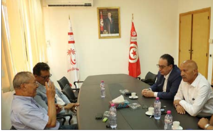
لقاء بين النداء وحزب المستقبل

وفي هذا السياق، أكد الأمين العام لحركة مشروع تونس محسن مرزوق على هامش اجتماع حزبه، وجود تقدم حالياً بشأن بناء توافق بين كتل نيابية من شأنه إيجاد "كتلة نيابية وطنية عصرية ستكون الأولى في مجلس نواب الشعب". وقال مرزوق، إن هذه الكتلة