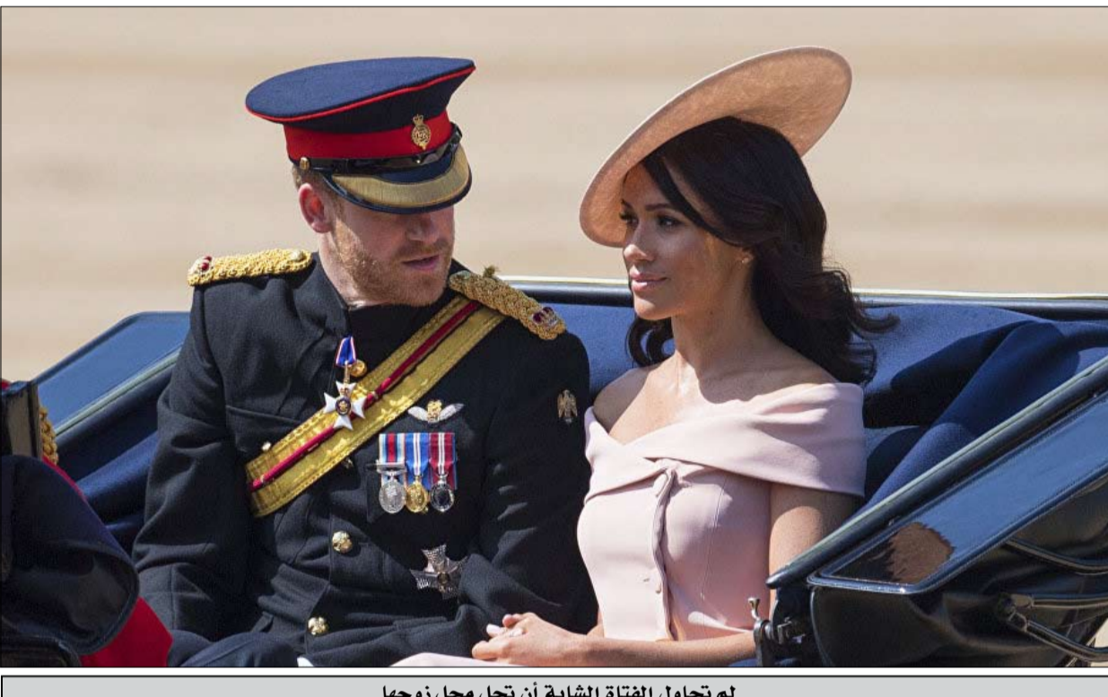
لم تحاول الفتاة الشابة أن تحل محل زوجها