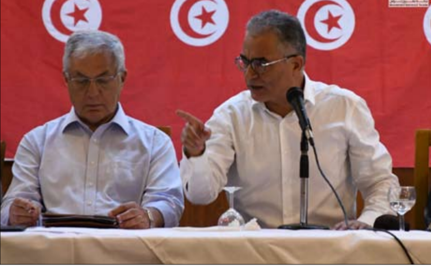
مرزوق كتلة برلمانية جديدة

الائتلاف، سيعمل على المحافظة على الكيانات الحزبية، ولكنه سيكون قيادة موحدة تجمعهما، لتعيد التوازن داخل الساحة السياسية وتعمل في أفق بعيد المدى إلى ما بعد الانتخابات التشريعية القادمة. وتضم المشاورات في أفق الإعلان عن هذا الائتلاف، وفق الحزباوي، كلا من حركة نداء تونس وحركة مشروع تونس وحزب بني وطني وحركة المستقبل. وأكدت مصادر أن هذه الجبهة ستكون برلمانية أيضاً، بما يعني كتلة تضم أكثر من 70 نائبا ما يجعل منها الأولى في مجلس نواب الشعب قبل النهضة صاحبة الـ 68 مقعداً.