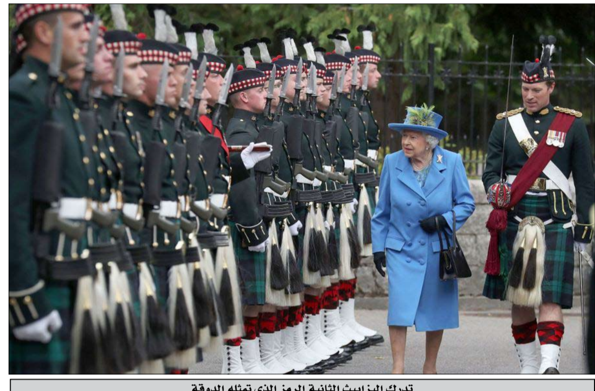
تدرك إليزابيث الثانية الرمز الذي تمثله الدوقة