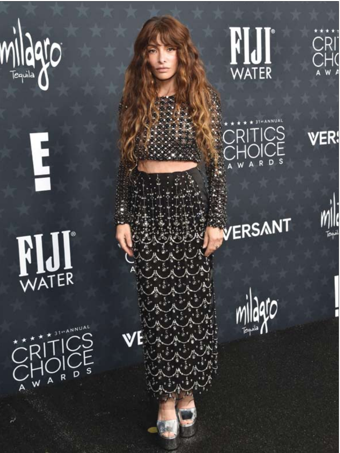
الممثلة الأمريكية سارة شاهي لدى حضورها حفل توزيع جوائز اختيار النقاد السنوي الـ31 في باركر هانغار، كاليفورنيا.