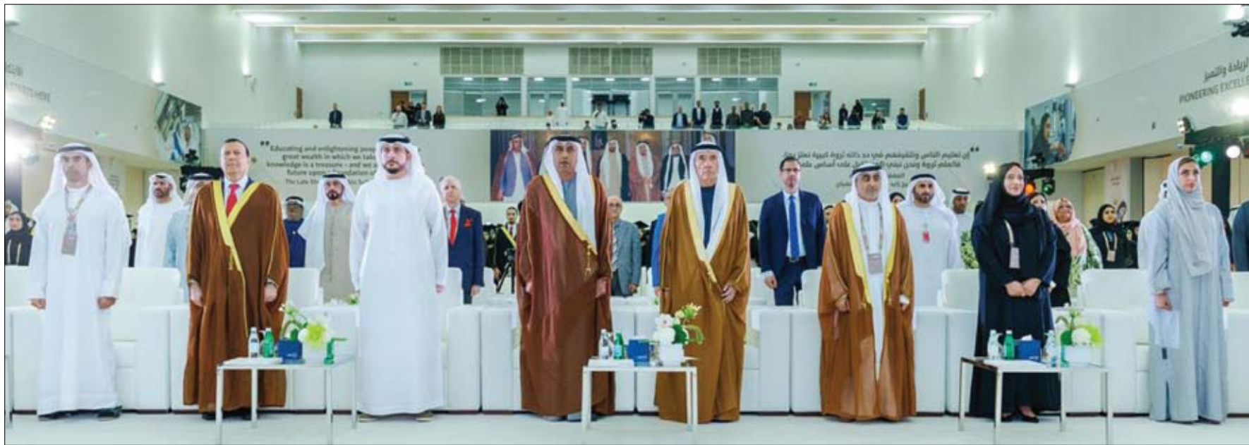
بحضور القيادات الأكاديمية وأعضاء هيئة التدريس وأسر الخريجين