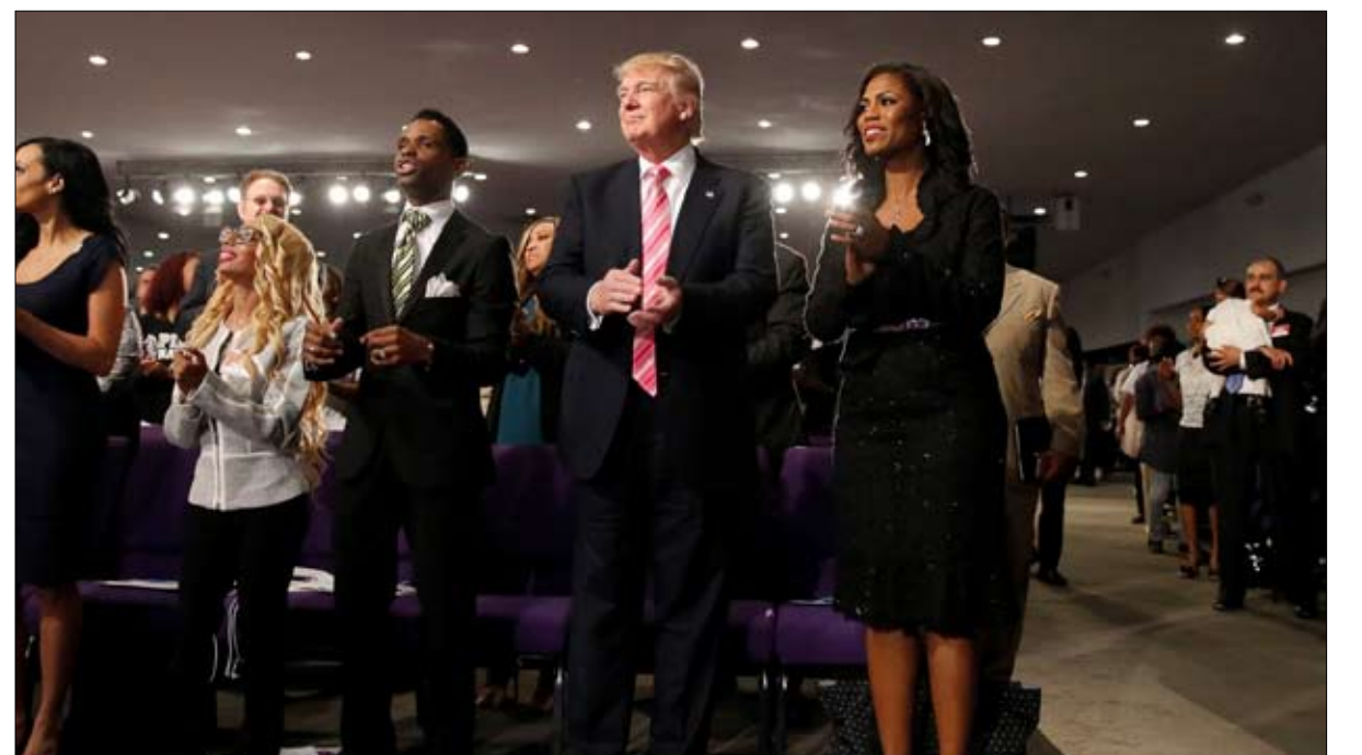
من الحضور الدائم.. الى صمت الغياب