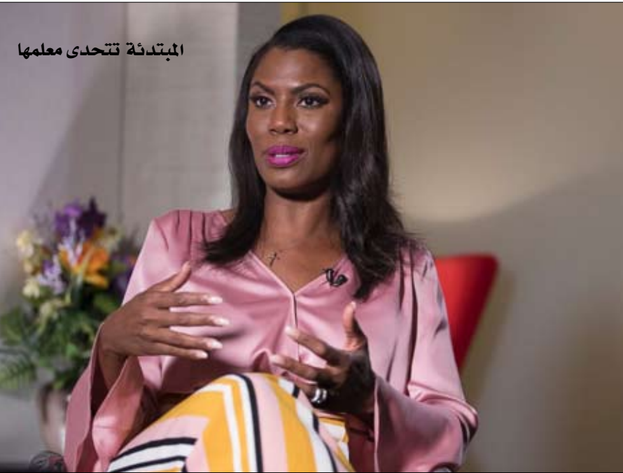
المتدنة تتحدى معلمها