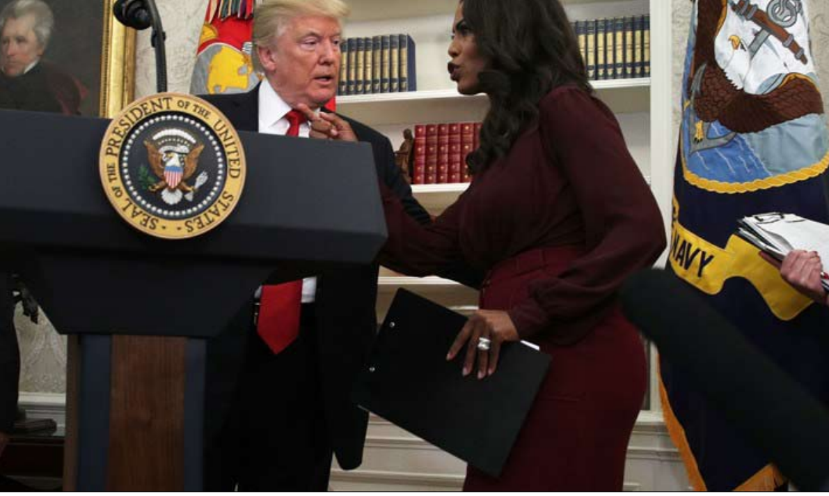
من الحب والولاء الى الكراهية والانتقام