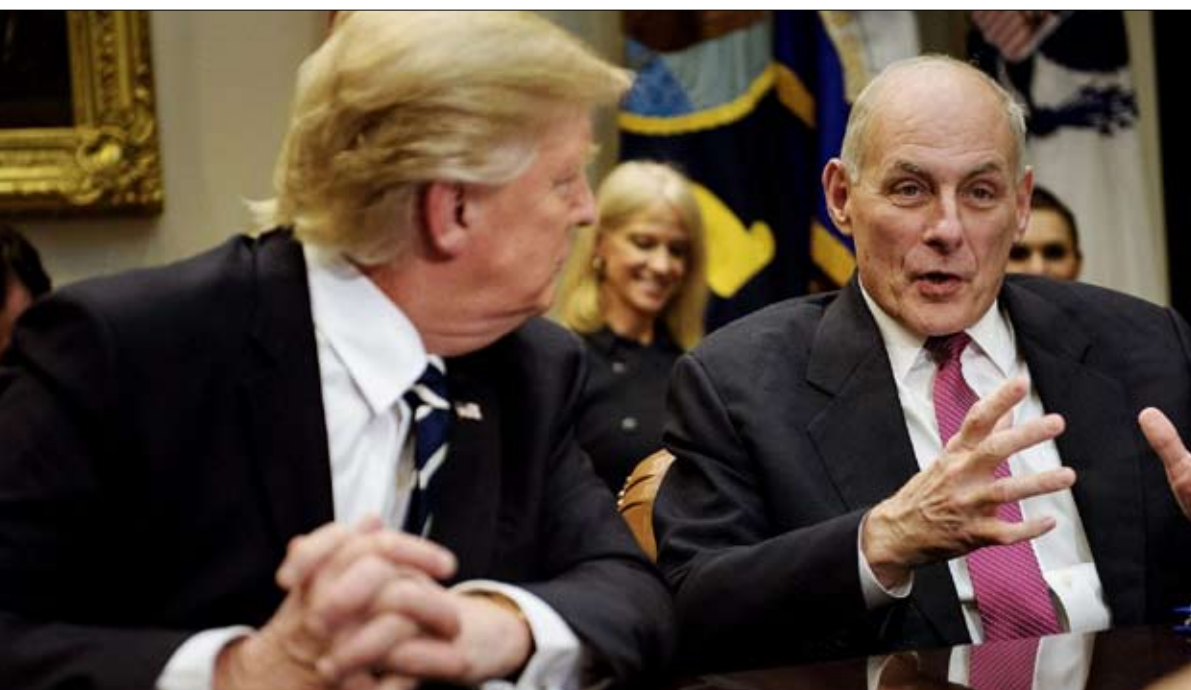
هل فتح كيلى عش الدبابير مجددا؟