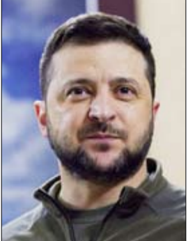
مؤشر على أن السياسة الدفاعية الأمريكية قد تتجه نحو تقليص الالتزامات الأوروبية.

يلتقي رئيس الوزراء شيجيرو إيشيبا الرئيس الأمريكي دونالد ترامب خلال قيامه بزيارة للولايات المتحدة هذا الأسبوع، وفق ما أفاد الناطق باسم الحكومة اليابانية يوشيشيما هاياشي الثلاثاء. وقال هاياشي إذا سمحت الظروف، سيزور الولايات المتحدة في الفترة من 6 إلى 8 شباط-فبراير ويعقد أول اجتماع (...) مع الرئيس ترامب في واشنطن. وأضاف «نأمل من خلال هذه الزيارة في بناء علاقة ثقة قوية مع الإدارة الأمريكية الجديدة والارتقاء بالتحالف الأمريكي الياباني إلى آفاق جديدة». وذكرت صحيفة «نيكي بيزنس»، أن إيشيبا يريد مناقشة زيادة واردات الغاز الصخري الأمريكي مع ترامب، وهو ما يتوافق مع استراتيجية الملياردير الجمهوري. وأجرى إيشيبا مكالمة هاتفية قصيرة في تشرين الثاني-نوفمبر مع الرئيس المنتخب آنذاك ترامب، في حين أفادت تقارير بأنه سعى دون جدوى للقاءه قبل تنصيبه في كانون الثاني-يناير. والأسبوع الماضي، أكد إيشيبا أهمية العلاقات الوثيقة مع الولايات المتحدة من أجل الاستقرار الإقليمي. وقال إيشيبا أمام البرلمان في الوقت الذي يشهد ميزان القوى في المنطقة تغييراً تاريخياً، يتعين علينا تعميق التعاون الياباني الأمريكي بشكل أكبر وبطريقة ملموسة. وتطرقت تصريحاته إلى المخاوف بشأن الحشد العسكري الصيني في منطقة آسيا والمحيط الهادئ وسياسات ترامب «أمريكا أولاً»، التي قد تشمل مطالبة حلفاء مثل اليابان بتحمل نسبة أكبر من تكاليف الدفاع.