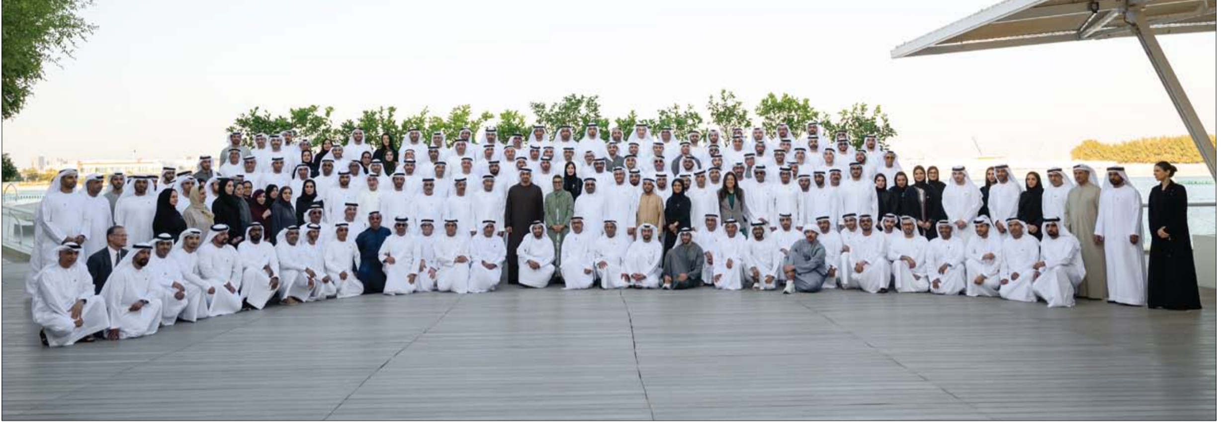
استقبل سفراء الإمارات وممثلي بعثاتها المشاركين في ملتقى السفراء الـ 19 في أبوظبي