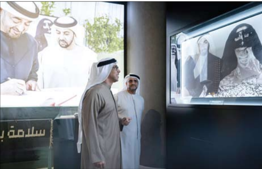
منصور بن زايد يتطلع على قاعة الشيخ سرور بن محمد آل نهيان في الأرشيف والمكتبة الوطنية

•• أبو ظبي-وام: يأتي إنشاء قاعة الشيخ سرور بن محمد آل نهيان انطلاقاً من اهتمام الأرشيف والمكتبة الوطنية بجمع ذاكرة الوطن وحفظها، وحرصه على جمع الوثائق والسجلات التاريخية بوصفها أصولاً وطنية ثمينة، والوثائق الشخصية التاريخية التي تحفظ للأجيال بهدف تعزيز الهوية الوطنية، وضمان استدامة المعرفة وإثرائها.