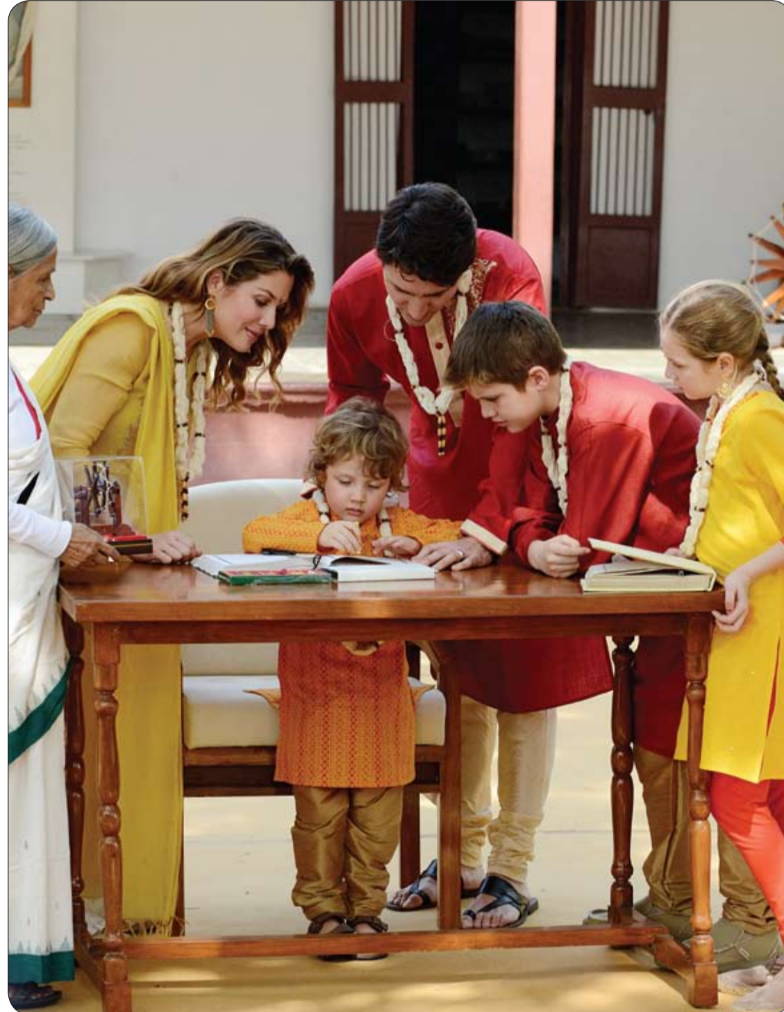
رئيس الوزراء الكندي جاستن ترودو وزوجته يتابعان ابنتهما الصغيرة هادريان وهو يوقع في كتاب الزوار خلال زيارتهم للنصب التذكاري للزعيم الهندي غاندي.

وبعد 3 أشهر، كشف فحص الأنسجة أن النيفرون (الوحدة الهيكلية والوظيفية الجهرية للكلية)، قد تشكل ونما. ولاختبار وظائف الهياكل الجديدة، استخدم الفريق مركب ديكستران، وهو بروتين الفلوروسنت المستخدم طبيا كمضاد للتخثر، ويطلق على العملية اسم الترشيب الكبيبي. وتفتح العلماء مركب الديكستران إلى جانب تحديده في أنابيب الهياكل الجديدة، وقال البروفيسور كيمبر: "تمكنا من إثبات أن هذه الهياكل تعمل كخلايا الكلى عن طريق تصفية الدم وإنتاج البول، على الرغم من أننا لا نستطيع الجزم بنسبة نجاحها حالياً". وتحتوي الهياكل الجديدة على معظم الأجزاء المكونة من نيفرون الإنسان، بما في ذلك الأنابيب القريبة والبعيدة، وكبسولة بومان (الكبيبات) والتواء هنلي. ومع ذلك، تفتقر الكلى المصغرة للشريان الكبير، لذا يعمل العلماء مع الجراحين لوضع هذا الشريان، بهدف إيصال المزيد من الدم إلى الكلى الجديدة.