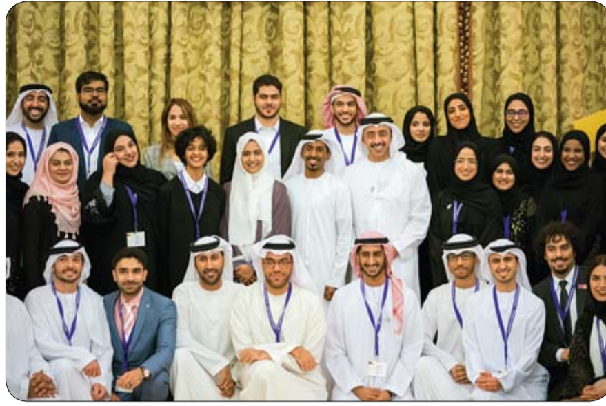
في جامعة نيويورك أبوظبي