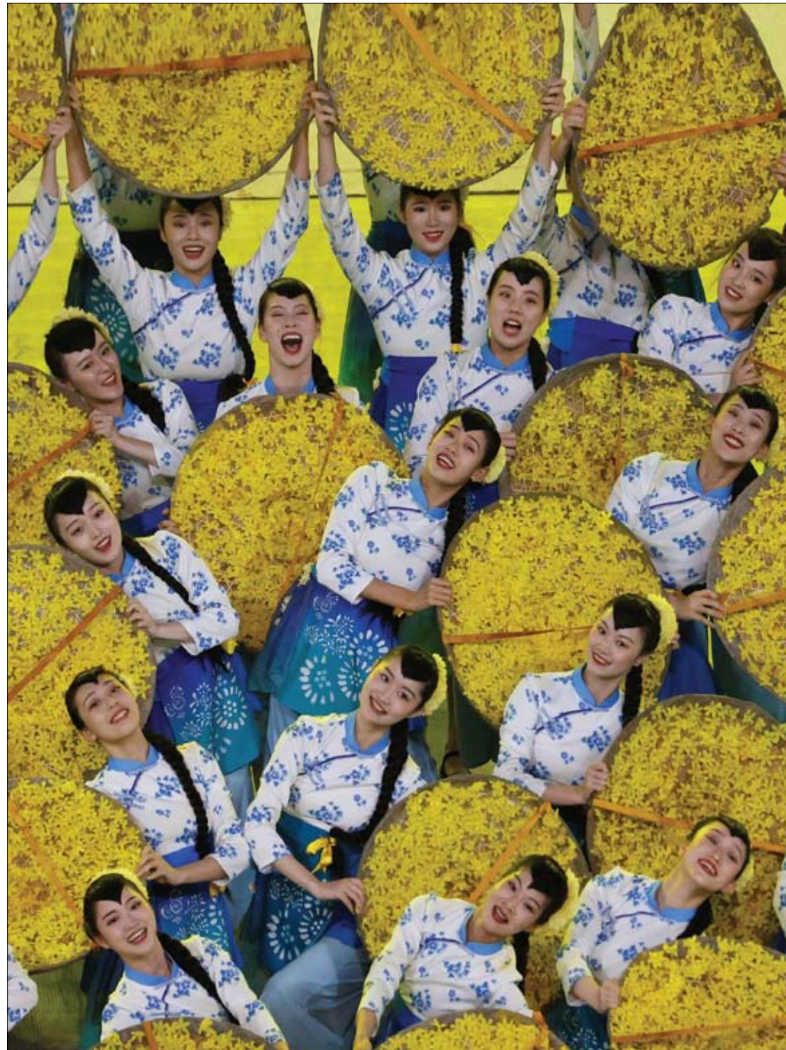
فنانات يشاركن في عرض لإحياء الذكرى المئوية لتأسيس الحزب الشيوعي الصيني في استاد الوطني في بكين.

قال الطبيب المعروف أوليغ سيريريانسكي، إنه لا يوجد في الطب التقليدي تلاعب عديم الفائدة بشكل تام، لأنه يوجد معنى وقيمة لأي وصفة من جانب الطبيب. ولكن الطبيب، شدد في حديث مع وكالة "برايم" الإعلامية، على أنه لا يجوز التماسي استخدام بعض الوصفات، ولا يجوز إنفاق كل المال عليها. وذكر الطبيب، أن الكثير من هذه الوصفات معروفة ومألوفة من جانب معظم المرضى، ومن بينها على سبيل المثال، شطف الأنف بماء البحر عند الزكام. وفي كثير من الأحيان، ينصح الأطباء بأدوية يكون سعرها مرتفعاً جداً، على الرغم من وجود البديل الأرخص سعراً، يمكن مثلاً تحقيق نفس التأثير عن طريق الشطف بالماء المالح أو المحلول الملحي. وأكد الطبيب، أن الشيء نفسه ينطبق على العلاج الطبيعي. وأشار إلى عدم وجود أي إثبات علمي يؤكد على أن هذه الوصفات تساعد على الشفاء. وقال: "عادةً، يتم التمسك بهذه الوصفات، بالتزامن مع العلاج الأساسي أو في الفترة التي تليه". وأكد الطبيب أن العلاج الطبيعي تحت إشراف متخصصين، لن يضر بالجسم، لكن لا تتوقعوا الكثير من الفوائد بفضله". ونصح سيريريانسكي، بعدم تناول أي الدواء بدون رقابة الأطباء، لأن ذلك قد يتسبب بالضرر بدلا من مساعدة الجسم على الشفاء واستعادة صحته، وشدد على أن ذلك يتعلق بشكل خاص بالفيتامينات والمكملات الغذائية - لأن فوائدها غير مؤكدة وأسعارها قد تفرق جيوب المرضى.