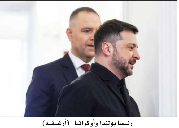
رئيسا بولندا وأوكرانيا (أرضيفية)

روته: حلف الناتو مستعد للدفاع عن «كل شبر» من أراضيه •• عواصم-وكالات: قال مارك روته الأمين العام لحلف شمال الأطلسي أمس الجمعة إن الحلف مستعد للدفاع عن كل شبر من أراضيه، وذلك بعد أن أصابت طائرة مسيرة بنائية سكانية في رومانيا العضو في الحلف خلال هجوم روسي خلال الليل على أوكرانيا. وأضاف في منشور على إكس «سلوك روسيا المتهور يشكل خطراً علينا جميعاً... أظهرت اللبلة قبل الماضية مرة أخرى أن تداعيات حربهم العدوانية غير المشروعة لا تتوقف عند الحدود». وتابع قائلاً «سنواصل تعزيز قدراتنا على الردع والدفاع في الداخل، وسنواصل دعمنا لأوكرانيا في دفاعها ضد العدوان الروسي». بدورها، قالت رئيسة المفوضية الأوروبية أورسولا فون دير لاين الجمعة إن روسيا تجاوزت الحدود مجدد، بعد أن سقطت إحدى طائراتها المسيرة في منطقة مكتظة بالسكان في رومانيا ما أدى لإصابة مدنيين خلال هجوم وقع ليلاً في أوكرانيا المجاورة. وأضافت فون دير لاين في منشور على منصة إكس «نتضامن بشكل كامل مع رومانيا وشعبها... وبينما نواصل تعزيز أمننا وقدرتنا على الردع، رئيس بولندا يقترح سحب أرفع وسام من زيلينسكي •• وارسو-وكالات: اقترح الرئيس البولندي كارول نافروتسكي أمس الجمعة تجريد الرئيس الأوكراني فولوديمير زيلينسكي من أرفع وسام تمنحه بولندا، وذلك بعدما أطلق الأخير اسم منظمة UPA القومية الأوكرانية على وحدة عسكرية، وهي منظمة متهمه بارتكاب مجازر بحق البولنديين خلال الحرب العالمية الثانية. وبينما أعرب نافروتسكي عن «غضبه الشديد»، قال للصحفيين إنه اقترح سحب وسام النسر الأبيض من الرئيس زيلينسكي، بحسب «فرانس برس». وفي وقت سابق، أعلن الجيش البولندي أن سلاح الجو البولندي يعمل في المجال الجوي لبلداد عقب هجمات روسية على أوكرانيا.