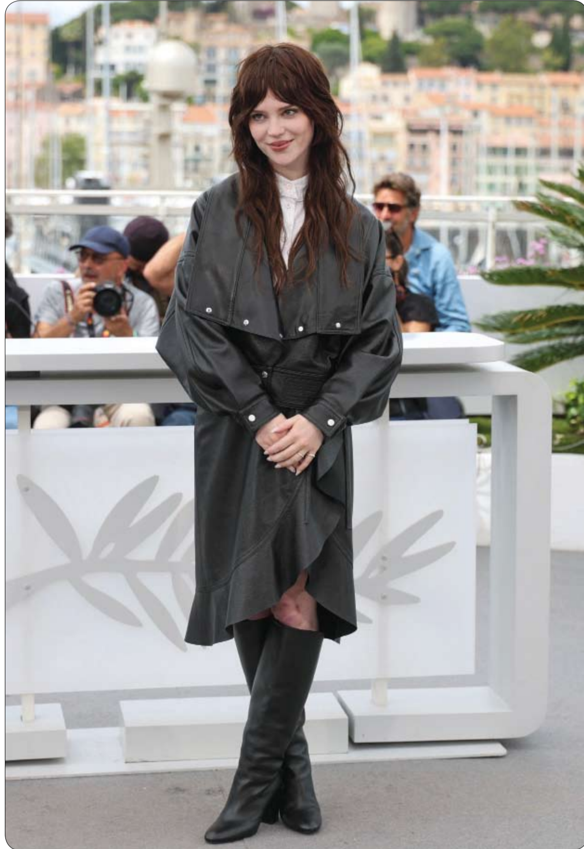
التمثلة الأمريكية صويي تاتشر خلال جلسة تصوير لفيلم «جيهيما الخاص»، في الدورة التاسعة والسبعين لهرجان كان السينمائي. ا ف ب

أعلنت السلطات الكورية الجنوبية عن اعتقال «يوتوبس» بارز بتهمة الفبركة وتشويه سمعة الممثل الشهير «كيم سو-هون». عبر استخدام تقنيات الذكاء الاصطناعي لتلفيق أدلة نسبت في تدمير المسيرة المهنية للنجم الكوري. أصدرت محكمة منطقة سيؤول المركزية أمراً باعتقال المدعو «كيم سي-أوي»، الذي يدير قناة فضائية المشاهير الشهيرة Hover Lab، التي تحظى بنحو مليون مشترك. وجاء القرار خوفاً من احتمالية تدميره للأدلة أو هروبه.