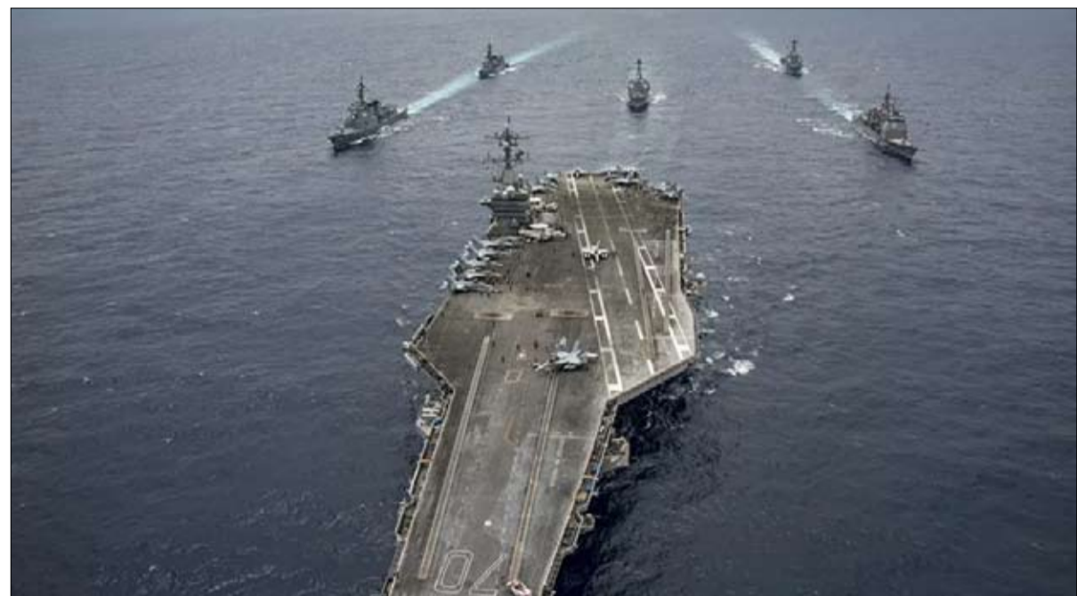
اطلسي مصفر في الأفق

وهو أيضاً أستاذ محاضر في التاريخ في الجامعة الكاثوليكية في ليل، وكذلك المدير المساعد لتقنين الأمن والدفاع في كرسى راؤول دانوراند للدراسات الاستراتيجية والدبلوماسية بكندا. ورئيس تحرير المجلة القطبية "العالم الصيني، آسيا الجديدة"، ومؤلف لنحو ثلاثين كتاباً عن القضايا الجيوسياسية. × عام 2021، لا تزال التوترات قوية للغاية بين واشنطن وبكين، ما هو نوع توازن القوى الذي هم عليه حالياً؟ - المنافسة بين الصين والولايات المتحدة ليست حديثة، بل هي تؤكد نفسها على أنها ثابتة منذ نهاية الحرب الباردة. ولكن إذا كانت ثابتة في مجملها، فهناك بعض التطورات المهمة جداً على مستوى الشكل. على الجانب الصيني، تختلف قيادة جيانغ زيمين أو هو جينتاو اختلافًا كبيراً عن قيادة شي جين بينغ، أولاً لأن الصين تطورت بشكل كبير -ونمت بشكل صاروخي- في ثلاثة عقود، ثم لأن الرئيس الصيني الحالي يرمز إلى موقف التحرر من كل العقد على