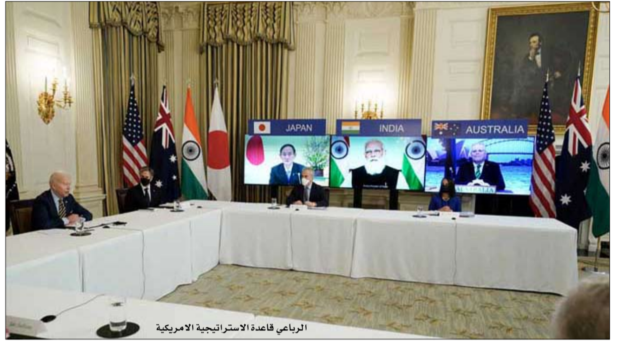
الرباعي قاعدة الاستراتيجية الأمريكية

ليست حديثة، بل ثابتة منذ نهاية الحرب الباردة: