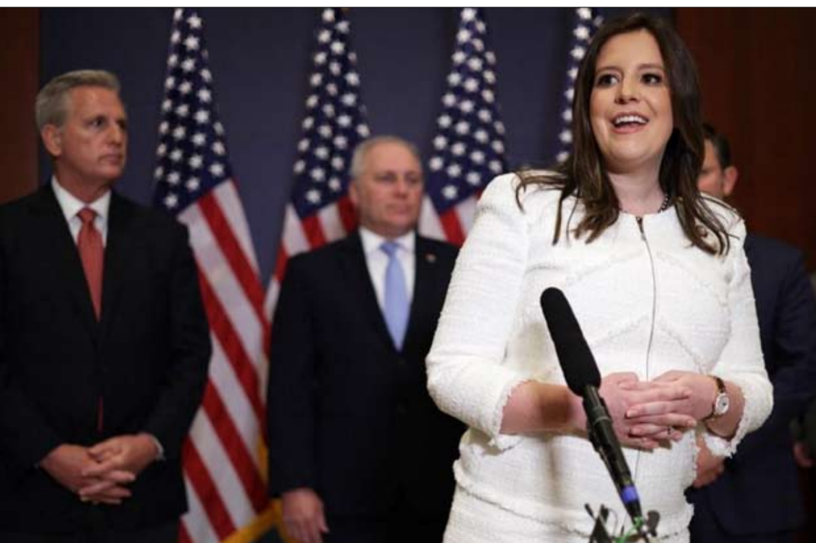
ليز ستيفانيك، من أشد المؤيدين لترامب

ومثل ليز تشيني، يعتبر المائة، أو نحو ذلك، من الموقعين على الرسالة، أن ترامب قد تجاوز الحد من خلال تشويه سمعة العملية الانتخابية دون دليل، وأن التشكيك في نزاهة النتائج: "عندما نشأ في جمهوريتنا