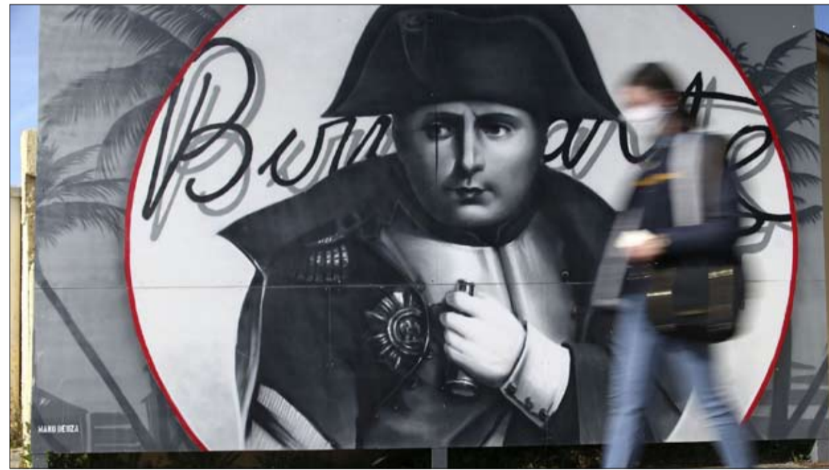
جص لنابليون بونابرت في آكاسيو

تشارلز هنري شوار: « لو عاجناه، لكانت أوروبا مختلفة بالتأكيد وربما لم تكن تعرف حربين عالميتين »