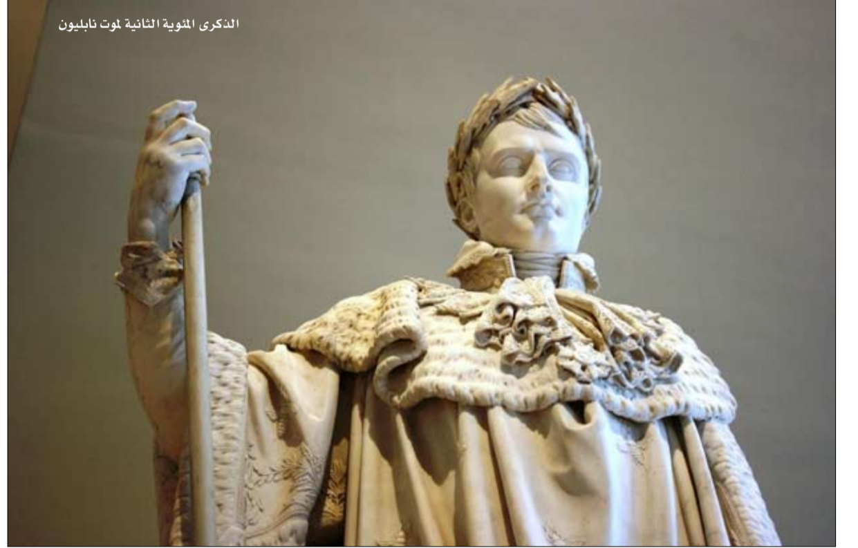
الذكرى المئوية الثانية لوت نابليون

الرجال الأقل طولاً أكثر عدوانية، ولكن فقط عندما لا يكون هناك تداعيات على الآخرين.. هل ان تكون قصير القامة ضرورياً لتصنع مسيرة ديكتاتورية؟ إنها ليست قاعدة (يبلغ قياس بول بوت 1.75 متراً، ماو 1.80 متراً)، ولكن في كثير من الأحيان، لم يكن الديكتاتورون طويلون جداً، يوضح أوليفيه غويز في مقدمة كتابه « قرن الدكتاتوريين ». وهكذا، كيم جونج ايل، لينين، ستالين، فرانكو، موسوليني لم يتجاوزوا 1.70 م.