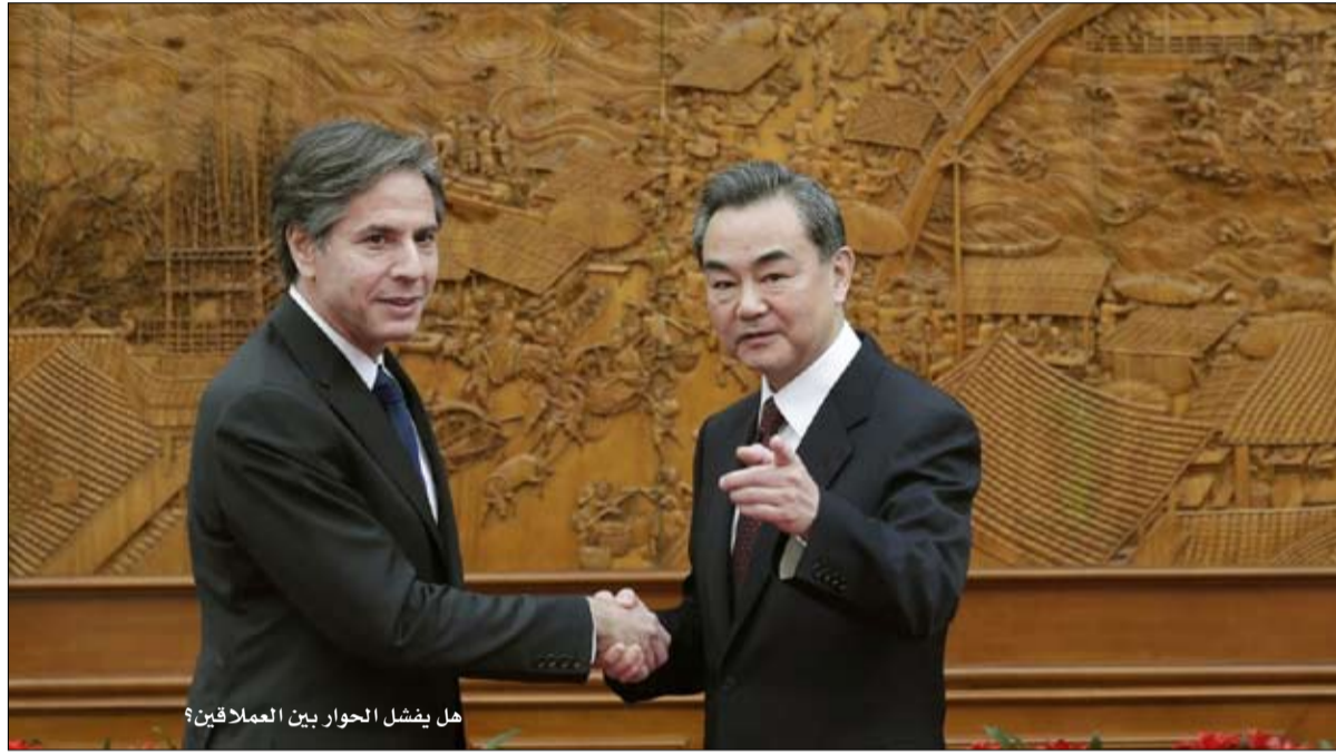
هل يفضل الحوار بين العملاقين؟

رأى الكاتب فليكس كاييزا أن الغوص في مستنقع قواعد الديمقراطية في تركيا يعكس تقريباً صورة "وطن التناقضات حيث لا تتسجم الحياة مع السياسات العلنية". وفي مقال بموقع "بوليتيكو"، استشهد بتعبير للرئيس رجب طيب أردوغان عن أن الديمقراطية هي "سيارة تترجل منها عندما تصل إلى وجهتك"، ليقول إن الديمقراطية، بالنسبة لأردوغان "ليست وجهة أو مكاناً محددًا أو ماديًا، إنه شيء يشبه الحياة السياسية الاختيارية والخيالية". بعدما أمّن حوالي 50% من الناخبين، شعر أردوغان أنه يستطيع "الترجل من السيارة لأنه وصل إلى وجهته". وبعد ذلك، حان الوقت كي يستقر "الإمبراطور" أردوغان ويحصد المكاسب دون المخاطرة بأن يتم حذفه من الخريطة العالمية للدول الديمقراطية. تعهد أردوغان وحزب "العدالة والتنمية" الذي يتزعمه، بالوفاء