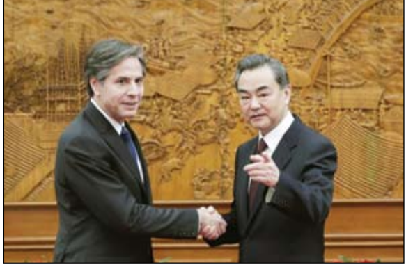
هل يفضل الحوار بين العملاقين؟

وقالت الخارجية الأميركية إن المبعوث الأميركي إلى اليمن، تيم ليندركينغ، والدبلوماسي الفرنسي، كريستوفر فارنو، أكدا أن استمرار الهجوم الحوثي على مأزب يهدد بتكلفة عالية.