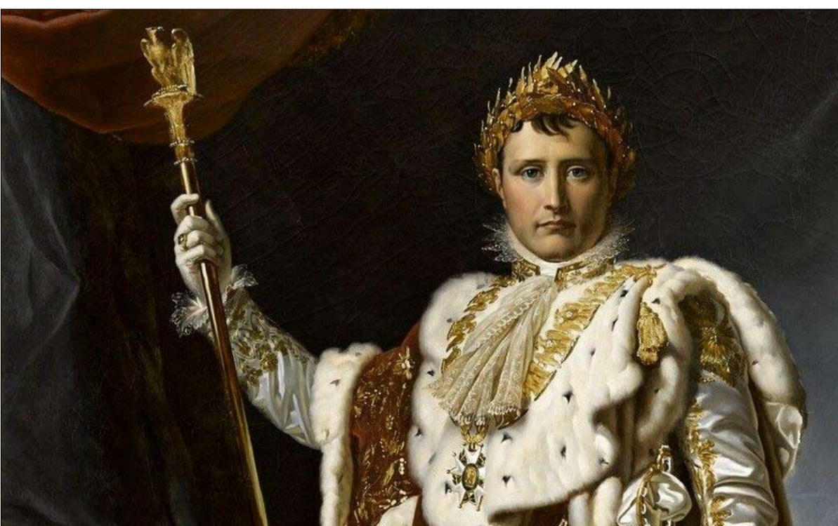
نابليون الأول في زي التتويج، 1805

صرع، ثنائي القطب، يعاني من توقف التنفس أثناء النوم ... صحة الإمبراطور موضع تكهنات كثيرة