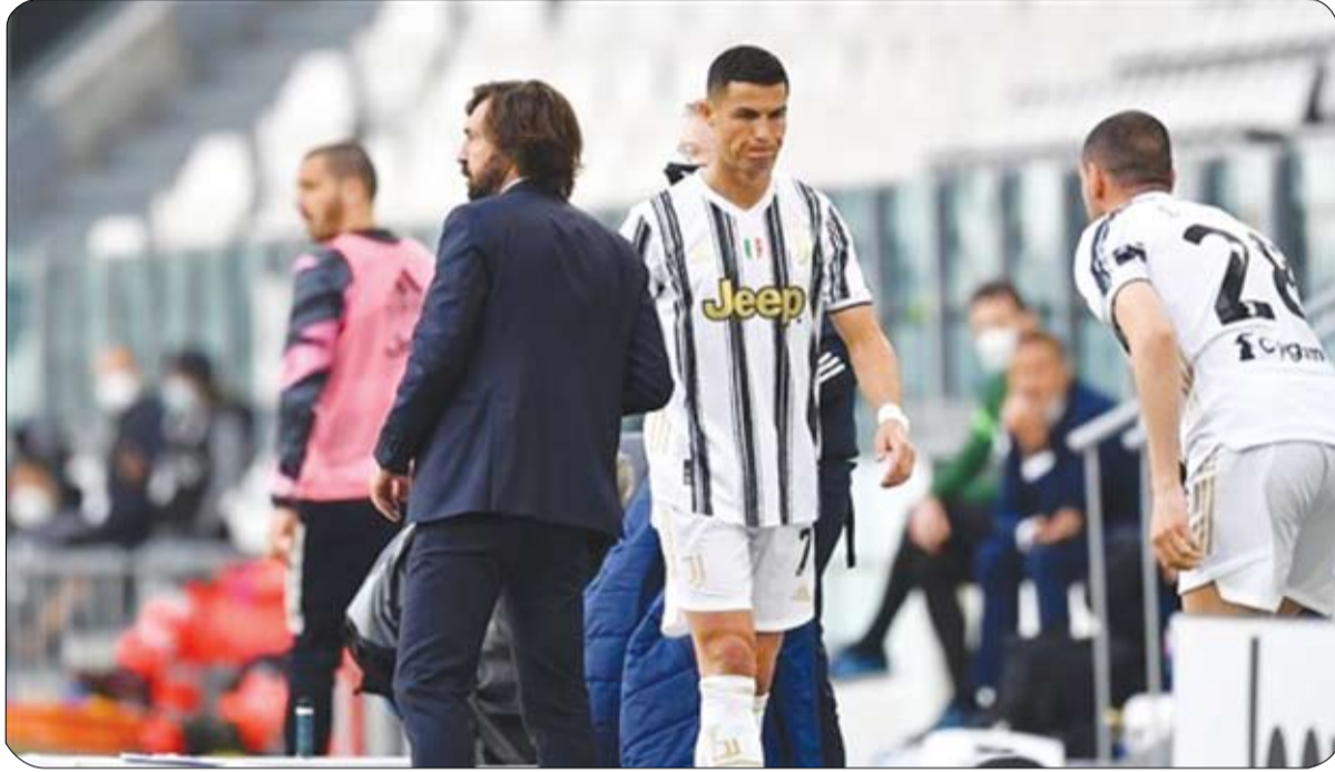
صراع على المركز الرابع إذا امتلكتنا المباريات الأخيرة. دائماً التصميم نفسه مثلما كان في وأضاف: "لكن عندما تلعب على

المركز الرابع في الجولة الأخيرة من الموسم فهذا يعني أن هناك شيئاً مفقوداً.. خسرتنا العديد من النقاط خاصة في مباريات كانت سهلة على الورق". ومنح كريستيانو رونالدو التقدم ليوفنتوس في الشوط الأول بعد متابعة لتسديدته من علامة الجزاء التي أنقذها حارس إنتر، لكنه استبدل في آخر 20 دقيقة. وعاد المهاجم البرتغالي إلى غرفة الملابس قبل نهاية المباراة، لكن بيرلو قال إنه لا يوجد أي مشكلة معه. وقال بيرلو: "ربما كانت هذه أول مرة يشعر فيها بالسعادة لاستبداله، لأنه كان سيماني في بقية المباريات بعد أن أصبحنا نلعب بعشرة لاعبين، كان سعيداً في غرفة الملابس".