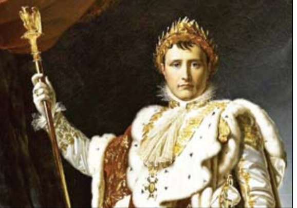
نابليون الأول في زي التتويج، ١٨٠٥

سيطر على نومه، مما ساهم في سمعته كرجل خارق للعادة، يمتلك على وجه الخصوص القدرة على تجاوز التعب بسرعة