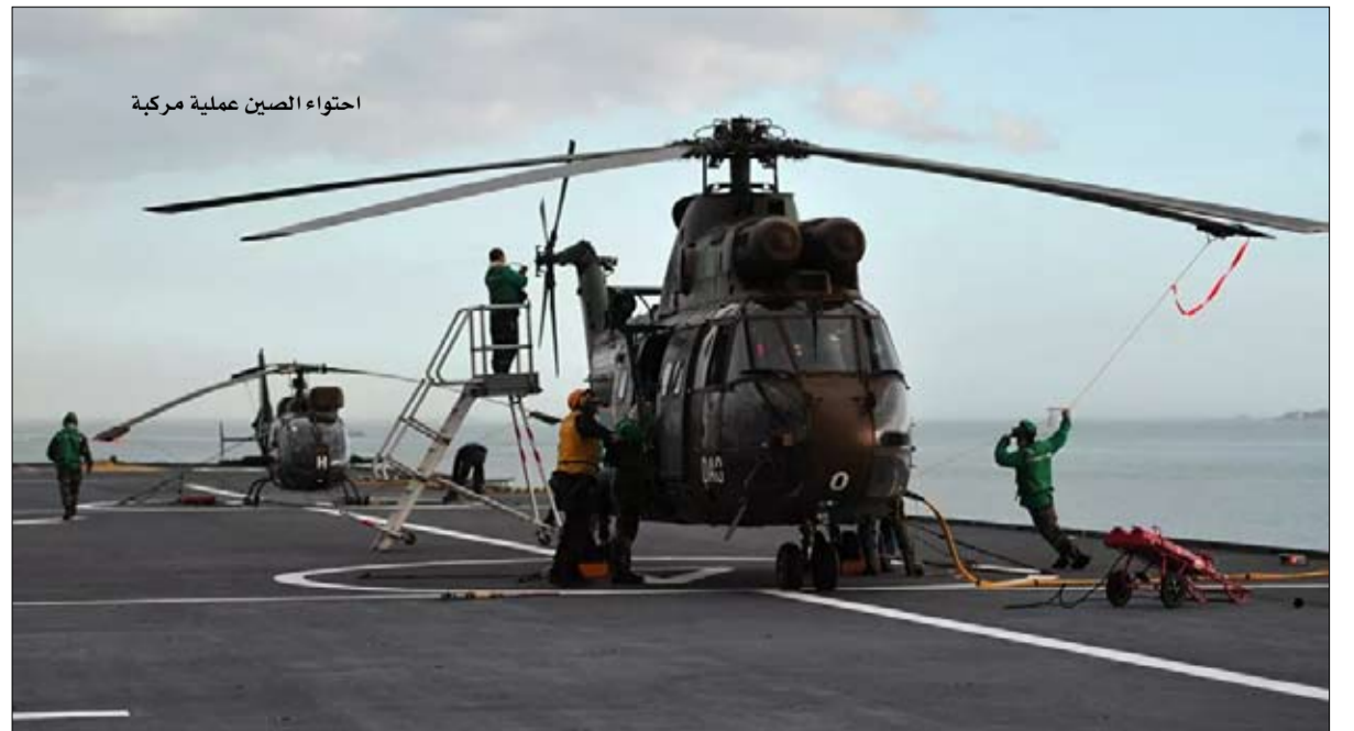
احتواء الصين عملية مركبة