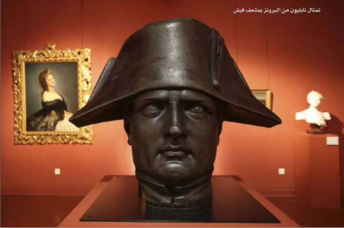
تمثال نابليون من البرونز بمتحف فيش