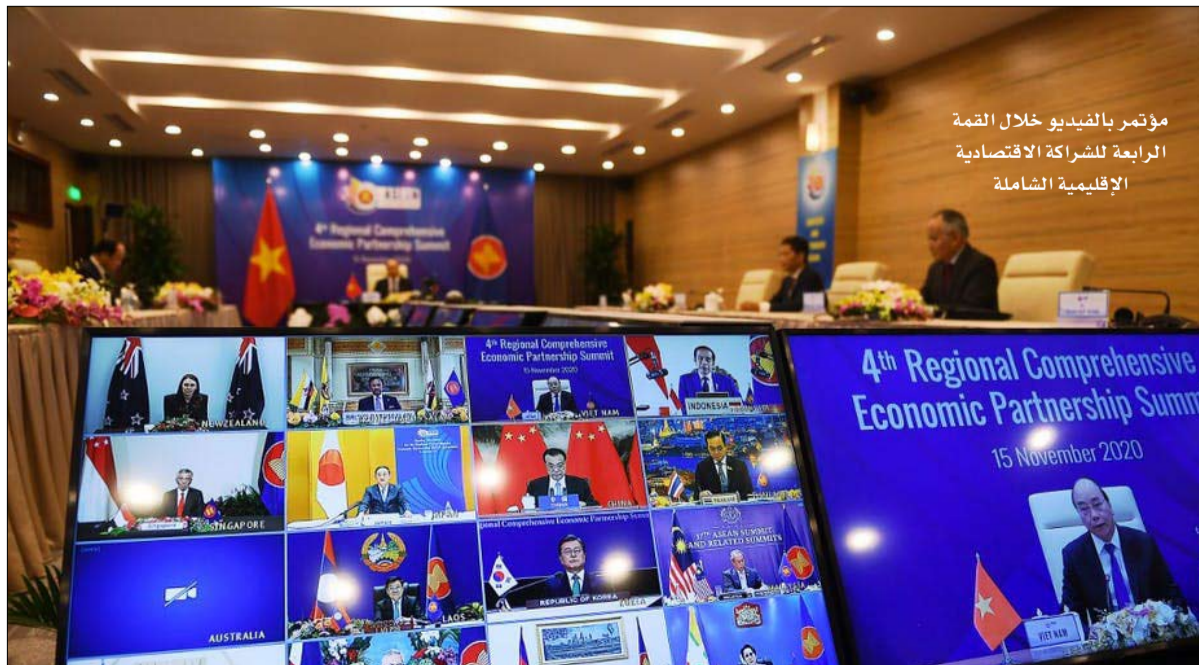
مؤتمر بالفيديو خلال القمة الرابعة للشراكة الاقتصادية الإقليمية الشاملة

الهادئ لا تستجيب كثيراً لمنطق القطبية الثنائية