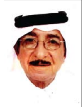
سعادة زكريا دولة

• أوصي الشباب بالجد والمثابرة وتحقيق المزيد من النجاحات