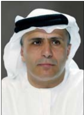
•• دبي-وأم: أكد