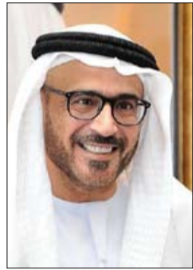
العمل البرلماني ودعم دور المجلس كؤسسة تشريعية وراقية. وأشار سعاده إلى أن الاحتفال باليوم

وختم سعاده تصريحه قائلا : انتهر هذه المناسبة لكي أتقدم بأسمى آيات التهاني والتبريكات إلى صاحب السمو الشيخ خليفة بن زايد آل نهيان رئيس الدولة “حفظه الله” وصاحب السمو الشيخ محمد بن راشد آل مكتوم نائب رئيس الدولة رئيس مجلس الوزراء حاكم دبي “رعاه الله”، و صاحب السمو الشيخ محمد بن زايد آل نهيان، ولي عهد أبوظبي نائب القائد الأعلى للقوات المسلحة، وإلى إخوانهم أصحاب السمو الشيوخ أعضاء المجلس الأعلى حكام الإمارات، ونوابهم وأولياء المهود كما أتقدم بالتهنئة إلى مواطني الدولة والمقيمين على أرضها بهذه المناسبة الغالية.