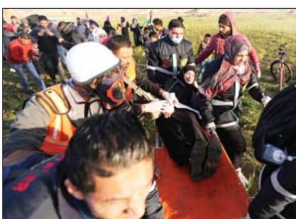
امرأة فلسطينية أصيبت خلال المواجهات شرق خان يونس

وأوضح مجلس قروي مادما جنوب نابلس، أن جيش الاحتلال أغلق الشارع أمام حركة سير الفلسطينيين من حاجز حوارة حتى زعترة، ومن مفرق جيت حتى دوار طولكرم، كلياً، ويحرم الاف الفلسطينيين من التنقل.