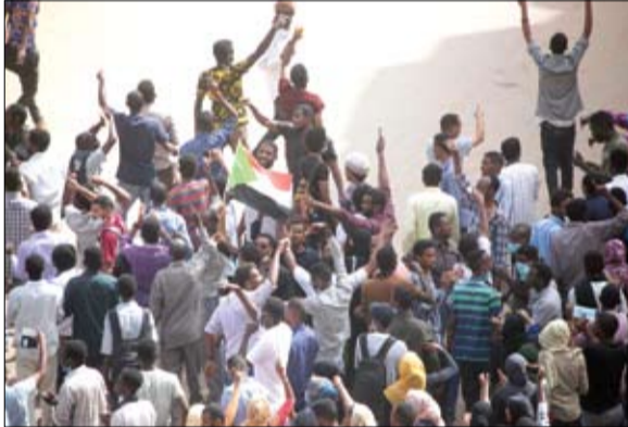
سودانيون يتظاهرون في العاصمة الخرطوم

اعتبر مندوب السودان الدائم لدى الأمم المتحدة في جنيف، مصطفى عثمان إسماعيل أن الاحتجاجات الجارية في السودان «مبررة»، محذراً في الوقت ذاته مما اعتبره خطراً حتمياً، قد يؤدي تجاوزه إلى تخریب البلاد. وقال إسماعيل في تصريحات لسكاي نيوز عربية إن «الاحتجاجات التي حدثت في السودان في الفترة الأخيرة مبررة لأنها ضد أوضاع اقتصادية سيئة». ولقد إلى وجود «ارتفاع الأسعار وغلاء فاحش وندرة في المواد الغذائية ويطالها وسط عدد كبير من الشباب، لذلك كان من الطبيعي أن يخرج الشباب ويعبروا عن رفضهم». لكن في الوقت ذاته، اعتبر إسماعيل أن تعامل الحكومة السودانية مع الاحتجاجات كان «جيداً»، قائلاً: «الجيد أن الحكومة اعترفت بذلك ولم تكابر على الاحتجاجات وأدرت أنه لا بد من معالجة أسبابها».