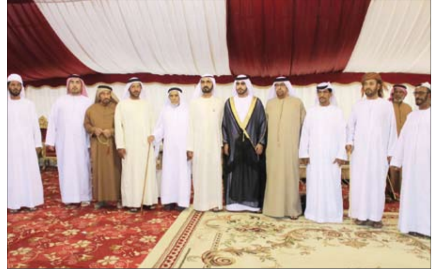
محمد بن راشد خلال حضوره أفراح المزروعى والمنصوري

زار صاحب السمو الشيخ محمد بن زايد آل نهيان ولي عهد أبوظبي نائب القائد الأعلى للقوات المسلحة امس... خميس راشد سبت الخيلي في منزله بمنطقة رماح في مدينة العين. ورحب الخيلي بزيارة صاحب السمو الشيخ محمد