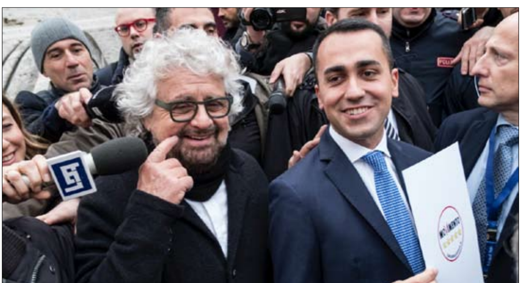
5 نجوم.. شكل هجين من الشعبوية

بالنسبة لغالبية هذه الأحزاب، الدولة المثالية لا تتدخل إلا قليلا في الاقتصاد، لكنها تعزز وظائفها السيادية