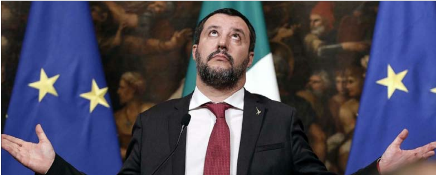
سالفيني.. الشعبوية في نسختها القومية