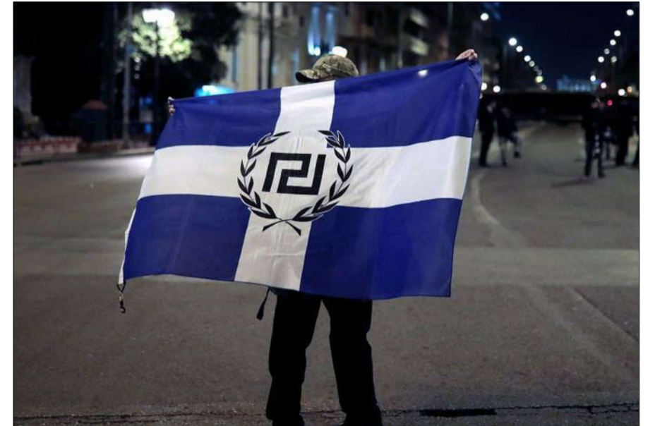
عودة النازية الجديدة

يسعى إلى استعادة عافيته في القارة العجوز: