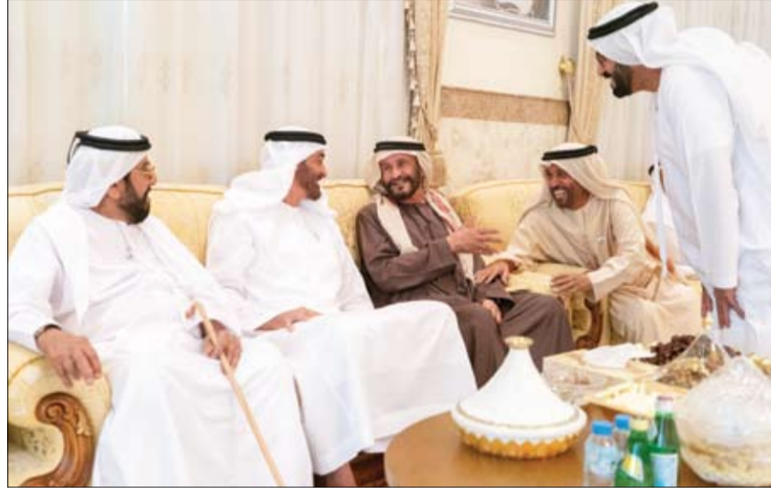
محمد بن زايد خلال زيارته خميس راشد سبت الخيلي في منزله بمنطقة رماح

استنكر مجلس النواب الليبي قرار المجلس الرئاسي الأخير بتعيين علي كنه أمراً لمنطقة سبها العسكرية، قائلاً إنه يحمل في طياته «بسات قطر»، بحكم علاقة الأخير بالسلطات القطرية، وزياراته المتعددة إلى الدوحة. وطالب البرلمان، في بيان أبناء الشعب الليبي بالوقوف خلف المؤسسة العسكرية لإفشال مشروع قطر في ليبيا. وأوضح بيان البرلمان أن «المجلس الرئاسي أصبح له هدف واحد اليوم وهو التحالف مع الإخوان والقاعدة، برعاية قطرية، من أجل البقاء في السلطة». وكان رئيس المجلس الرئاسي فايز السراج أصدر، الأربعاء، قرار يقضي بتعيين كنه قائداً عسكرياً لمنطقة سبها (جنوب غربي البلاد). وتأتي هذه التطورات بينما تمكن الجيش الوطني الليبي، بقيادة المشير خليفة حفتر، من السيطرة على مدينة سبها، وذلك في إطار عملية عسكرية تهدف لدمر «الجماعات الإرهابية والإجرامية والعصابات العابرة للحدود». والأسبوع الماضي، قال المتحدث باسم الجيش العميد أحمد المسماري، في مؤتمر صحفي عقده في مدينة بنغازي، إن الجيش يقاتل في الجنوب، لتنظيم الإخوان، عبر الإرهابي، علي الصلابي (المقيم في قطر)، الذي يشرف على ميليشيات الدروع وأنصار الشريعة». ويتحالف الصلابي مع إبراهيم الجضران، الذي مثل تنظيم القاعدة الإرهابي ومجموعات إرهابية أفريقية، مشيراً إلى أن الجضران وأتباعه هاجموا الهلال النفتي أكثر من مرة، وفق المسماري. وفي الحلف أيضاً، المعارض الشاذلي، تيماني أردبي، الموجود في قطر، الساعي إلى إظهار الحركة في الجنوب الليبي، كأنها بين السكان والجيش، والذي ادعى أن إحدى قواته تعرضت لغارة فرنسية مطلع هذا الأسبوع، إلى جانب الإرهابي أحمد الحساوي الذي بايع تنظيم داعش الإرهابي.