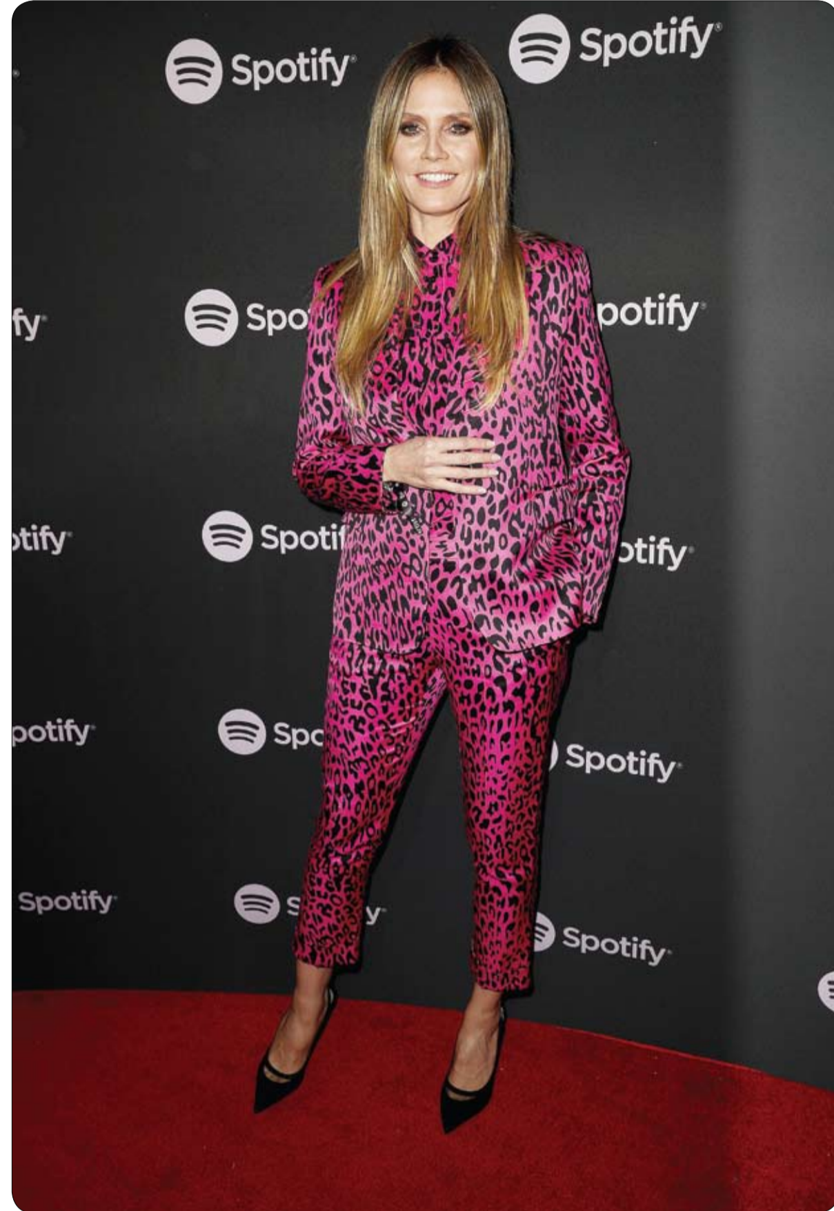
هايدي كلوم خلال حضورها حفل أفضل الفنانين الجدد في سبوتيفي في متحف هامر بلوس أنجلوس.

ويشمل جناح إسبانيا في المعرض 700 عنوان كتاب إضافة إلى تنظيم 40 نشاطا. ونقلت وكالة المغرب العربي للأنباء عن السفير الإسباني في المغرب ريكاردو ديز هوشلاينتر رودريجز قوله إن هذا المعرض يشكل مناسبة مواتية لتسهيل الضوء على العلاقات الخاصة التي تجمع البلدين، كما أنها دعوة للجمهور المغربي للانفتاح أكثر على اللغة الإسبانية. يشارك في أنشطة المعرض نحو 350 كاتباً وشاعراً ومرثجما من المغرب وخارجه، ومن بين هذه الأنشطة أمسية شعرية يحييها اللبثاني وديع سعادة الفائز بجائزة الأركانة العالمية للشعر وكذلك حفل تسليم جائزة ابن بطوطة لأدب الرحلة.