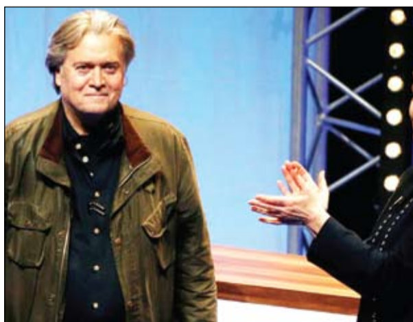
بانون غزوة أوروبا

مستشار سياسي مصاب إلى درجة ما بجنون العظمة، يلحم ستيف بانون بان يكون الدكتور سين للشعوبيين. إن الأهمية التي تنسب إليه في نجاح انتخاب دونالد ترامب إلى جانب حاسته السادسة وأبعيته تظل نسبية؛ عام 2017، طرد من البيت الأبيض، إذ قام برهان خاسر من خلال دعم، خلال الانتخابات التمهيدية للحزب الجمهوري في ألاباما، دعم السيناتور المتمرد، روي مور، في مواجهة مرشح رسمي للحزب. فاز مور في الانتخابات التمهيدية، لكنه خسر الانتخابات، وأهدى تلك الولاية للديمقراطيين. ومنذ الأشهر القليلة الماضية، يسعى بانون إلى استعادة عافيته ونقاء صورته في أوروبا، حيث النزعة الشعبوية في انتعاش وصعود.