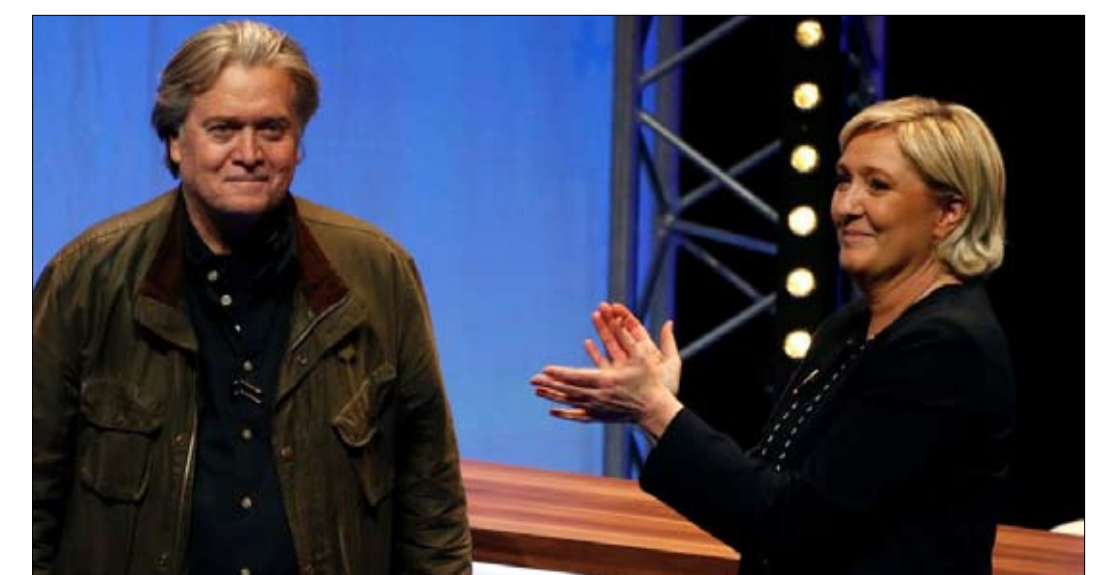
بانون.. غزوة أوروبا

المطلوب إعادة التفكير في هذا المصطلح لأنه يسيء تقدير قدرة اليمين الراديكالي على التكيف