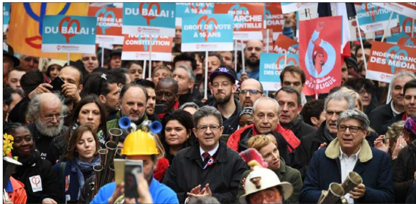
فرنسا المتردة.. الشعبوية يسارية أيضا

القومية هي سمة مشتركة بين جميع شعبي اليمين المتطرف