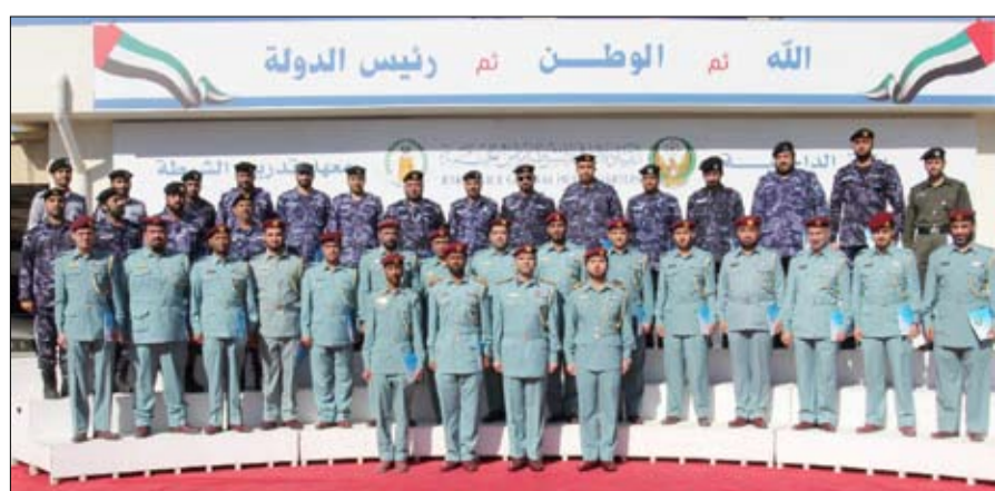
أهداف وزارة الداخلية الرامية إلى الارتقاء بالمستويين التدريبي والمهاري لموظفيها، كما تقدم راعي الحفل بالشكر للمحاضرين على جهودهم الحثيثة في مصلحة العمل وتطوير الذات، تجسداً

تفصيلاً لتوجهات صاحب السمو الشيخ خليفة بن زايد آل نهيان رئيس الدولة - حفظه الله - وأوامر صاحب السمو الشيخ محمد بن زايد آل نهيان ولي عهد أبوظبي نائب القائد الأعلى للقوات المسلحة رئيس المجلس التنفيذي، أطلقت دائرة تنمية المجتمع هيئة "معا" للمساهمات المجتمعية وتأتي هيئة "معا" للمساهمات المجتمعية ضمن محور تنمية المجتمع في برنامج أبوظبي للمسرعات التنموية "عدا 21" التي أعلن عنها صاحب السمو ولي عهد أبوظبي في يونيو الماضي.