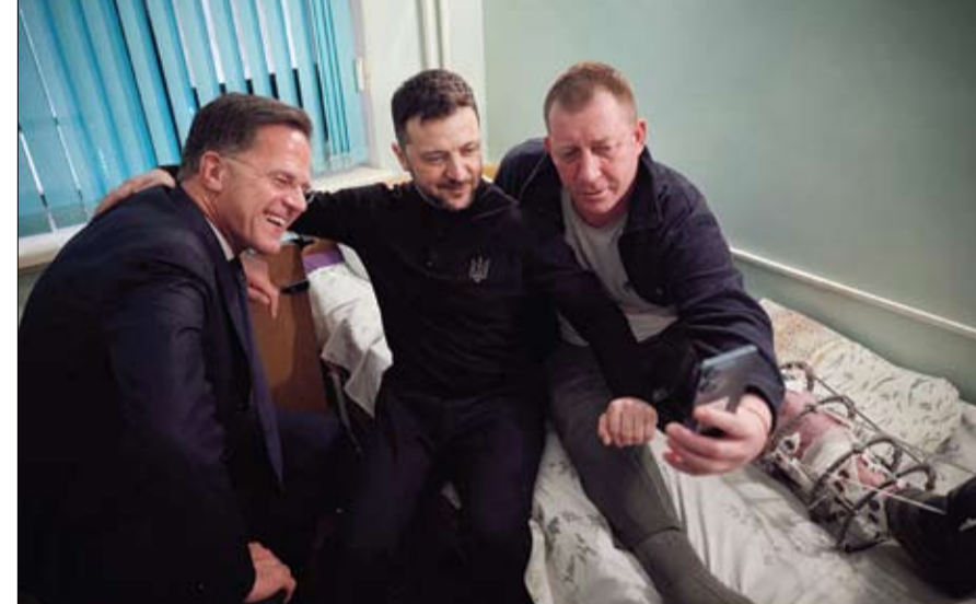
زيلينسكي وأمين عام الناتو يلتقطان صورة سيلفي مع جندي أوكراني مصاب في مستشفى بأوكرانيا.

وخيرسون) التي احتلتها روسيا سابقا. وأوضح أن القضية المركزية لحل النزاع تجسد في الأقاليم الخمسة (القرم ودونيتسك ولوغانسك ومقاطعتي زاباروجيه وخيرسون) التي احتلتها روسيا سابقا. وأوضح أن القضية المركزية لحل النزاع تجسد في الأقاليم الخمسة (القرم ودونيتسك ولوغانسك ومقاطعتي زاباروجيه وخيرسون) التي احتلتها روسيا سابقا.