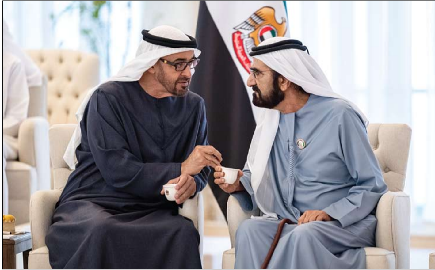
رئيس الدولة ومحمد بن راشد في حديث أخوي حول الموضوعات والقضايا المتعلقة بشؤون الوطن والمواطن (وام)

استقبل صاحب السمو الشيخ محمد بن زايد آل نهيان رئيس الدولة «حفظه الله» أمس أخاه صاحب السمو الشيخ محمد بن راشد آل مكتوم نائب رئيس الدولة رئيس مجلس الوزراء حاكم دبي (رعاه الله).. بحضور سمو الشيخ منصور بن زايد آل نهيان نائب رئيس الدولة نائب رئيس مجلس الوزراء رئيس ديوان الرئاسة، وتبادل سموهما - خلال اللقاء الذي جرى في قصر البحر في أبو ظبي - التحية مع الحضور والأحاديث الأخوية الودية. كما بحث سموهما عددا من الموضوعات والقضايا المتعلقة بشؤون الوطن والمواطن والذي يأتي على قمة أولويات الدولة وفي جوهر خططها وأهدافها التنموية خلال المرحلتين الحالية والمستقبلية بجانب السبل الكفيلة بمواصلة تعزيز مسيرة الدولة وتحقيق مستهدفاتها الوطنية الطموحة على جميع المستويات محليا وعالميا.. سائلين المولى عز وجل أن ينعم على دولة الإمارات وشعبها بدوام الازدهار والتقدم على جميع المستويات. (التفاصيل ص2)