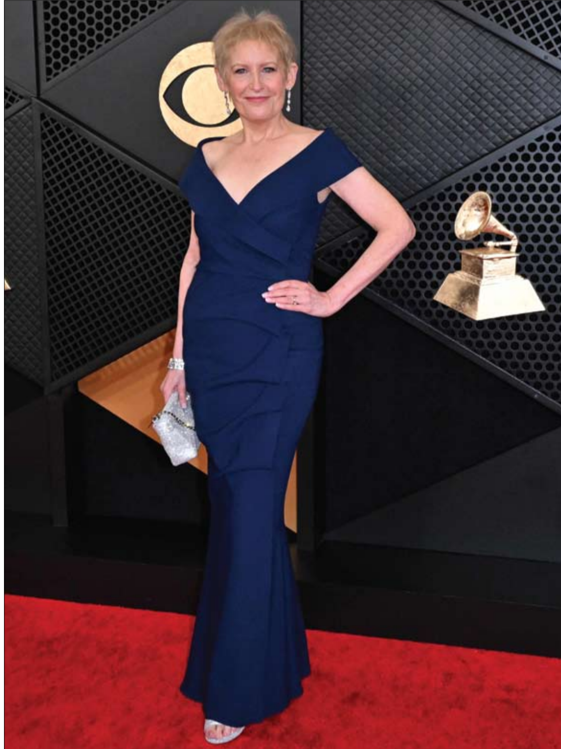
الممثلة والمغنية الأمريكية ليز كالاواي لدى وصولها لحضور حفل توزيع جوائز جرامي السنوي في لوس أنجلوس.

يمكن أن يؤدي الاستخدام طويل الأمد إلى مخاطر مشاكل الذاكرة والإمساك، وكلها قد تكون أكثر وضوحاً عند كبار السن. كما لا ينبغي خلطها مع بعض الأدوية والمواد، بما في ذلك الكحول والمواد الأفيونية ومضادات الاكتئاب، حيث قد يؤدي ذلك إلى مزيد من الضغط على الجهاز العصبي المركزي وتباطؤ التنفس، وهو ما قد يكون خطيراً. وقال الدكتور روبريغز إن الجسم يمكن أن يعتاد على الأقرص المنومة مع مرور الوقت، لذلك غالباً ما ينتهي الأمر بالناس إلى جرعات أعلى للحصول على التأثير نفسه. ويمكن للعلاج السلوكي المعرفي للأرق معالجة أسبابه، مع التركيز على تعديل السلوكيات وأنماط التفكير التي تساهم في مشاكل النوم. ومن الضروري أيضاً اتباع عادات جيدة قبل النوم، مثل النوم في غرفة مظلمة وتجنب الشاشات.