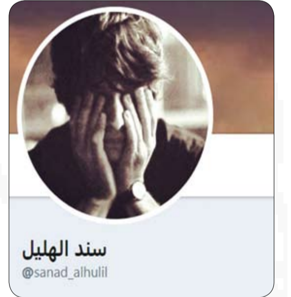
سند الهليل @sanad_alhulil

العز؟ ماله بديل والخوف لاهل الترف أجبرت تحيا ذليل؟ أخترتموت بدشرف! *****