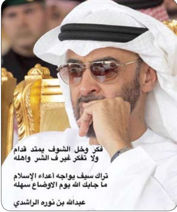
فكر واخل الشوف يمتد قدام ولا تفكر غير الشر واهله تراك سيف يواجه اعداء الإسلام ما جابك الله يوم الاوضاع سهله عبدالله بن نوره الراشدي

الشيخ زايد بن سلطان آل نهيان (طيب الله ثراه)