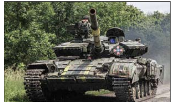
دبابة أوكرانية تتحرك في منطقة خاركيف

في الأيام الأخيرة، أصبح المشهد شبه عادي: وسط تصاعد سحابية من الدخان، تم تدمير مستودع ذخيرة روسي جديد في 18 يوليو في نوفا كاخوفكا، في منطقة خيرسون، جنوب أوكرانيا. ومنذ عدة أسابيع، تكثفت القوات الأوكرانية هجماتها لاستعادة هذه المنطقة التي وقعت في أيدي موسكو في بداية الغزو... لكن هل يمكنها التوسع؟ (تفاصيل ص 8)