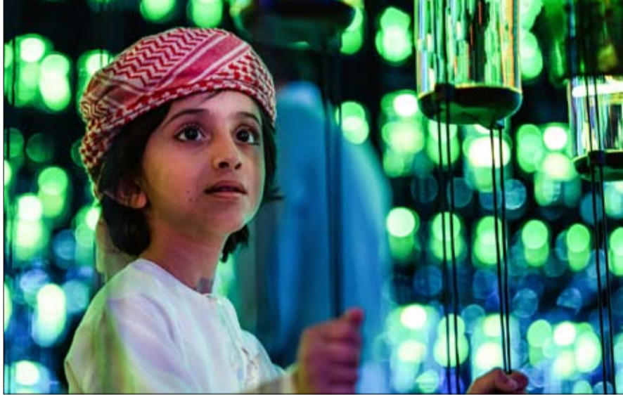
نوعية لتجارب تفاعلية غامرة في "متحف المستقبل". وينال الرواد للجميع ما يتطلعون إليه، ليكون المخيم الصيفي إضافة

والأنشطة الشيقية التي تغذي فضول الأطفال في تخصصات العلوم، والتكنولوجيا، والهندسة، والرياضيات وتشمل موضوعات ملهمة، مثل استكشاف الفضاء، والبيئة، والسعادة، والرفاهية. وسيكون لدى الأطفال فرصة التعمق في موضوعات فريدة ودخول عالم الروبوتات والذكاء الاصطناعي، بما يحاكي اهتمامات وقدرات كل منهم، كما في تخصصات البرمجة، والفن. وتتناسب الموضوعات الطروحة مع الفئات العمرية المستهدفة من الأطفال، بالإضافة إلى محتوى جاذب وممتع وعصري، بما في ذلك تطبيقات الذكاء الاصطناعي في حياتنا، وأشكال الفنون المختلفة، والتعليم بالبناء