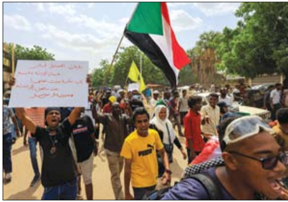
مظاهرون خلال مسيرة تطالب بالحكم المدني في الخرطوم، رويترز.

وكشيرا ما تهاجم الجماعة الإرهابية، التي تسيطر على مساحات شاسعة من الأراضي في المناطق الجنوبية والوسطى، قوات الأمن والمدنيين.