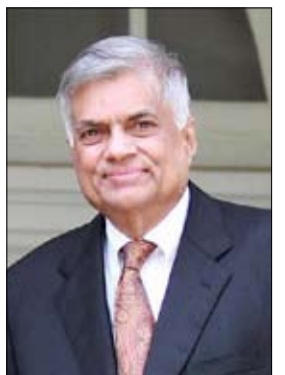
•• كولومبو-أ ف ب

دعا الرئيس السريلانكي الجديد رانيل ويكريميسينغه أعضاء البرلمان رسمياً للانضمام إلى الانضمام إلى حكومة وحدة تشارك فيها جميع الأحزاب لإنعاش الاقتصاد الفلوس عبر إجراء إصلاحات مؤلمة، حسبما أعلن مكتبه الأحد. وكان ويكريميسينغه قد تولى منصبه في وقت سابق من هذا الشهر، بعدما أجبر الغضب الشعبي من أسوأ أزمة اقتصادية في الجزيرة