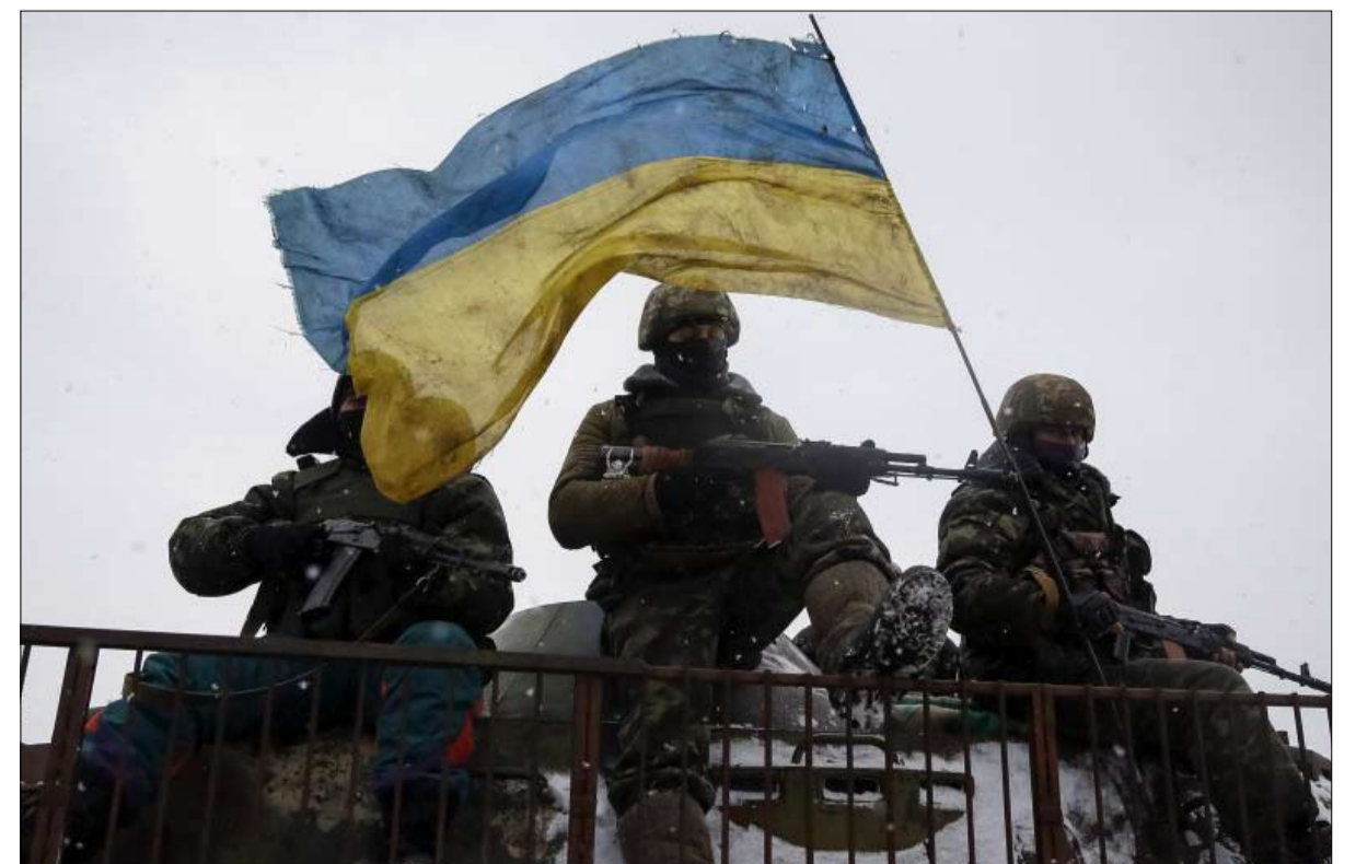
القوات الأوكرانية تستعد لهجوم مضاد