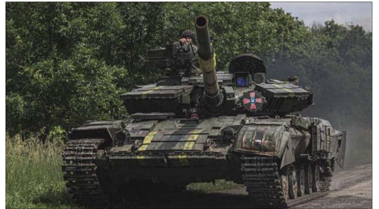
دبابة أوكرانية تتحرك في منطقة خاركيف