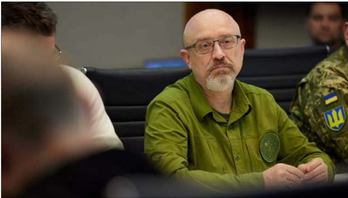
وزير الدفاع الأوكراني يعلن عن اعداد جيش بمليون رجل

•• الفجر - بول فيرونك - ترجمة خيرة الشيباني