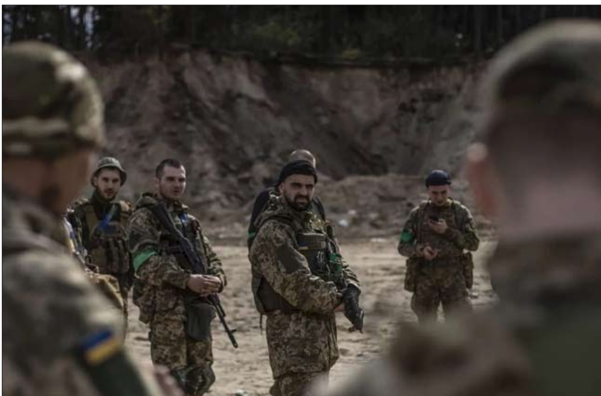
عناصر من أجهزة الأمن الأوكرانية تتدرب على إطلاق النار

«صد الروس على نهر الدنيبر» في الوقت الحالي، تمكّن الجيش الأوكراني من الاقتراب من خيرسون - وهي مدينة يبلغ عدد سكانها 280 ألف نسمة في جنوب أوكرانيا - لا تزال تحت السيطرة الروسية. ويقول الجنرال دومينيك ترينكواند، الخبير العسكري والرئيس السابق للبعثة الفرنسية لدى الأمم المتحدة: "إذا