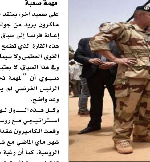
مهمة صعبة على سعيد آخر، يعتقد محللون أن ماكرون يريد من جولته النفوذ في إعادة فرنسا إلى سباق النفوذ في هذه القارة الذي تطمح إليه جميع القوى العظمى ولا سيما روسيا.

إلى تدمير بنى تحتية. من المستحيل شن حرب بأي طريقة أخرى..