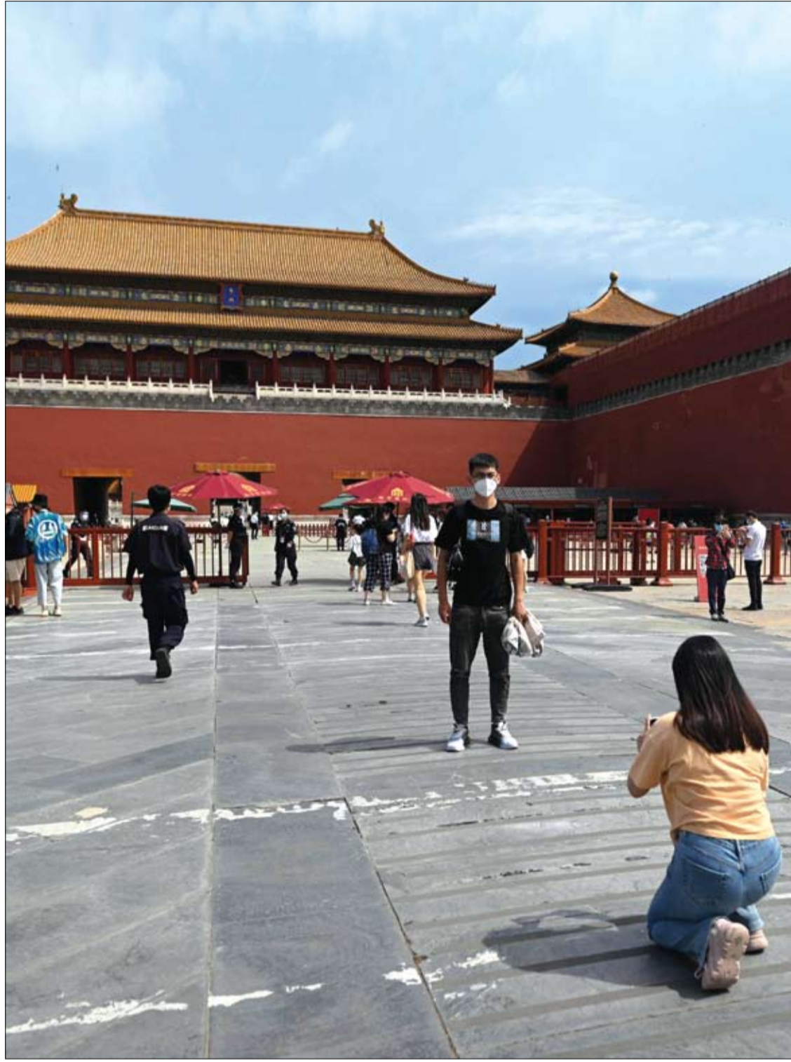
شاب يقف للالتقاط صورة عند مدخل مدينة في بكين، بعد أن خففت الحكومة بعض قيود كورونا مع استئناف عمل معظم المتاحف.

كشفت دراسة حديثة عن عنصر غذائي يلعب دورا مهما في الإصابة بسرطان الدم في مرحلة الطفولة، أشارت إلى أن حظره يمكن أن يقلل من المخاطر. وتوصل الباحثون إلى أن الحمض الأميني "فالين" له دور كبير في الخلايا المناعية السرطانية. وواحدة من أكثر الطفرات شيوعا في سرطان الدم تزيد من مستويات هذا الحمض الأميني لتعزيز نمو السرطان. وأدت تجربة منعت الجينات المرتبطة بها إلى قتل 98% من الخلايا السرطانية في بيئة معملية. ووفقا للورقة البحثية التي نُشرت في مجلة Nature، فإنه بينما تظهر تجربة طبق بترتي نتائج واعدة، ستكون هناك حاجة إلى مزيد من البحث لإيجاد طريقة مفيدة لتطبيقها على البشر. ووجدت دراسة أجريت على الفئران أن اتباع نظام غذائي منخفض في حمض الفالين أوقف تطور السرطان وعكسه في بعض الحالات. وتقلصت خلايا سرطان الدم المنتشرة في الدم بمقدار النصف على الأقل خلال ثلاثة أسابيع، وفي بعض الحالات تنخفض إلى مستويات لا يمكن اكتشافها. وتسبب استئناف نظام غذائي طبيعي في عودة السرطان إلى النمو بشكل طبيعي.