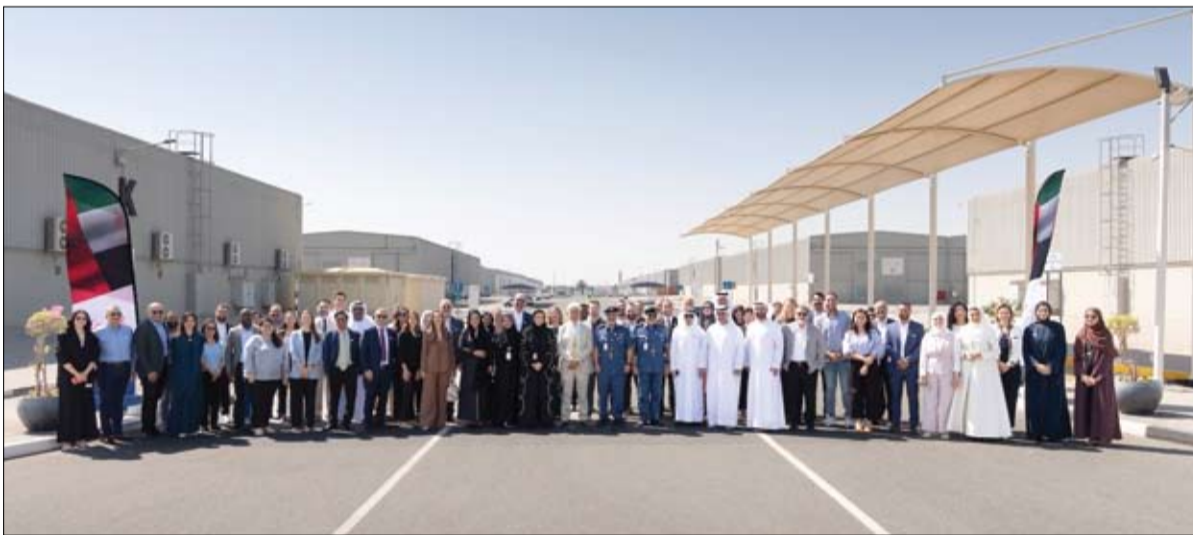
بمشاركة شبكتها العالمية من الشركاء والأعضاء