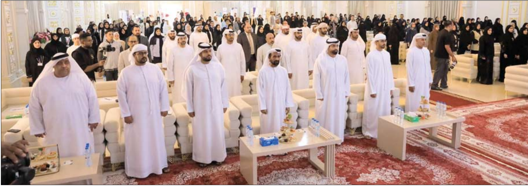
بمشاركة 89 مدرسة على مستوى الدولة