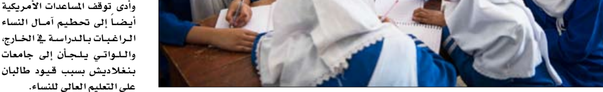
على التعليم العالمي للنساء

•• واشنطن-أ ف ب: ترأس الرئيس الأميركي دونالد ترامب إلى جانب بطل الغولف تايفر وودز احتفالاً بمناسبة شهر تاريخ السود الذي يحتفي بتاريخ الأميركيين السود، في وقت تعمل إدارته على تغيير السياسات المتعلقة بالتنوع. وخلال هذا التقليد السنوي الذي يشهده شهر شباط-فبراير، أطلق الرئيس الأميركي أمام حشد متحمس معظمه من الضيوف السود، عبارة «مرحباً بكم في البيت الأبيض». نحن نحفل بسخر بشهر تاريخ السود، وشكر الملياردير الجمهوري للناخبين السود دعمهم له في الانتخابات الرئاسية، قائلاً إنه فاز بأصوات أميركيين سود أكثر من أي رئيس جمهوري.