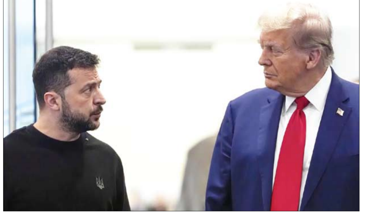
ترامب وزيلينسكي.. وصفتة الابتزاز

بموجب عقد أولي يشبه ما يطلبه المنتصر من عدوه المهزوم :