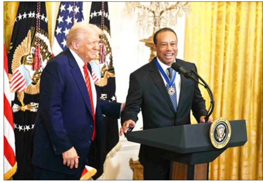
ترامب مع مسؤول أمريكي