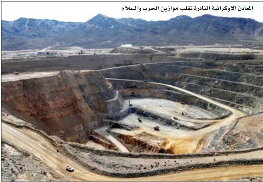
المعادن الأوكرانية النادرة تقلب موازين الحرب والسلام

نهج الرئيس الأميركي ردود فعل قوية في أوروبا. وفي مؤتمر ميونيخ للأمن، الذي عقد في الفترة من 14 إلى 16 فبراير- شباط، قارن المسؤولون الأمر بـ«تكتيكات الابتزاز الماهاوية»، والبرياء، والاستعمار. ورأى النائب الألماني في البرلمان الأوروبي سيرجي لاجودينسكي أيضاً أن القرار يمثل «تحقيقاً كاملاً لرغبات بوتين».