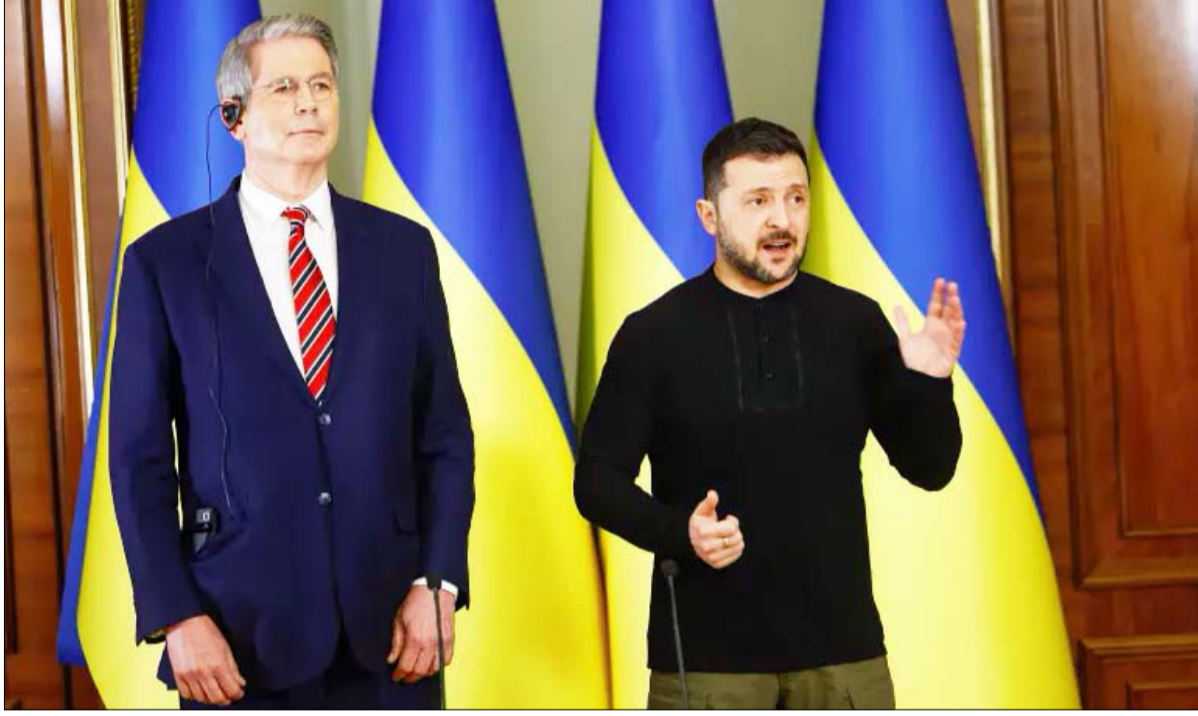
زيلينسكي خلال مؤتمر صحفي مع بيستت في كييف

•• واشنطن-وكالات: ذكرت صحيفة «فاينانشال تايمز» Financial Times البريطانية، نقلاً عن خمسة مسؤولين أوروبيين أن الولايات المتحدة تُعارض استخدام عبارة «العدوان الروسي» في بيان لمجموعة السبع، في الذكرى الثالثة لاندلاع الحرب الروسية الأوكرانية، مما يهدد بعرقلة ما كان يفترض أن يكون استعراضاً تقليدياً للوحدة داخل المجموعة. وقال المسؤولون الغربيون إن المبعوثين الأميركيين اعترضوا على عبارة «العدوان الروسي» والأوصاف المماثلة التي استخدمها زعماء مجموعة السبع لوصف الصراع منذ