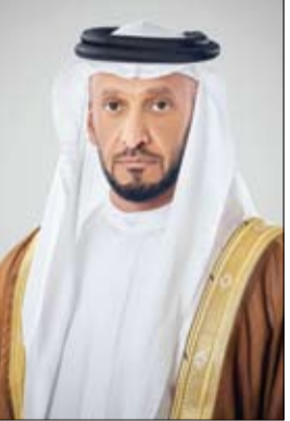
الرائدة، بما يساهم في ترسيخ مكانة الدولة وجهة إعلامية عالمية قادرة على التأثير والإلهام.

أبو ظبي-وام: أكد معالي عبد الله بن محمد بن بطي آل حامد، رئيس المكتب الوطني للإعلام، رئيس مجلس إدارة مجلس الإمارات للإعلام، أن تقدم دولة الإمارات في مؤشرات الهوية الإعلامية الوطنية، وفق تقرير "براند فاينانس" الصادر عن مؤتمر القوة الناعمة السنوي في لندن، يعكس المكانة العالمية الراسخة التي حققتها الدولة بفضل رؤيتها الاستراتيجية وريادتها في مختلف المجالات. وقال معاليه، في تصريح له أمس، إن هذا الإنجاز هو ثمرة دعم وتوجيهات القيادة الرشيدة، التي وضعت الإعلام على صدارة أولوياتها، ووفرت له البيئة المحفزة للنمو والتطور، ما عزز دوره في نقل صورة الإمارات المشرفة ورسخ تواصلها الفاعل مع العالم. وأشار إلى أن ارتفاع قيمة الهوية الإعلامية الوطنية لدولة الإمارات، إلى أكثر من تريليون ومئتي وثلاثة وعشرين مليار دولار أمريكي للعام 2025، وتصدر دولة الإمارات المركز الأول عالمياً في مؤشر أداء الهوية الإعلامية الوطنية، والسابع عالمياً في قوة الهوية الإعلامية، يعكس نجاح السياسات الوطنية في تعزيز الصورة الإيجابية للدولة وإعلاميين وصناع محتوى، الذين أسهموا بجهودهم المتميزة في تحقيق هذا الإنجاز، مؤكداً تفانيهم في تقديم محتوى هادف واحترافي يعكس تطورات الإمارات وقيمتها، ويساهم في تعزيز حضورها العالمي. كما أشاد بالدور الذي تقوم به المؤسسات الإعلامية الوطنية في نقل قصة نجاح الدولة إلى العالم، وتعزيز التواصل الفعال مع مختلف الثقافات والشعوب، مثنياً