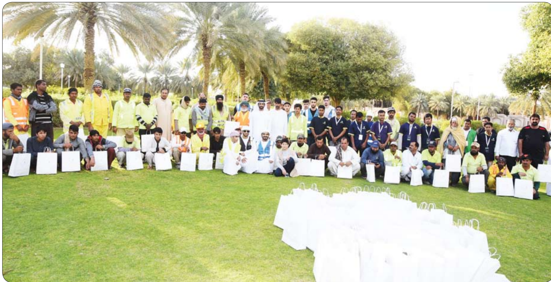
في عام التسامح برعاية محمد بن حم