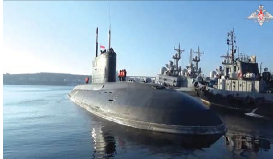
بحارة روس يصطفون على متن غواصة تشارك في مناورات في مياه المحيط الهادئ.

•• عواصم-أ ف ب: بدأت روسيا مناورات بحرية في المحيط الهادئ أمس الثلاثاء تشمل تدريبات على عمليات مضادة للغواصات والضربات الجوية، وفق ما أعلنت وزارة الدفاع الروسية في بيان. ويأتي هذا الإعلان قبيل زيارة يقوم بها الرئيس الروسي فلاديمير بوتين لكوريا الشمالية الثلاثاء بهدف إقامة شراكة استراتيجية بين موسكو وبيونغ يانغ اللتين تجمعهما روابط الأخوة الراسخة لرفاق السلاح بحسب ما قال الزعيم الكوري الشمالي كيم جونغ أون. وتستمر هذه المناورات التي يشارك فيها حوالي 40 زورقا وقاربا وسفينة بالإضافة إلى نحو 20 طائرة ومرورية من 18 إلى 28 حزيران يونيو في مياه المحيط الهادئ وبحر اليابان وأوكوتسك في أقصى الشرق الروسي، وفق ما أوضحت وزارة الدفاع الروسية. ويظهر مقطع فيديو نشرته السوارة الكثير من السفن والغواصات تبحر قبالة بحر اليابان في فلاديفوستوك، الميناء الرئيسي للأسطول الروسي في المحيط الهادئ. وأشارت الوزارة إلى أنه في مراحل مختلفة، سيقوم البحارة بتدريبات على عمليات مضادة للغواصات وعلى الضربات الصاروخية ضد مجموعات من سفن عدو تقليدي وبحرية. إلى ذلك، اندلع حريق في مصفاة للنفط بعد هجوم ليلي شن بواسطة مسيرات في أروف في منطقة روستوف التي تضم المقر العام العسكري للهجوم الروسي في أوكرانيا، على ما أفادت السلطات الروسية المحلية الثلاثاء. وكتب فاسيلي غولوبوف حاكم منطقة روستوف في جنوب روسيا عبر تلغرام، «اندلعت النيران في خزانات نفط في أروف إثر هجوم بواسطة مسيرات». والمسيرة العسكرية الروسية ضد أوكرانيا، على ما أفادت السلطات الروسية المحلية الثلاثاء. وكتب فاسيلي غولوبوف حاكم منطقة روستوف في جنوب روسيا عبر تلغرام، «اندلعت النيران في خزانات نفط في أروف إثر هجوم بواسطة مسيرات».