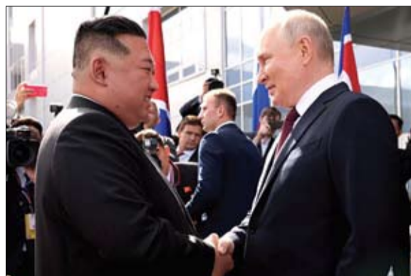
بوتين وكيم... علاقات متنامية (أرشيفية)

•• عواصم-وكالات: بينما يشعر الأميركيون والأوروبيون منذ أشهر بقلق من التقارب المتسارع بين موسكو وبيونغ يانغ، يتوجه الرئيس الروسي فلاديمير بوتين إلى كوريا الشمالية الثلاثاء واليوم يتم في ختامها توقيع اتفاق شراكة استراتيجية بين البلدين. فقد وصف المستشار الدبلوماسي لبوتين يوري أوشاكوف، زيارة الرئيس بأنها لحظة مهمة للبلدين الخاضعين لعقوبات غربية، معرباً عن أمله في توقيع اتفاقية شراكة استراتيجية، وفقاً لوسائل إعلام روسية. وأفاد بأنه سيتم توقيع وثائق مهمة للغاية، مشيراً إلى احتمال إبرام اتفاق شراكة استراتيجية شاملة. كما لفت إلى أن هذه المعاهدة في حال التوقيع عليها ستكون بالطبع مشروطة بالتطور وتبين وكيم... علاقات متنامية (أرشيفية) والمتحدث باسم مجلس الأمن القومي الأميركي جون كيربي للصحافيين الاثنين لسناء فلتين بشأن زيارة بوتين، مضيفاً ما يقلقنا هو تعمق العلاقات بين هذين البلدين. كما سيحضر الرئيس الروسي حفلاً موسيقياً يقام على شرفه. ويرافق بوتين وزيراً الخارجية سيرغي لافروف والدفاع أندريه بيلوسو. العميق للوضع الجيوسياسي في العالم وفي المنطقة وبالتغيرات النوعية التي حدثت مؤخراً في علاقاتنا الثنائية. وتوقع أن يتم اتخاذ القرار النهائي بشأن توقيعها خلال الساعات المقبلة. بالمقابل، أعرب البيت الأبيض عن قلق الولايات المتحدة والغرب إزاء العلاقات التي تزداد توثقاً بين روسيا وكوريا الشمالية.