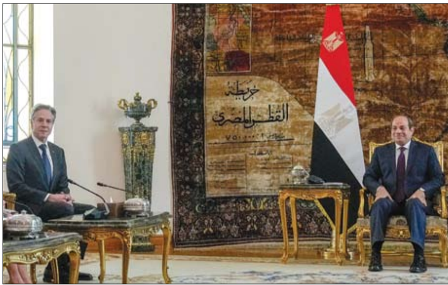
الرئيس المصري خلال استقباله وزير الخارجية الأمريكي

بعد الأخبار التي انتشرت عن محاولة انقلاب في مدينة أم درمان بالسودان، واعتقال عشرات الضباط من الجيش، نفت مصادر عسكرية سودانية الأمر جملة وتفصيلاً. وأكدت المصادر للعربية - الحدث، الثلاثاء، أن ما تناقلته بعض وسائل الإعلام حول وجود ترتيب لحالة انقلابية في البلاد انطلاقاً من أمر درمان لا أساس له من الصحة. كما نفت أن يكون قد تم اعتقال أي ضباط مؤخراً، في ضوء الترتيب لانقلاب أو حتى مخالفة تعليمات عسكرية. إلى ذلك، اعتبرت أن الهدف من تلك الشائعات خلق الإحباط والتشويش على عمليات التقدم والانفتاح التي تمت في مدينة أم درمان، مؤخراً من جانب القوات المسلحة. وكانت مصادر أخرى أفادت بوقت سابق أن الاعتقالات تتعلق بمخالفة بعض التعليمات العسكرية، نافية أن يكون لها أي علاقة بما أشيع في صحيفة السوداني عن محاولة انقلاب. كما أوضحت أن عدداً من الضباط اعتقل لقيامهم بحملة عسكرية ضد قوات الدعم في أم درمان دون التنسيق مع القيادة العسكرية.