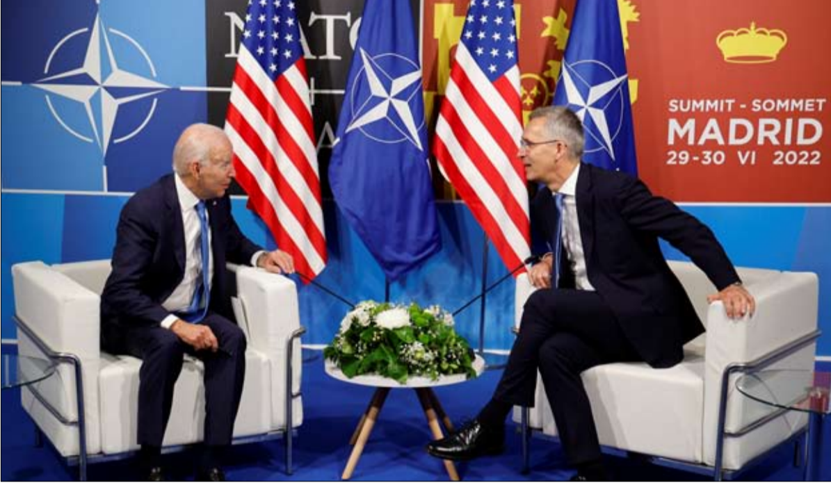
بايدن يعلن تعزيز الوجود العسكري الأمريكي في أوروبا

إستونيا. إن الدول الواقعة على الجانب الشمالي الشرقي للحلف الأطلسي، دول البلطيق وبولندا وفنلندا والسويد، وهي الأكثر عرضة لهجوم روسي محتمل، لديها أصول عسكرية كبيرة. لدى فنلندا وإستونيا الكثير من جنود الاحتياط المدربين تدريباً جيداً.