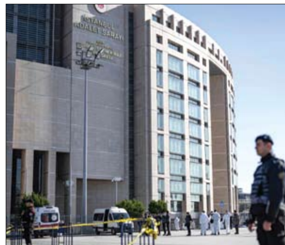
خبراء الطب الشرعي يفحصون موقع إطلاق النار خارج محكمة تشاغليان. (أ ب) و في هذه الأثناء، مُنع الدخول والخروج من محكمة تشاغليان على الهجوم الغادر بالتدخل في الوقت المناسب. وأعلن الرئيس رجب طيب

وأضاف تم تحييد إرهابيين اثنين أحدهما امرأة والآخر رجل" موضحاً أن الهجوم أدى إلى إصابة ثلاثة من رجال الشرطة وثلاثة مدنيين، تويجاً أحدهم في وقت لاحق. وتعمد أردوغانان بان تركيا ستواصل القتال بكل تصميم ضد جميع المنظمات الإرهابية وداعميها، دون أي تمييز. وروى شاهد عيان لفرانس برس أن المهاجمين فتحوا النار على الشرطة بعد مشادة قصيرة عند نقطة تفتيش تؤدي إلى المدخل الرئيسي للمبنى القترامي الأطراف، والذي تم استخدامه لبعض من أكبر المحاكمات في تركيا.