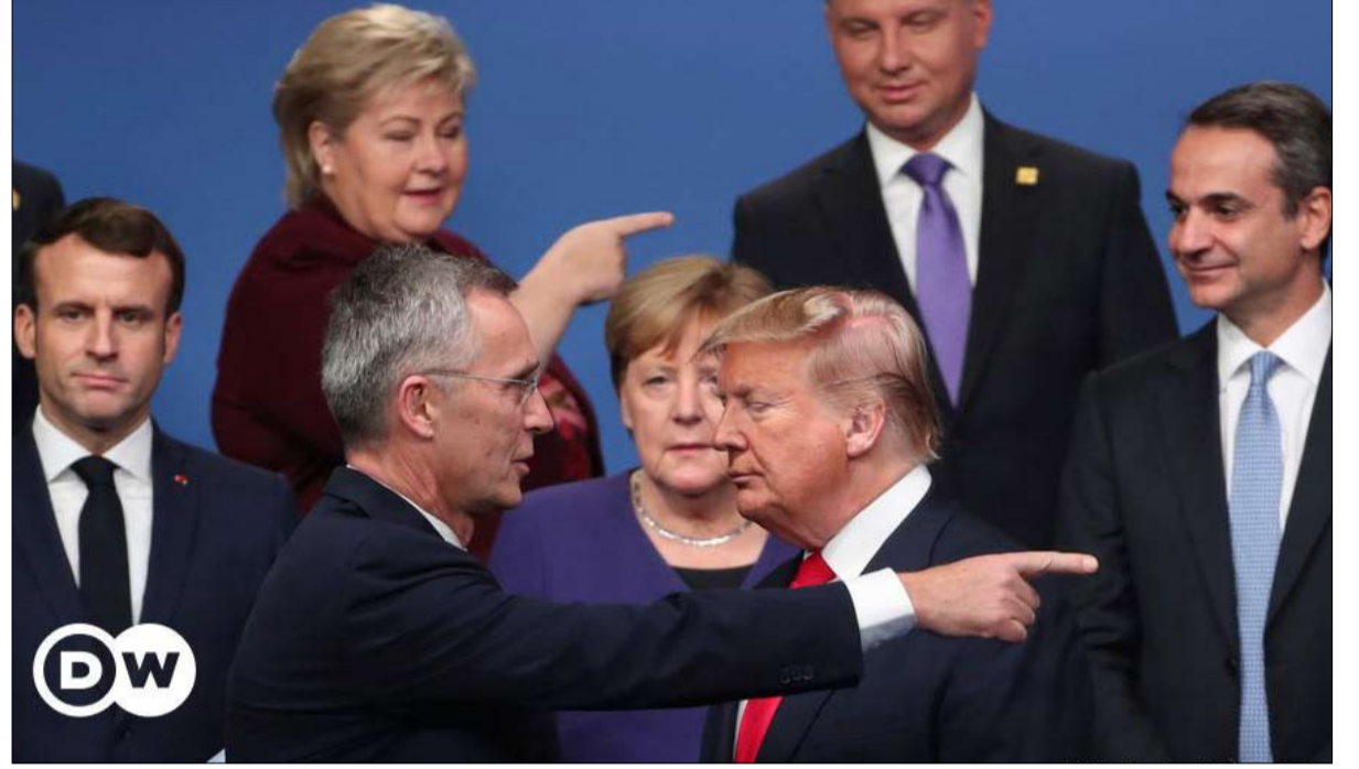
الذين يمضون الناتو بدون الولايات المتحدة؟

ناحية، سوف تستمر الولايات المتحدة في المشاركة في ردع بعض التهديدات الحيوية التي تواجه أوروبا، وخاصة في الشرق الأوسط وروسيا. إن المشاركة الأمريكية في الشرق الأوسط مدفوعة في المقام الأول بمصالحها الأمنية وعلاقتها بإسرائيل، ومن غير المرجح أن يفقد أي من العوامل