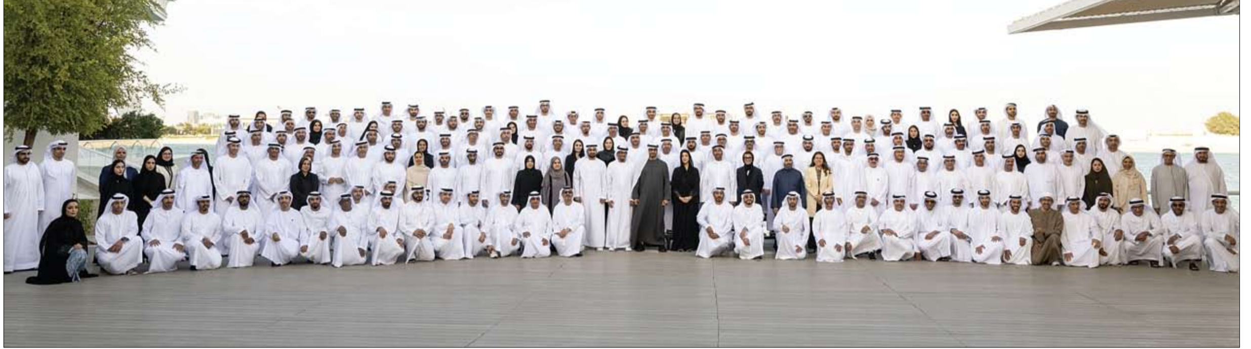
استقبل سفراء الإمارات وممثلي بعثاتها التمثيلية في الخارج