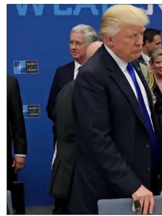
واشنطن تحمي الناتو فمن يحمي الحلف من قرارات ومواقف ترامب؟

العاملة حالياً في تلك المنطقة من ناحية أخرى، ينبغي للقدرات الأوروبية وحدها أن تكون أكثر من كافية لإحداث تأثير رادع على موسكو. وكما يظهر الصراع في أوكرانيا، فإن روسيا ليست دولة لا تقهر على الإطلاق ذلك أن مواردها المالية محدودة. وفي عام 2023، الذي كان عاماً