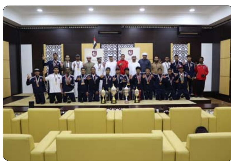
المتمنّى في هذه الرياضة. وأشار إلى أن النادي يعد هذا الاعتماد