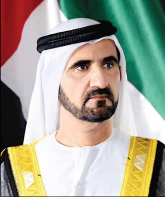
القيام بمهامها بأسلوب سلس، يواكب مكانة دبي كمركز رئيسي للإعلام في المنطقة.

وأكد سمو الشيخ أحمد بن محمد بن راشد آل مكتوم، النائب الثاني لحاكم دبي رئيس مجلس دبي للإعلام، اعتراف المجلس بالثقة الغالية من صاحب السمو الشيخ محمد بن راشد آل مكتوم، والتي انعكست في هذه التشريعات التي من شأنها تعزيز قدرة المجلس على إحداث تقلبات نوعية في إعلام دبي وبما يواكب الأهداف الطموحة للإمارة ويسهم في ترسيخ مكانتها كمركز عالمي للإبداع والابتكار، ووجهة أولى للمواهب والكفاءات الإعلامية ومؤسسات الإعلام من حول العالم. وقال سموه، إن رؤية صاحب السمو