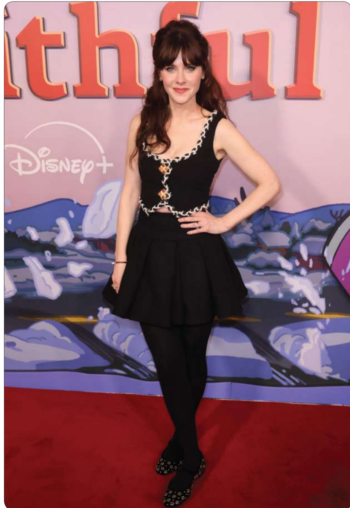
التمثلة والموسيقية الأمريكية زوي ديشانيل لدى حضورها العرض الأول العالمي لفيلم O' mon all ye Faithful في هوليوود.

انتشر فيديو ظهور نادر لنجم هوليوود السابق أرنولد شوارزنيغيفر، على مواقع التواصل الاجتماعي، بسبب الشكل الذي ظهر به نجم كمال الأجسام السابق، وأظهر الفيديو أرنولد وهو يتجول في شوارع مدينة نيويورك، محاطاً بحراس شخصيين، ولكن بدى عليه الكبر والكيل، في حالة لم يعتاد عليها جمهور النجم الذي اشتهر ببنيته الجسمانية القوية. وبدا على شوارزنيغيفر الكبر، خاصة مع مظهره بالشعر الأبيض واللحية البيضاء، والخطوات البطيئة، حتى إن البعض استخدم وصف "أرنولد هرم 200 عام في الأشهر الأخيرة".