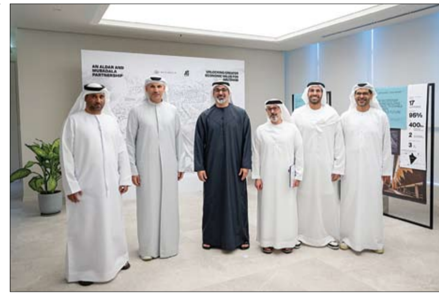
ولي عهد أبوظبي خلال تدهيشه شراكة إستراتيجية جديدة بين «مبادلة، ومجموعة الدار» (وام)

تتابع حملتها الانتخابية في ولاية متأرجحة أخرى هي بنسلفانيا الثلاثاء بأنها اتصلت بالرئيس السابق بعد محاولة الهجوم. وقالت في مقابلة مع الرابطة الوطنية للصحافيين «السود، سألت عنه لتأكد إن كان على ما يرام. وقلت له ما سبق وقلته علناً: لا مكان للتعسف السياسي في بلدنا، ووصف البيت الأبيض الحديث بين المرشحين بأنه كان ودياً ومقتضباً. وقال ترامب إن هاريس كانت في غاية اللطف.