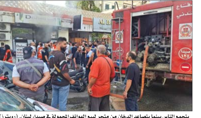
يجمع الناس بينما يتصاعد الدخان من متجر لبيع الهواتف المحمولة في صيدا، لبنان. (رويترز)

• بيروت - رويترز: قال مصدر أمني وشاهد إن أجهزة اتصال لاسلكي محمولة باليد تستخدمها جماعة حزب الله اللبنانية انفجرت أمس الأربعاء في جنوب لبنان والضاحية الجنوبية لبيروت، بعد يوم من وقوع انفجارات مماثلة في أجهزة اتصال لاسلكي تعرف باسم (بيجر) خاصة بالجماعة، مما يفاقم التوتر بين حزب الله وإسرائيل. وقالت الوكالة الوطنية للإعلام في لبنان الأربعاء إن ثلاثة أشخاص قتلوا وأصيب العشرات في أحدث تفجيرات لأجهزة اتصال محمولة في منطقة البقاع بشرق البلاد. ووقع انفجار واحد على الأقل في مكان بالقرب من جنازة نظمها حزب الله لقتلى أمس الأول الثلاثاء الذين سقطوا في تفجير الآلاف من أجهزة البيجر الذي أسفر أيضاً عن إصابة كثير من مقاتلي الجماعة في أنحاء لبنان. وقالت الجماعة، التي حلت بها الفوضى لفترة وجيزة، الأربعاء إنها هاجمت مواقع تابعة للمدافعية الإسرائيلية بصواريخ في أول ضربة توجهها إلى إسرائيل عقب إصابة الآلاف من أعضائها في انفجار أجهزة الاتصال اللاسلكي (بيجر) في لبنان، وأثار ذلك احتمال اتساع نطاق الحرب في الشرق الأوسط.