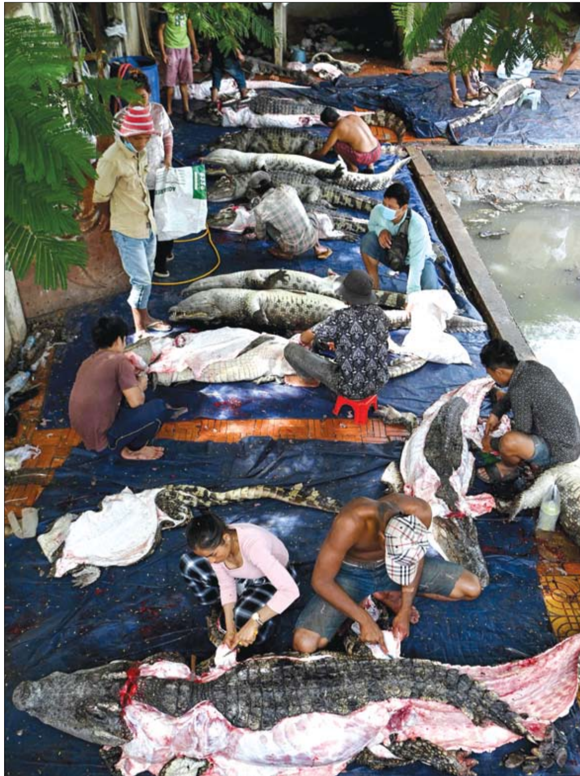
عمال يستخرجون جلود التماسيح في مزرعة في ضواحي بنوم بنه

وتابع: "تأكد من احتواء منتجك على عامل حماية من الشمس SPF. وتحتاج الشفتين إلى حماية من أشعة الشمس تماما مثل باقي أجزاء الوجه والجسم. اشرب الكثير من الماء لترطيب جسمك بالكامل طوال اليوم، وهذا سيساعد على منع شفتيك من الجفاف الفطر والتشقق".