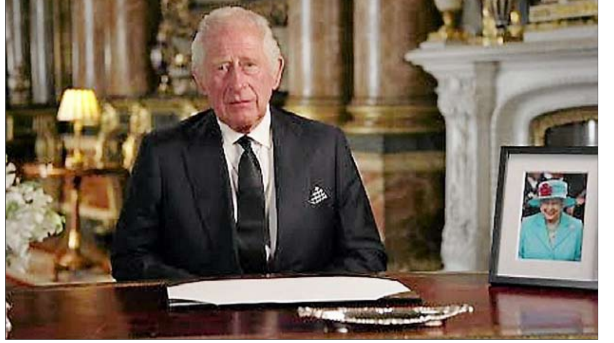
تشارلز الثالث كيف سيكون عهده؟

هارموني، نُشر عام 2010. يعني تشارلز فيه تناغم الطبيعة الذي يقدم، كما كتب، "قواعد وجغرافيا". يجدها في النباتات أو الموسيقى أو العمارة الدينية. في نفس الوقت، أصبح مهتماً بالهوليزم (الكليانية)، والتي عزفها جان سموتس، عالم النبات ورئيس الوزراء السابق الجنوب أفريقي، بأنها "الميل في الطبيعة إلى تكوين كليات أكبر من مجموع أجزائها". ثم قرأ الأمير كارل جوستاف يونج، رائد "علم عمق النفس" ومفهوم "الوعي الجماعي". باختصار، نحن معه بعيدون عن ديكارث أو روح التنوير.