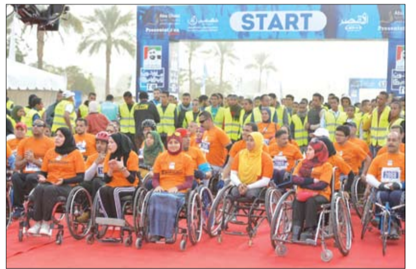
إقبال كبير من المصريين على التسجيل في النسخة السابعة من ماراثون زايد الخيري