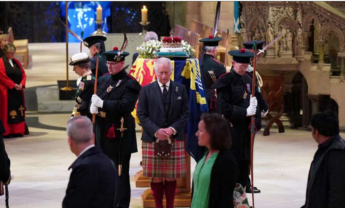
وحدة المملكة من أبرز تحدياته

تولى تشارلز الثالث العرش في وقت معقد ومضطرب، بين خروج بورييس جونسون ووصول ليز تروس في 10 داوونينغ ستريت، في حين أن الملكة تقف تحت ضربات التضخم، وتراجع الجنيه، وعواقب البريكسيت. سيكون عليه إدارة أولويتين يمكن أن تطبعا فترة حكمه: الأولى هي إظهار تقشف جديد لنظام ملكي مبدئ حتى الآن، في حين أن القدرة الشرائية للبريطانيين أخذت في الانهيار. سيهز تشارلز الثالث "الشركة"، اللقب الذي أطلقه والده فيليب على البلاط الملكي، من خلال تقليد اليد العاملة والمحيط الملكي. يريد تشارلز نظاماً ملكياً