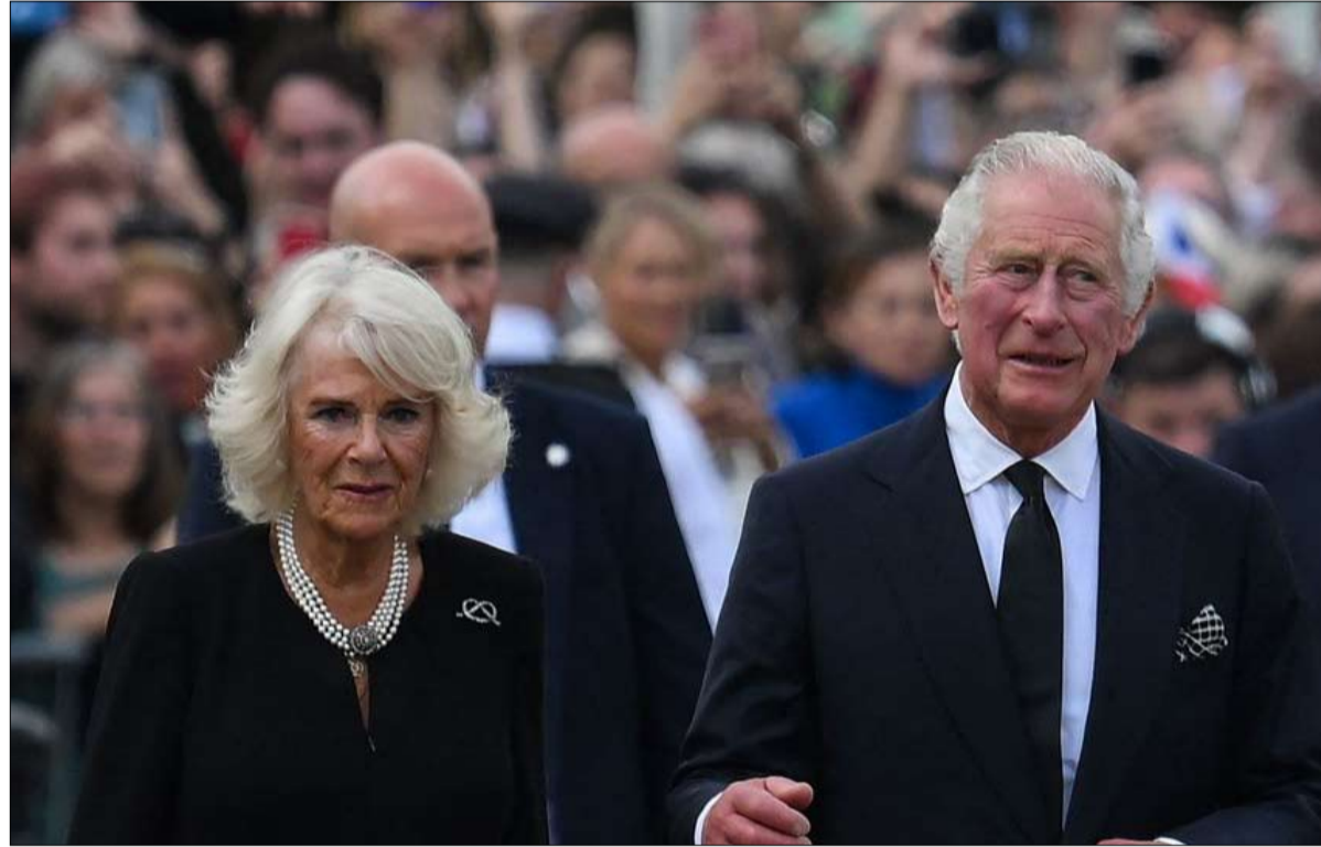
تظل كامبلا حب حياته

سمتان تميزان شخصيته؛ ثباته في الحب ومساره الفكري