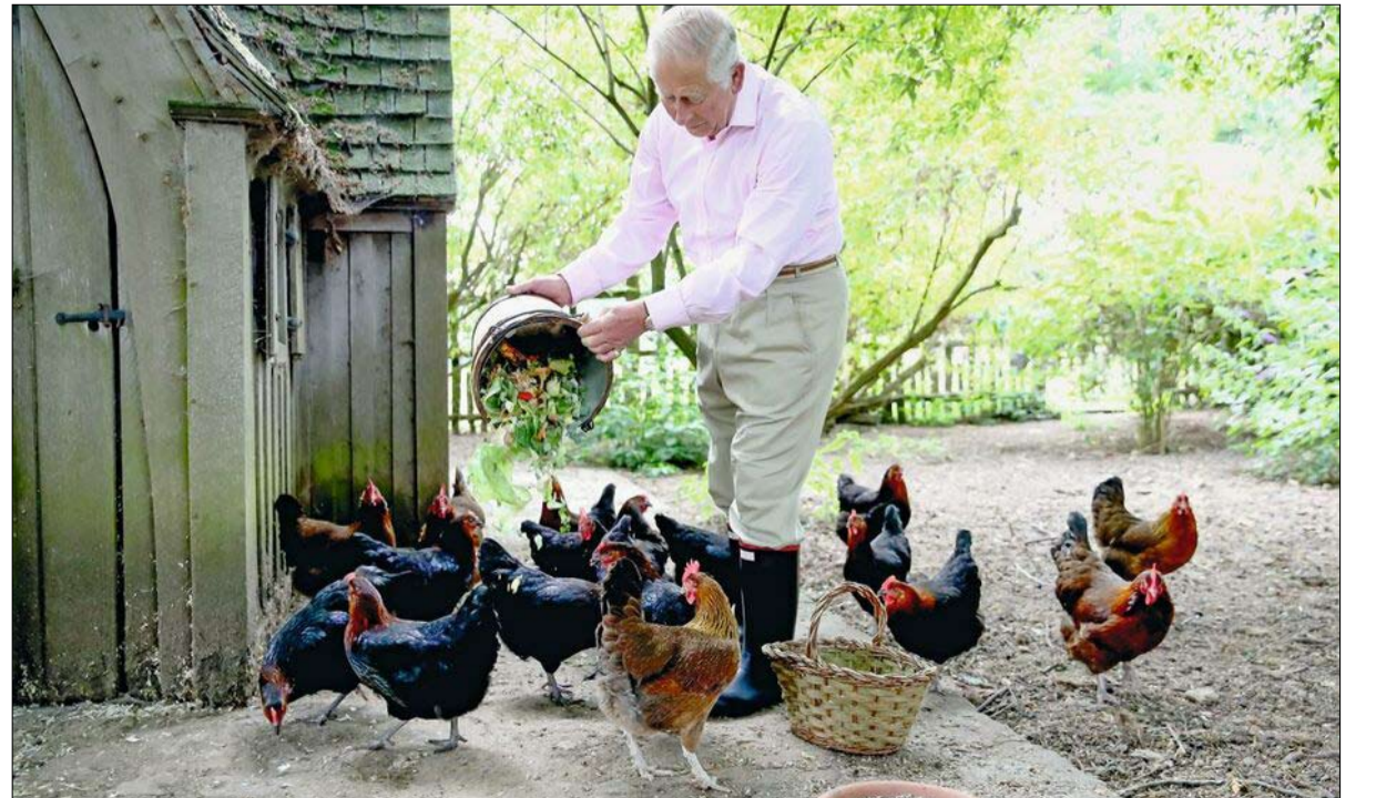
من الرواد في مجال البيئة وقد يكون ملكها