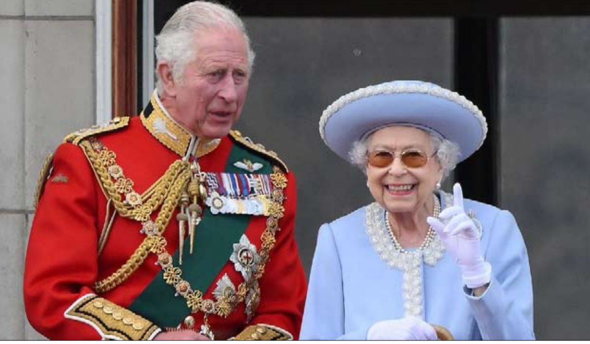
خلافة والدته حمل ثقيل