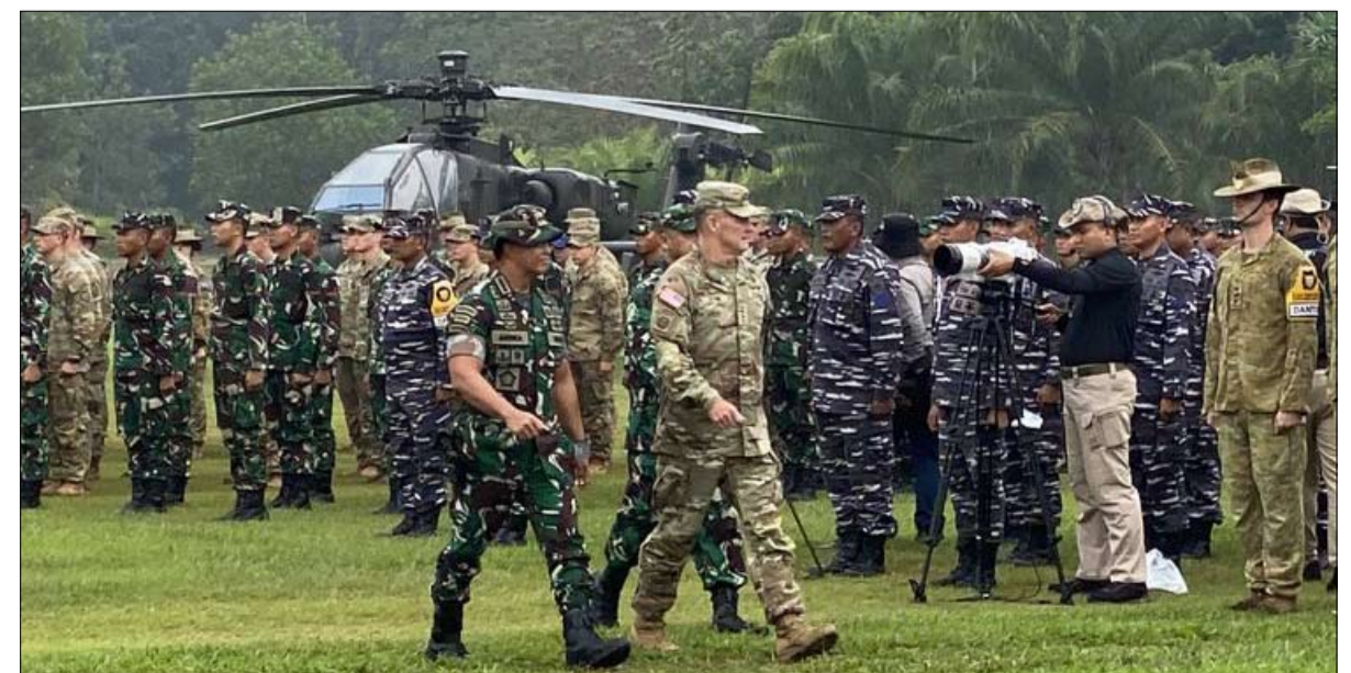
بالنظر للمشاركين وكانه برفقة لاحتواء الصين

تعود الزيارة السابقة لقائد القوات المسلحة الأمريكية لإندونيسيا إلى عام 2008. وفي نهاية هذه الزيارة، أعلن أندريكا بدوره للصحافة أن إندونيسيا تجد الصين "عدوانية بعض الشيء" على المستوى البحري فيما يتعلق بمسألة نزاع بحري