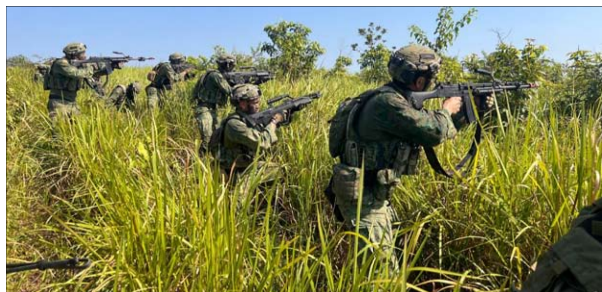
الجيش الإندونيسي يشارك في تمرين سوبار جارودا شيلد