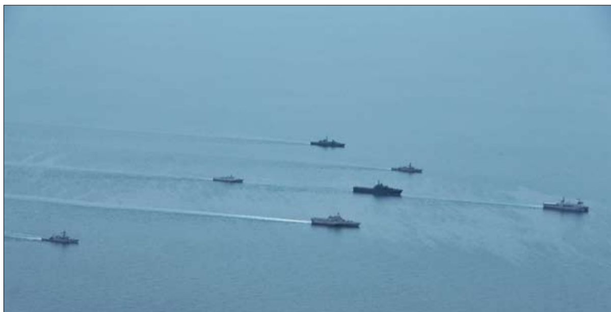
مناورات بحرية أيضا

- أستاذ وباحث في إدارة ما بين الثقافات ضمن فريق "الإدارة والجمع". منذ عام 2003، مجال أبحاثه هو إندونيسيا.