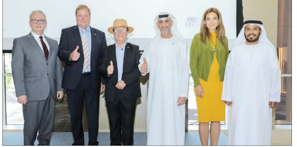
برعاية نهيان بن مبارك