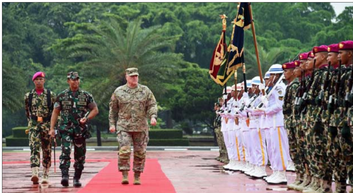
الجنرال أندريكا بيركاسا، رئيس أركان الجيش الإندونيسي، يستقبل نظيره الأمريكي، الجنرال مارك ميلي

يلازم آلاف الأشخاص مراكز إيواء في جنوب غرب اليابان الأحد مع ترقب وصول الإعصار "نامادول" الذي دفع السلطات إلى إصدار أوامر إخلاء للملايين السكان. وكانت وكالة الأرصاد الجوية اليابانية قد أصدرت "تحذيرا خاصا" لمنطقة كاغوشيما في جنوب جزيرة كيوشو، وهو تحذير لا يصدر إلا عندما تتوقع الهيئة ظروفا مناخية تشهدهما البلاد مرة خلال عقود. ويحلول صباح الأحد كان التيار الكهربائي مقطوعا عن 25680 منزل في ناحية ميازاكي في كاغوشيما، في حين توقفت خدمات القطارات والحلات الجوية والعبارات على أن تعود للعمل بعد انحسار العاصفة، وفق ما أعلنت هيئة المرافق المحلية والنقل. وحذرت وكالة الأرصاد الجوية اليابانية من أن المنطقة قد تواجه مخاطر "غير مسبوقة" من جراء الرياح والأمطار. والسبت قال رئيس وحدة توقعات الطقس في الوكالة ريوئا كورورا