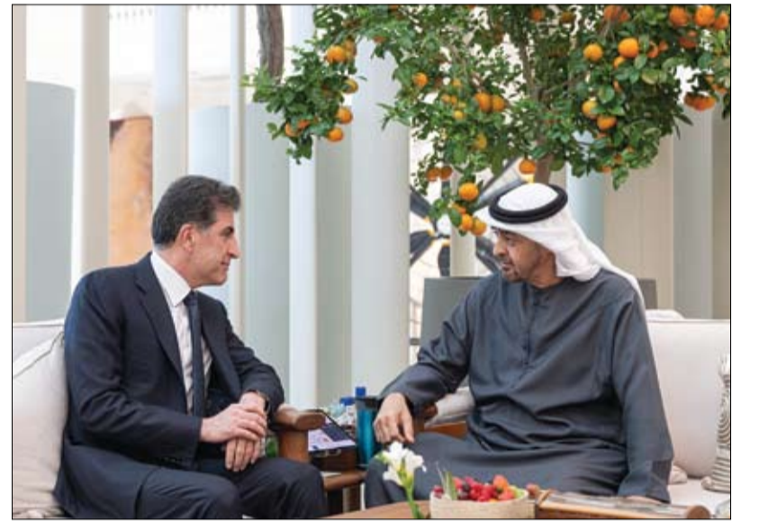
رئيس الدولة خلال استقباله رئيس إقليم كردستان العراق

• أبو ظبي - وام: تقبل صاحب السمو الشيخ محمد بن زايد آل نهيان رئيس الدولة حفظه الله أمس التعازي في وفاة حمد بن سهيل الخبيلي رحمه الله من عدد من الشيوخ والمسؤولين والمواطنين في قصر المشرف في أبو ظبي. كما تقبل التعازي كل من: سمو الشيخ منصور بن زايد آل نهيان نائب رئيس الدولة نائب رئيس مجلس الوزراء حاكم إمارة أبو ظبي، وسمو الشيخ طحون بن زايد آل نهيان نائب