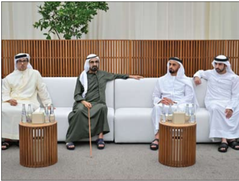
محمد بن راشد يقدم التعازي في وفاة حمد الخبيلي

يومية - سياسية - مستقلة www.alfajrnews.ae