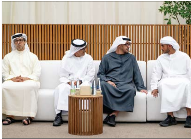
رئيس الدولة يتقبل التعازي في وفاة حمد الخبيلي (وام)

• أبو ظبي - وام: قدم صاحب السمو الشيخ محمد بن راشد آل مكتوم نائب رئيس الدولة رئيس مجلس الوزراء حاكم إمارة أبو ظبي مستشار الأمن الوطني، سمو الشيخ نهيان بن سلطان آل نهيان وزير الداخلية وسمو الشيخ فلاح بن زايد آل نهيان وسمو الشيخ محمد بن راشد آل نهيان نائب رئيس مجلس الوزراء حاكم إمارة أبو ظبي، وفاء حمد بن سهيل الخبيلي رحمه الله في قصر المشرف في أبو ظبي. كما قدم التعازي، سمو الشيخ حمدان بن محمد بن راشد آل مكتوم ولي عهد دبي بجانب عدد من الشيوخ والمسؤولين والمواطنين. وتقبل التعازي كل من: سمو