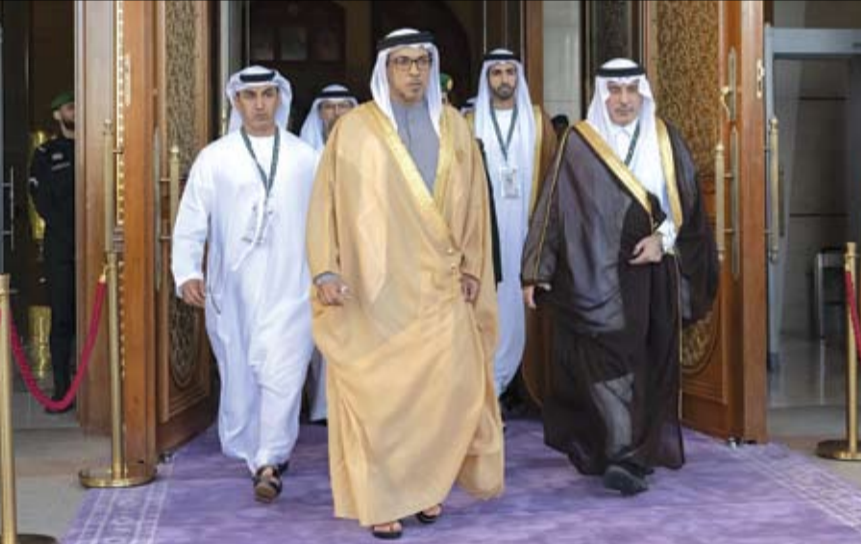
منصور بن زايد لدى وصوله إلى الرياض للمشاركة في القمة العربية الإسلامية (وام)

بين البلدين وسبل تعزيزها وتطويرها بما يخدم مصالحهما المشتركة، كما وتطرق اللقاء إلى جدول أعمال القمة إضافة إلى القضايا والموضوعات ذات الاهتمام المشترك. ونقل سموه تحيات صاحب السمو الشيخ محمد بن زايد آل نهيان رئيس الدولة "حفظه الله" إلى جلالة الملك عبدالله الثاني ابن الحسين، فيما حملته جلالته نقل تحياته إلى صاحب السمو رئيس الدولة وتمنياته لدولة الإمارات وشعبها دوام التقدم والازدهار. كما استقبل سمو الشيخ منصور بن زايد آل نهيان نائب رئيس الدولة نائب رئيس مجلس الوزراء رئيس ديوان الرئاسة، أمس الشيخ خالد بن عبدالله آل خليفة نائب رئيس مجلس الوزراء في مملكة البحرين وذلك على هامش أعمال القمة العربية الإسلامية غير العادية التي تستضيفها المملكة العربية السعودية الشقيقة بالرياض. وعبرت الجانبان خلال اللقاء علاقات الصداقة والتعاون