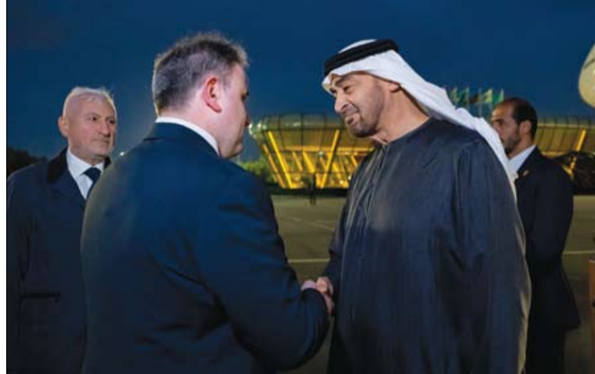
محمد بن زايد لدى وصوله باكو للمشاركة في مؤتمر كوب 29

وصل صاحب السمو الشيخ محمد بن زايد آل نهيان رئيس الدولة "حفظه الله"، أمس إلى مطار حيدر علييف الدولي في باكو في زيارة عمل إلى جمهورية أذربيجان يشارك خلالها في مؤتمر الأطراف في اتفاقية الأمم المتحدة الإطارية بشأن تغير المناخ كوب 29 الذي تستضيفه أذربيجان خلال الفترة من 11 إلى 22 نوفمبر الجاري تحت شعار (التضامن من أجل عالم أخضر). على صعيد متصل استقبل صاحب السمو الشيخ محمد بن زايد آل نهيان رئيس الدولة (حفظه الله) أمس فضيلة الإمام الأكبر شيخ الأزهر الدكتور أحمد الطيب شيخ الأزهر الشريف... وذلك على هامش زيارة العمل التي يقوم بها سموه إلى جمهورية أذربيجان للمشاركة في مؤتمر الأطراف في اتفاقية الأمم المتحدة بشأن تغير المناخ - العلاقات بين دولة الإمارات