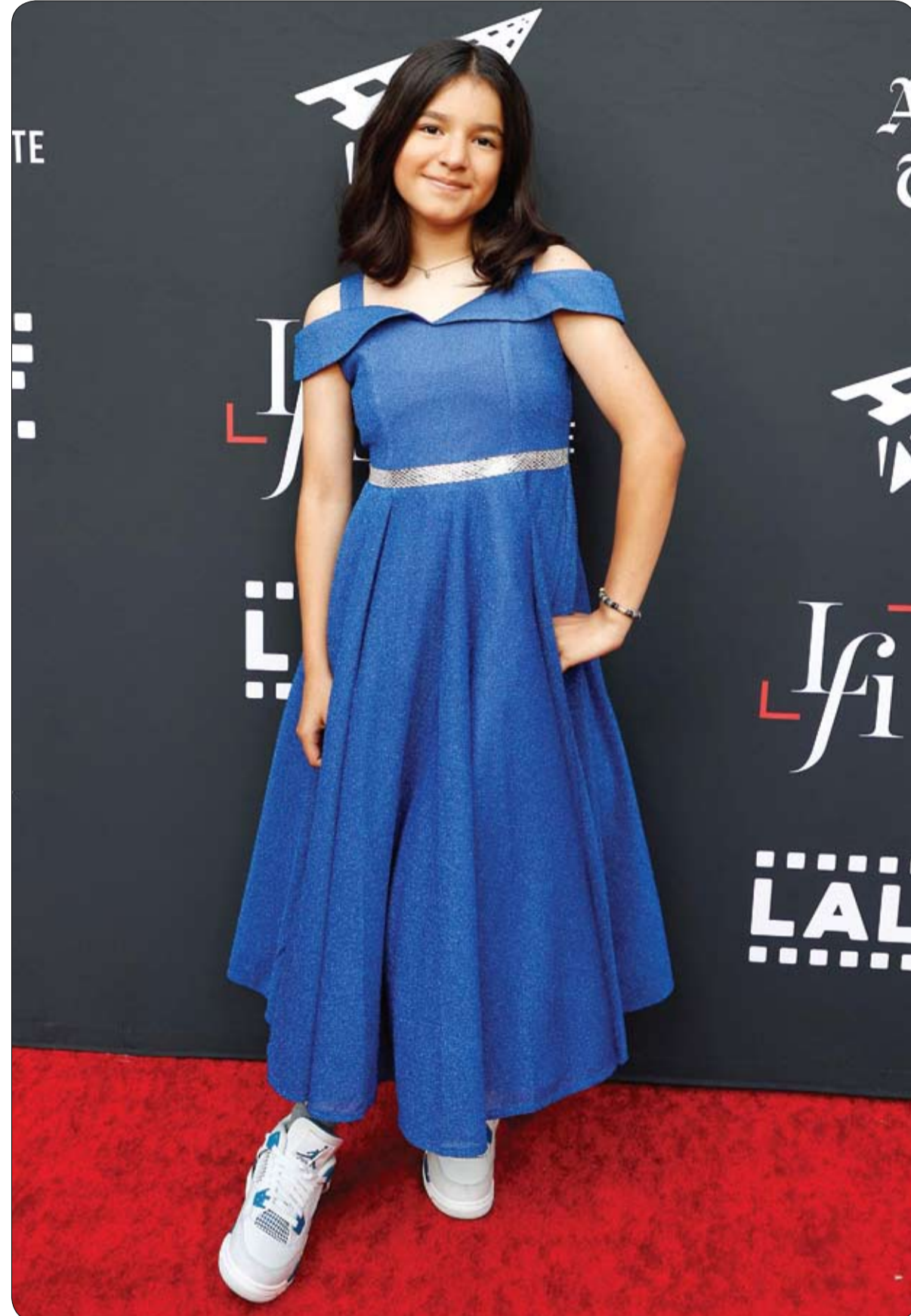
المثلة دريا كاستيلو لدى حضورها العرض الأول لفيلم In the Summers خلال افتتاح مهرجان لوس أنجلوس السينمائي اللاتيني. (ا ف ب)

وقالت المنظمة إن الرجل المقيم في المكسيك والبالغ من العمر 59 عاماً توفي في 24 أبريل بعد معاناته من حمى وضيق تنفس وإسهال وغثيان وإعياء عام. وكانت هذه أول حالة يرصدها العالم لإصابة بشرية مؤكدة من المختبرات بمتحور إيه (إتش 2 إن) من إنفلونزا الطيور وأول حالة إصابة بفيروس إتش 5 بين البشر في المكسيك، وأوضحت المنظمة أن الرجل ليس له تاريخ في التعرض للطيور الداجنة أو الحيوانات الأخرى. وأضافت المنظمة أن الشخص كان يعاني من ظروف طبية متعددة سلفاً وكان طريح الفراش لثلاثة أسابيع، لأسباب أخرى، قبل ظهور الأعراض الحادة عليه.