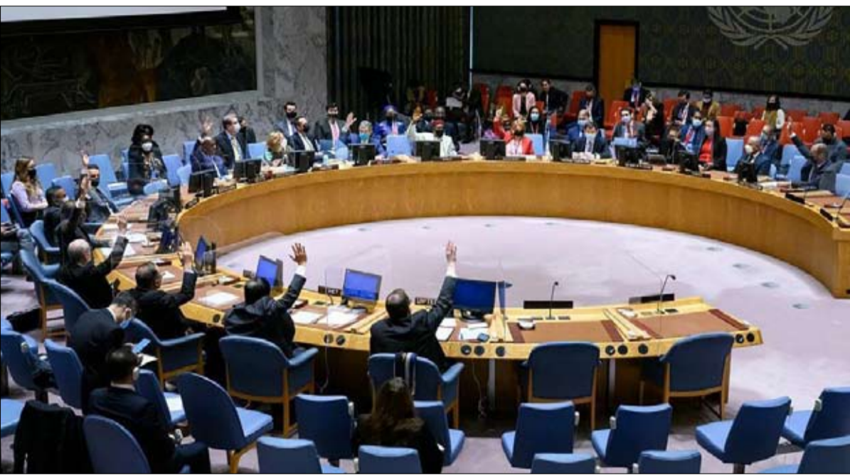
التصويت في مجلس الأمن قد لا يعبر عن الرأي العالمي