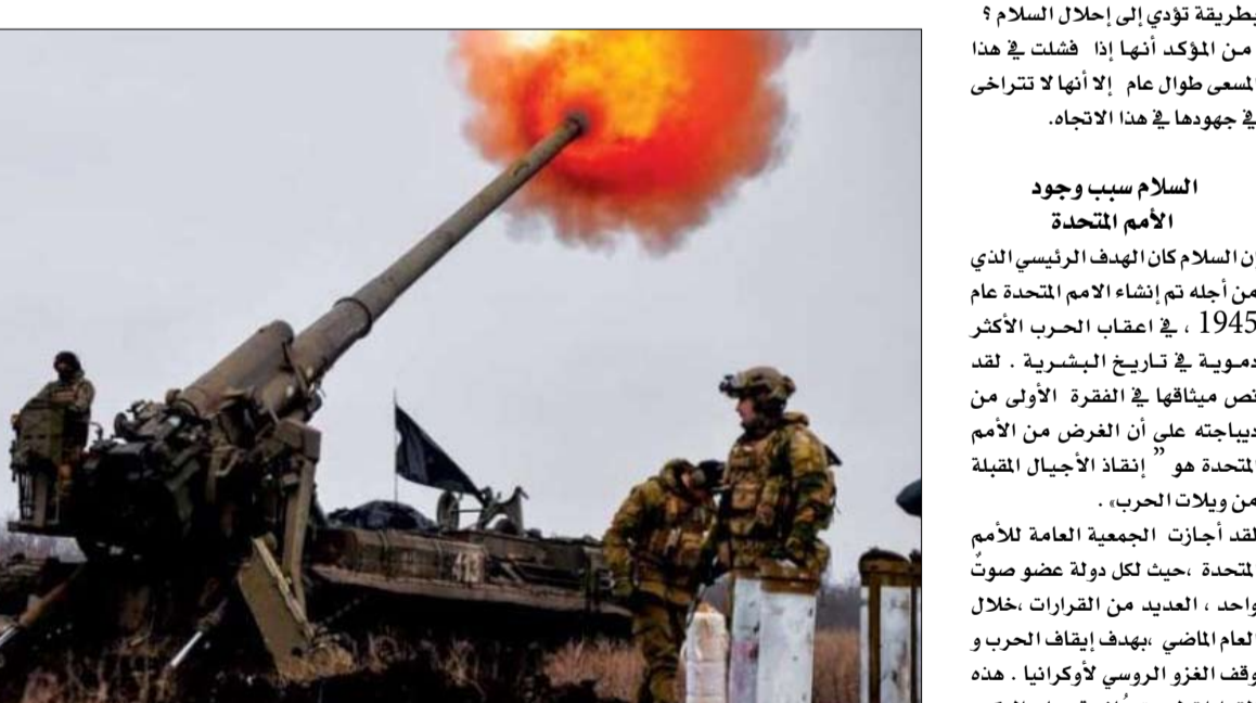
من يوقف الحرب الأوكرانية في ظل العجز الدولي؟

تدخل من قوات حفظ السلام بشكل ملموس ، هل يمكن لوحدات القبعات الزرقاء إنشاء القبعات الروسية على مواصلة اجتياحها للأراضي الأوكرانية ؟ و بعيدا عن مسألة الإمكانيات السياسية لهذه العملية ، فإنه يجب نشر عدد كبير جدا من الرجال و العتاد . و هل يمكن تخيل إمكانية نشر وحدات القبعات الزرقاء الذين توجد أعداد كبيرة منهم من سبعة و تسعين دولة مختلفة ، من بينها الباكستان و الهند و غانا و بنغلاديش و إثيوبيا ، ممّا يطرح مسألة تضييق المسؤوليات