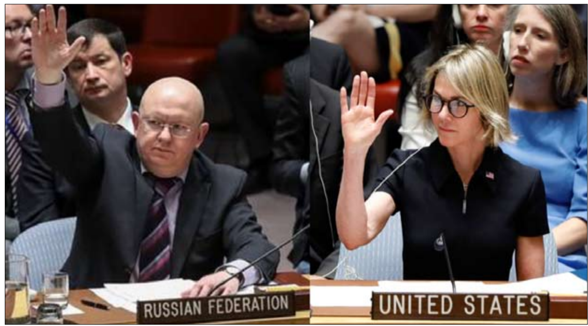
مشاريع قرارات مهمة جدا تتحطم على ضخرة الفيتو