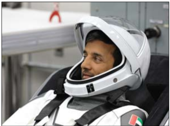
رائد الفضاء الإماراتي سلطان النيادي في مهمة لاستكشاف الفضاء

ويتواجد طاقم المهمة الآن داخل كبسولة كرو دراغون التابعة لشركة سبيس إكس، حيث سيقتضي حوالي 24 ساعة في مدار حول الأرض، قبل الالتحاق بمحطة الفضاء الدولية. وأكد صاحب السمو الشيخ محمد بن زايد آل نهيان رئيس الدولة حفظه الله بمناسبة هذا الإنجاز، أن المشاركة في هذه المهمة تشكل جانباً مهماً