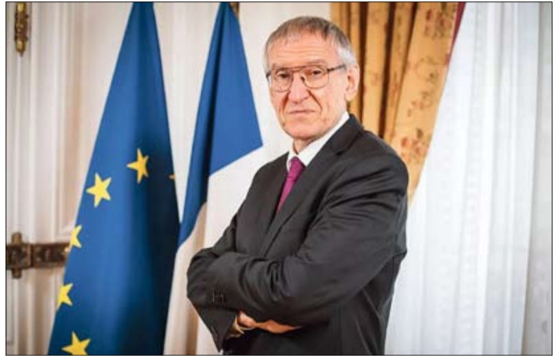
المنوب العام للتسلح، جويل بري يكشف حقيقة مزعجة