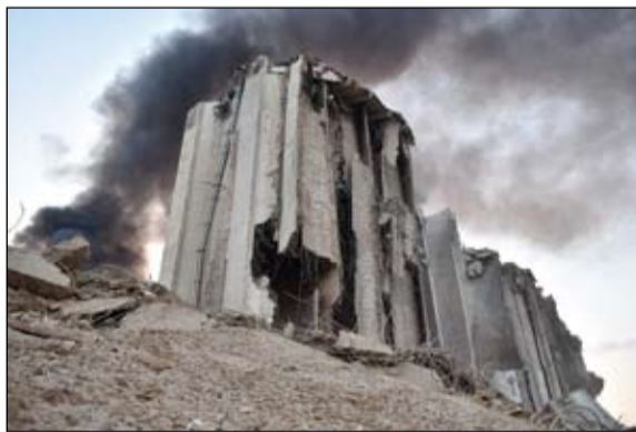
صورة تظهر الصوامع المدمرة في موقع الانفجار الهائل في ميناء بيروت.

أكد وزير الخارجية الفرنسي جان إيف لودريان خلال زيارة خاطفة إلى الجزائر أنه لا غنى عن التعاون بين البلدين من أجل استقرار المنطقة.