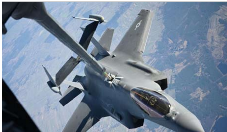
الامان فضلوا اف35- الامريكية على رفال الفرنسية