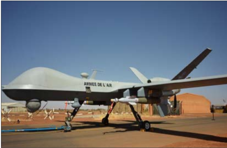
طائرة مسيرة مسلحة للجيش الفرنسي مزودة بقنبلتين