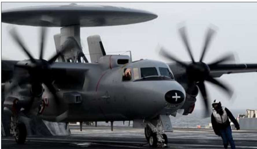
الحرب في أوكرانيا غيرت قواعد اللعبة