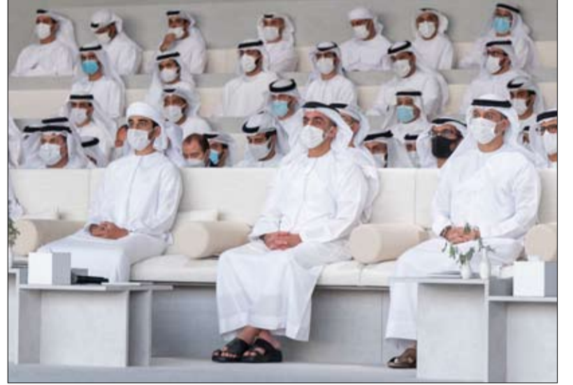
نظمها مجلس محمد بن زايد