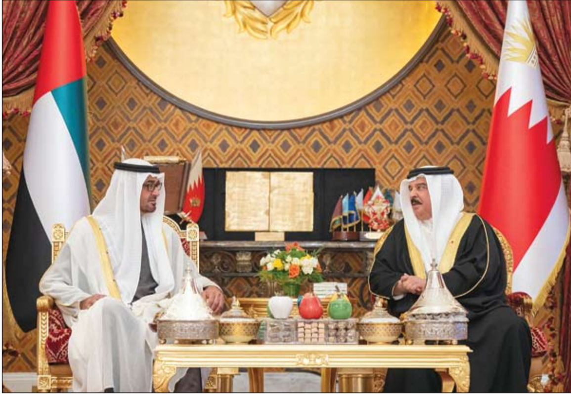
محمد بن زايد خلال مباحثاته مع ملك البحرين في قصر الصخير

وأرب صاحب السمو الشيخ محمد بن زايد آل نهيان عن سعاده بزيارة مملكة البحرين الشقيقة ولقائه أخيه جلالة الملك حمد بن عيسى آل خليفة في بلده الثاني البحرين وبين أهله .. مؤكدا سموه عمق العلاقات التي تجمع البلدين وقيادتهما وشعبهما الشقيقين والحرص المشترك على مواصلة تعزيزها وتنميتها في مختلف المجالات انطلاقا من الأواصر الأخوية التاريخية المتينة التي تجمعهما. (التفاصيل ص 2)