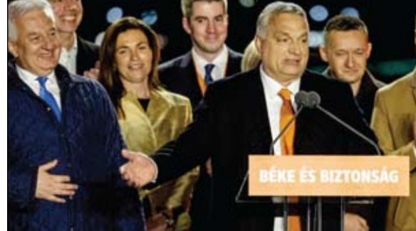
أوريان يصير على التفريد خارج السرب

تسعة أشهر، ستكون ضرورية لتنفيذ هذا القرار، والذي يجب المصادقة عليه من قبل أغلبية مؤهلة مكونة من 51 دولة من أصل 72 دولة عضو، تشمل 56 بالمانة من سكان أوروبا. (التفاصيل ص 9)