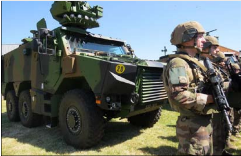
عرض غريفون في ساتوري