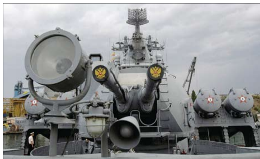
السفينة الحربية الروسية موسكفا، التي تعرضت لحادث وتضررت في البحر الأسود.

التي كانت سابقا ضمن الاتحاد السوفيتي وكانت من آخر الدول التي انضمت لحلف الأطلسي بعد توسعه عام 4002. من أن ترد موسكو على خطوة توسع الناتو وانضمام فنلندا والسويد إليه لزيادة الضغط على الروس جراء عملياتهم العسكرية في أوكرانيا، على أراضي إحدى تلك الدول، في سيناريو شبيه بالسيناريو الأوكراني.