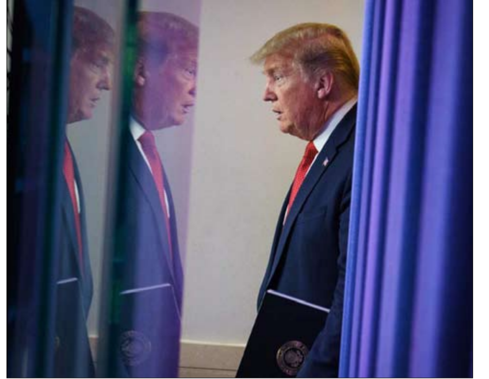
ترامب... تحويل وجهة

حرب تجارية عنيفة، تتبادل أول قوتين عالميتين التهم بالمسؤولية عن الزلزال التوكوي الذي تسبب فيه كوفيد 19. ففي الوقت الذي كان الوباء يتفشى في الصين، احتجت بكين بقوة على وصف الفيروس بأنه "فيروس صيني"، وانتقدت التمييز الذي يعاني منه الآسيويون في الخارج. من جانبها، حددت الولايات المتحدة عدد الصحفيين الصينيين الحكوميين الموجودين على أراضيها بـ 100 في محاولة لمواجهة عمليات الدعاية. ورداً على ذلك، طردت بكين ثلاثة مراسلين من صحيفة وول ستريت جورنال.