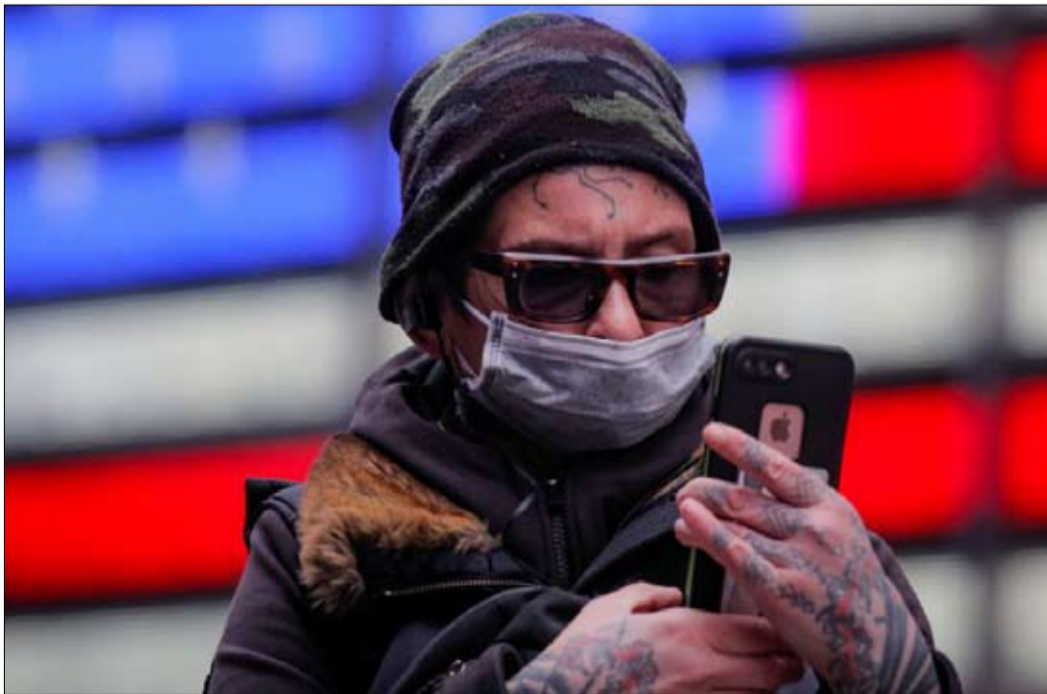
السياسات العنصرية عمقت التفاوت

تدفع الأقليات الثمن على مستوى الصحة، وتفسير ارتفاع ضحاياها اجتماعي اقتصادي