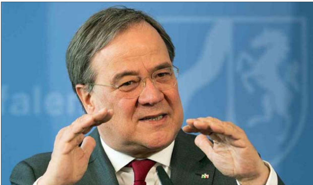
أرمين لاشيت متخلف جدا في استطلاعات الرأي

بواسطة فرانز جوزيف شتراوس، "الثور البافاري" الشهير، وعام 2002 من قبل إدموند ستوبير، وخسر كل منهما الانتخابات. ورغم تكرار ماركوس سودر أن مكانه في بافاريا، وأنه لا يتطلع لكرسي المستشار، وقد يقول إنه لا يقرأ استطلاعات الرأي هذه الأيام، وأن الأرقام الوحيدة التي تهمة هي عدد الأشخاص