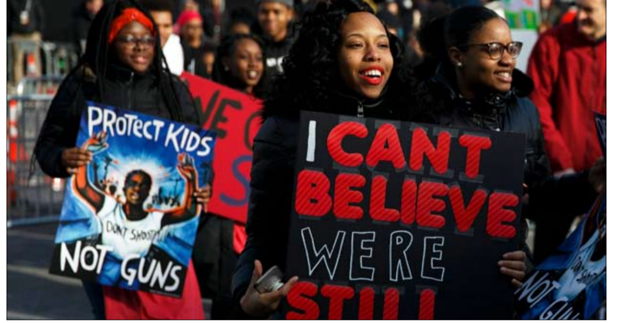
لهذا استهواهم التامين الصحي على طريقة ساندرز