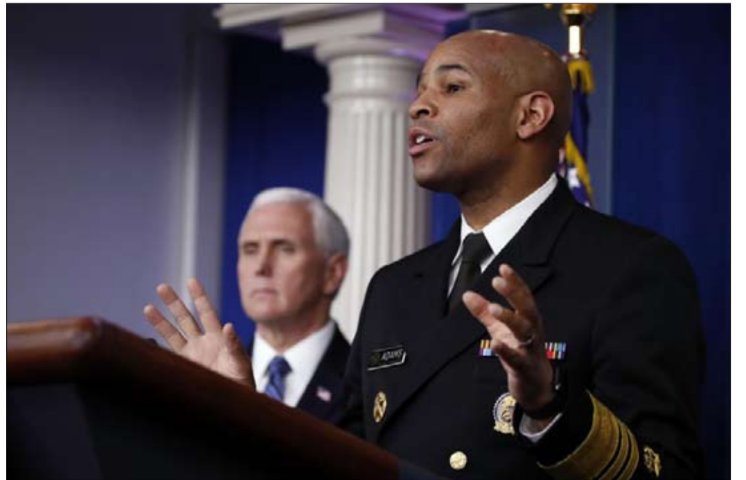
جيروم آدمز... الفقر هو أصل الداء

تدفع الأقليات الثمن على مستوى الصحة، وتفسير ارتفاع ضحاياها اجتماعي اقتصادي