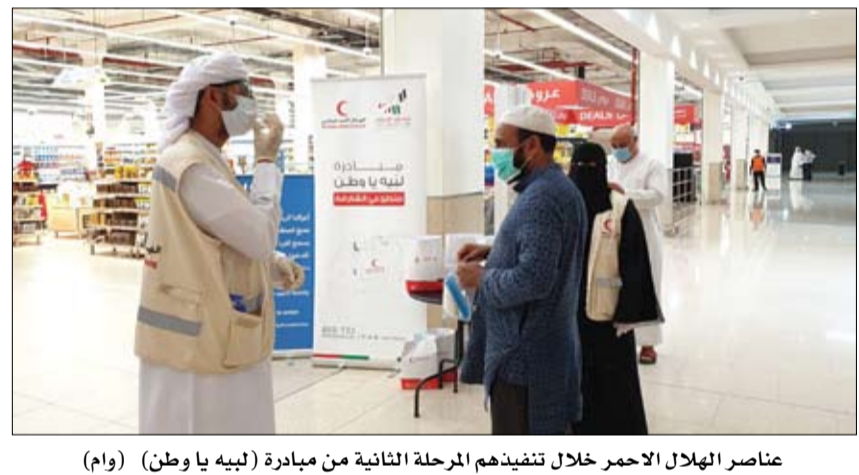
عناصر الهلال الأحمر خلال تنفيذهم المرحلة الثانية من مبادرة (لبيه يا وطن) (وام)

•• أبوظبي-وام: بهدف التصدي لمروجي المعلومات الصحية المغلوطة والحد من انتشار الإشاعات ومن خلال متحدثين وخبراء معتمدين، ومصادر حكومية معتمدة، بعيدا عن مروجي الإشاعات والأخبار المغلوطة. وتفصيلا ينص القرار على أن تقوم وزارة الصحة ووقاية المجتمع والجهات الصحية بالإعلان عن أي معلومات صحية، وإصدار واعتماد الإرشادات الصحية في الدولة، بالإضافة إلى إصدار الإرشادات الصحية التي تتعلق بالأوبئة بعد اعتماد الهيئة الوطنية لإدارة الطوارئ والأزمات والكوارث. (التفاصيل ص2)