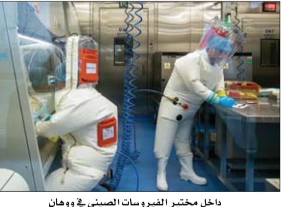
داخل مختبر الفيروسات الصيني في ووهان

•• موسكو-وكالات: طلب الرئيس الروسي فلاديمير بوتين من وزارة الدفاع الروسية، تقديم مقترحات حول إمكانية استخدام وسائل القوات المسلحة الروسية لمكافحة فيروس كورونا المستجد (كوفيد-19). وحسب البيان الذي صدر عن الكرملين، أمس السبت: على وزارة الدفاع الروسية تقديم مقترحات بشأن استخدام القوات المسلحة ووسائل القوات المسلحة الروسية لمكافحة انتشار عدوى فيروس كورونا المستجد، في موعد نهائي هو 22 أبريل (نيسان) الجاري، بحسب وكالة سيوتنيك الروسية. وكان الرئيس الروسي فلاديمير بوتين، قال أمس الأول الجمعة المخاطر المرتبطة بانتشار الوباء لا تزال مرتفعة للغاية، ولم يتم تجاوز الذروة بعد.