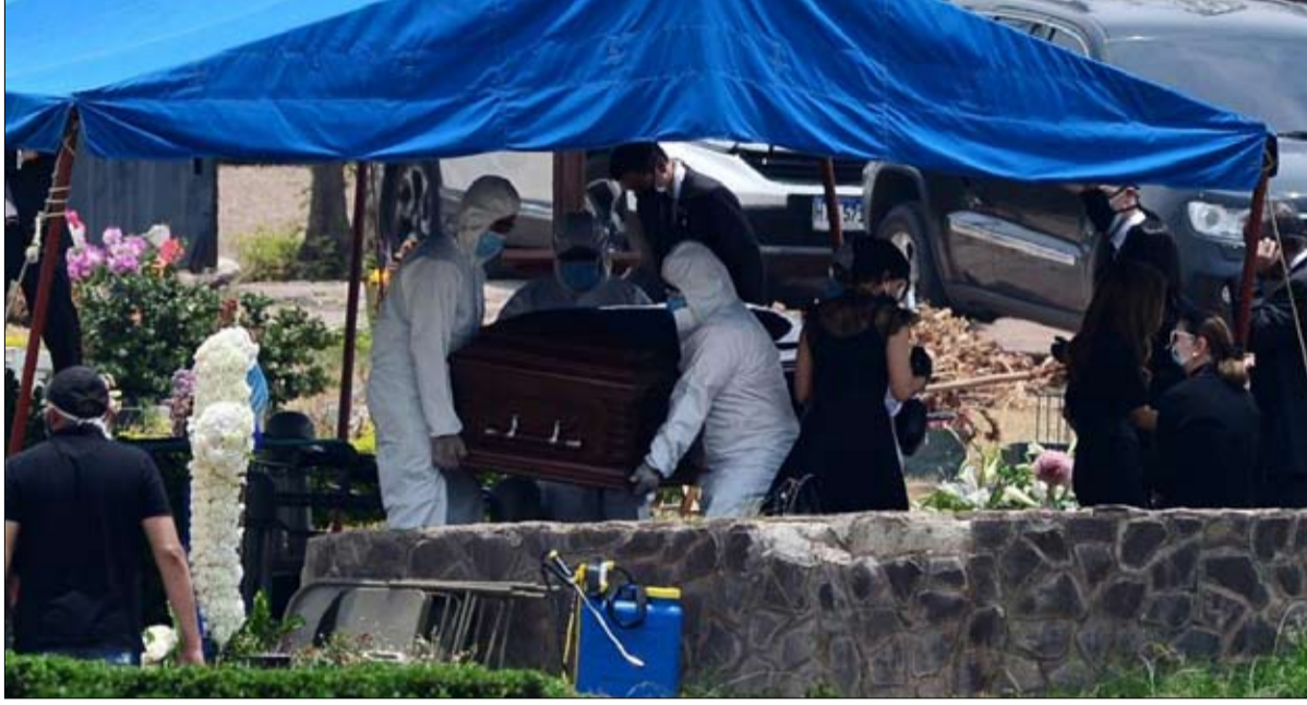
أغلب الوفيات من الاقليات