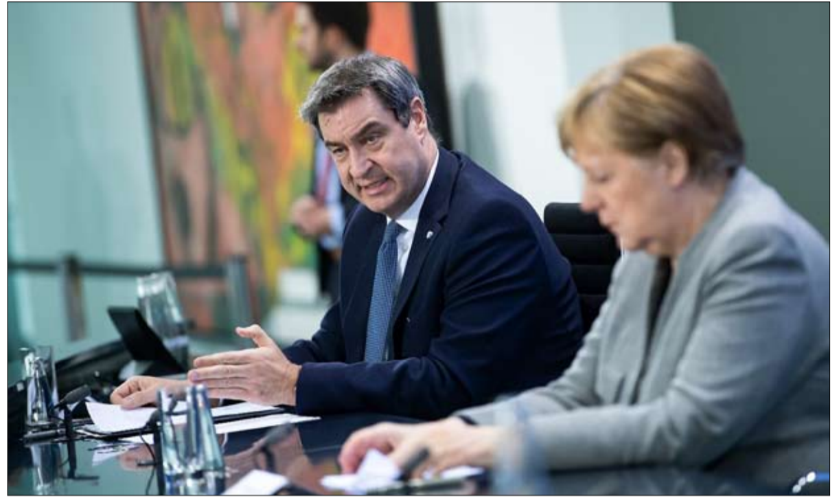
ماركوس سودر النجم الجديد