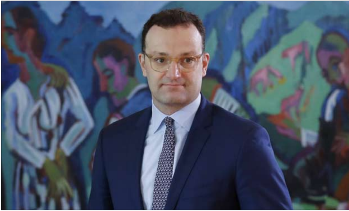
جينس سيبان قد يدفع ثمن الفيروس