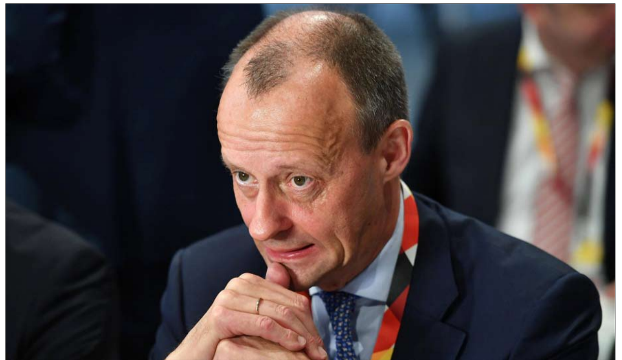
فريدريش ميرز في طي النسيان