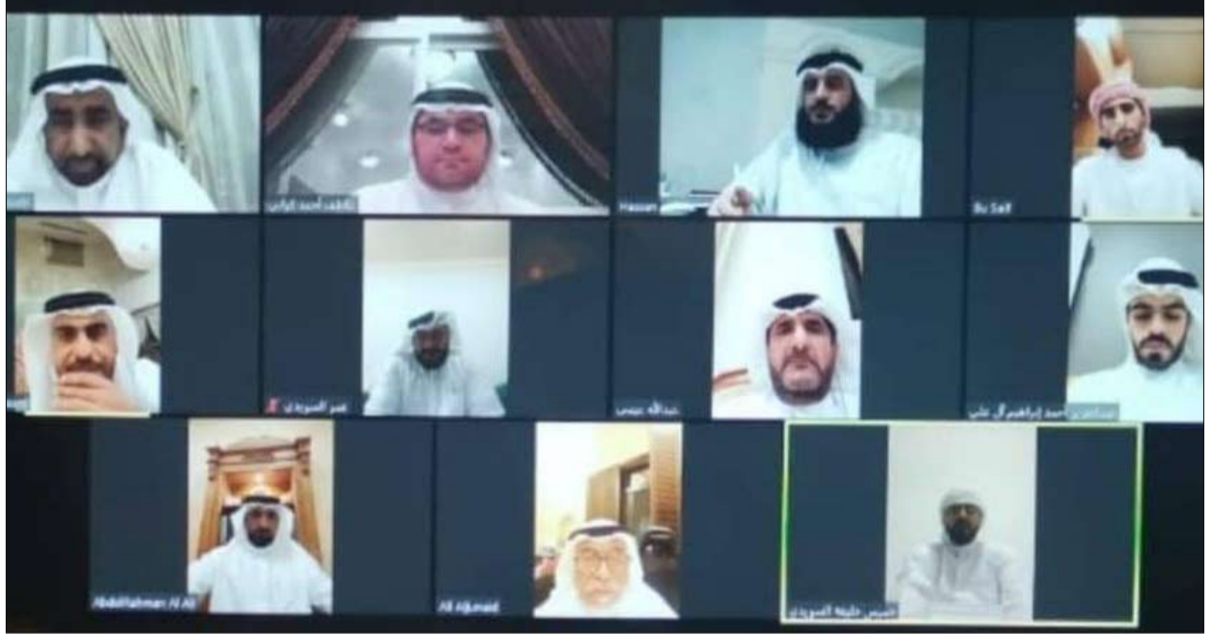
الاجتماع الفرعية المبنقة عن أعمال المجلس الضاحية

بحث مجلس ضاحية الرحمانية مواصلة دوره تحت مظلة دائرة شؤون الضواحي والقرى بحكومة الشارقة في تقديم أوجه العطاء استمرارا لجهود مجالس الضواحي فيما اتخذته من سياسات اجتماعية تشكل رافدا فاعلا ومتجددا في تعزيز التنمية الاجتماعية في إمارة الشارقة ودعم الاسر المتعففة التي تأثرت من جائحة كورونا. وأكدت الرحمانية على مواصلة جهودها الانسانية بالتعاون مع المؤسسات الخيرية لتعزيز التدابير والإجراءات الاحترازية من أجل الوقاية من انتشار فيروس كورونا المستجد الذي أثر على العديد من الاسر معيشيا وتنسيق سبل تواصل الحسنيين ودعمهم لهذه الشريحة الهامة من المجتمع والوقوف معها وضمان استقرارها اسريا ومجتمعي