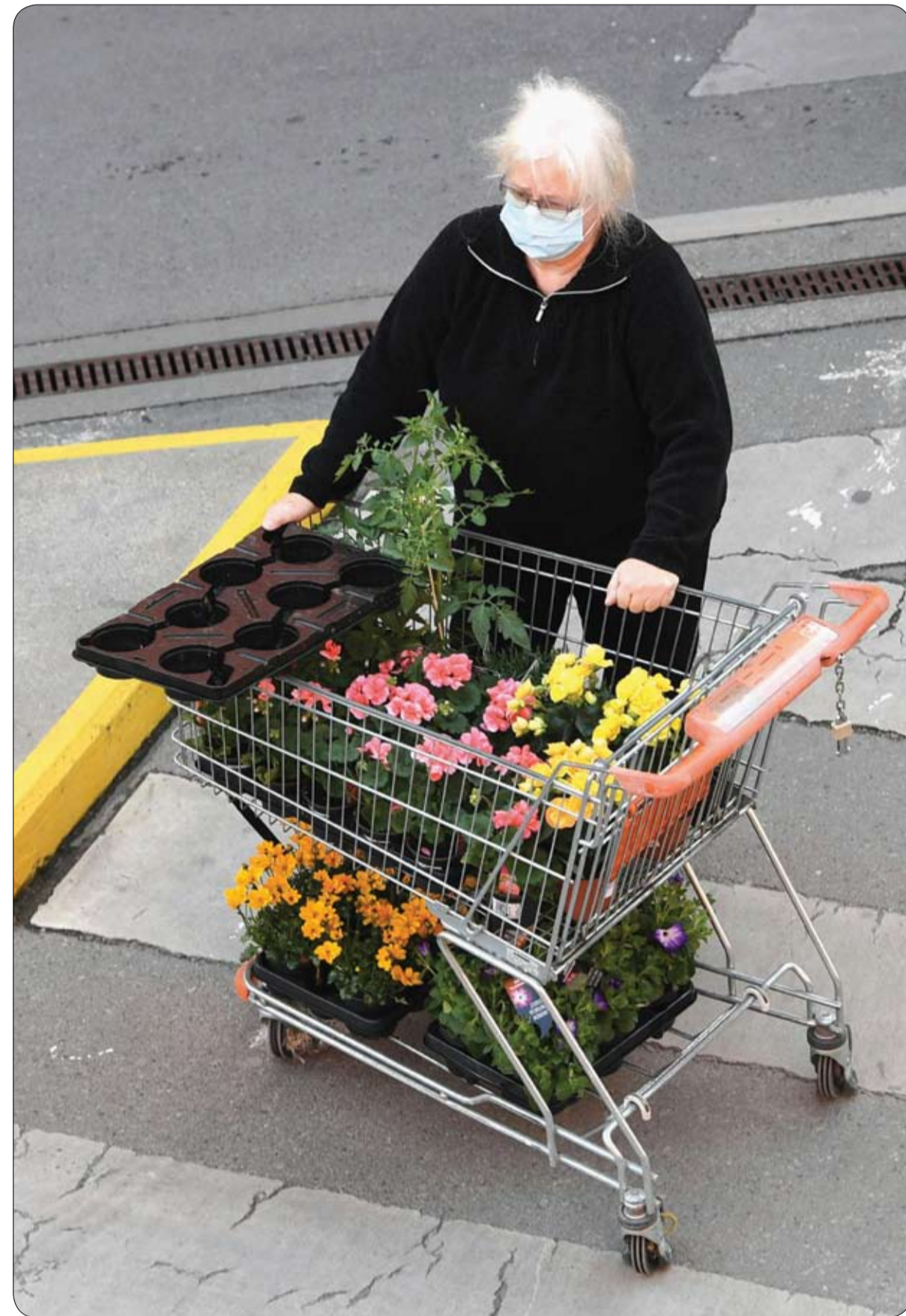
امراة ترتدي قناع وجه تدفع عربة تسوق بالزهور أمام متجر DIY في فيينا، النمسا، بعد إغلاق للحد من انتشار فيروس كورونا الجديد. (ا ف ب)

بعد الكشف عن إصابة عامل توصيل بيتزا بفيروس كورونا المستجد، تعيش عشرات الأسر حالة من الهلع جنوبي العاصمة الهندية دلهي، خشية أن تكون قد تلقت العدوى. وقال حاكم مقاطعة جنوب دلهي بي إم ميشرا، إن العامل كان يتولى توصيل طلبيات البيتزا لأحد سلاسل المطاعم الشهيرة في منطقة مانفيا ناجا، وقد ثبتت إصابته بالفيروس مما أدى إلى اتخاذ إجراءات فورية لضمان عدم تقيشه.