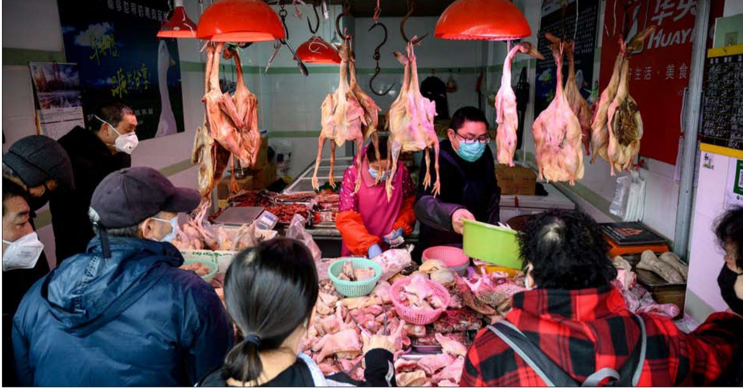
اسواق ووهان متهمه