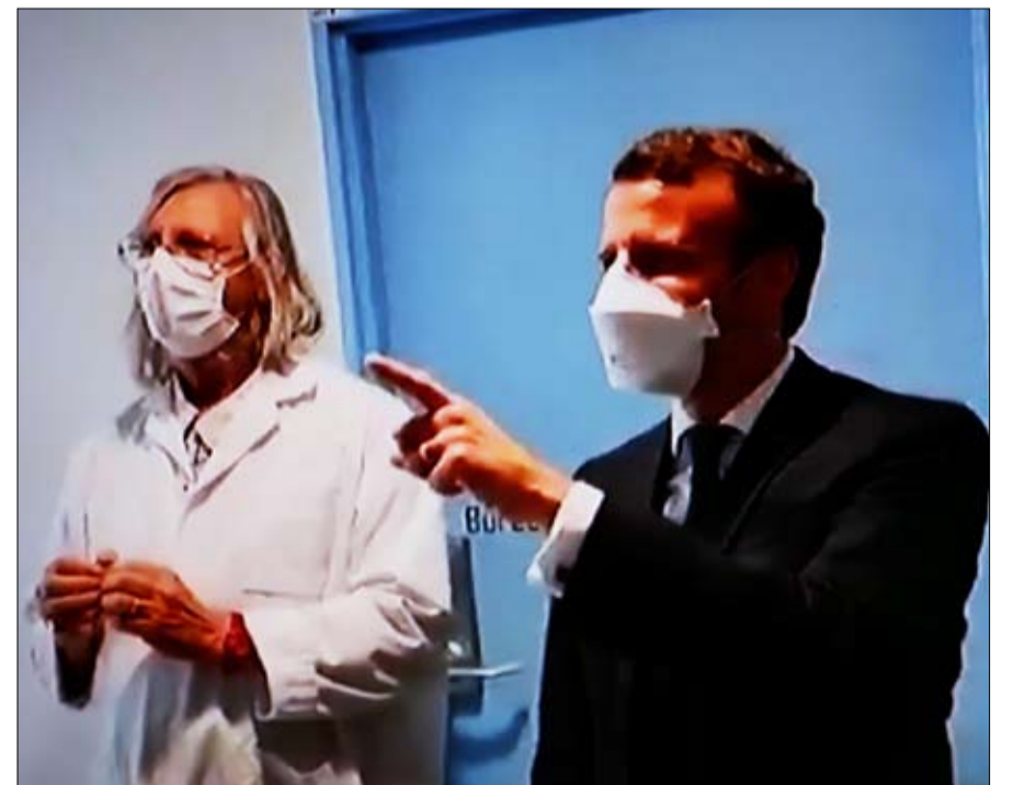
ماكرون هل صدق الشائعة