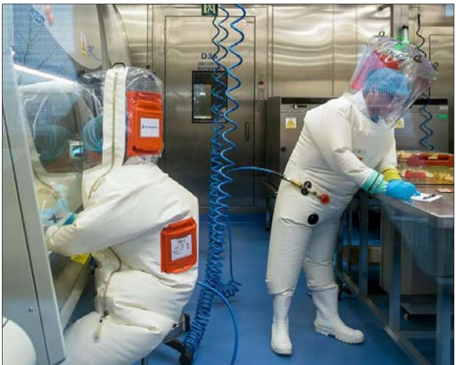
داخل مختبر الفيروسات الصيني في ووهان

تعتقد الدبلوماسية الصينية من جهتها أن هذا التسريب المزعم ليس له أساس علمي