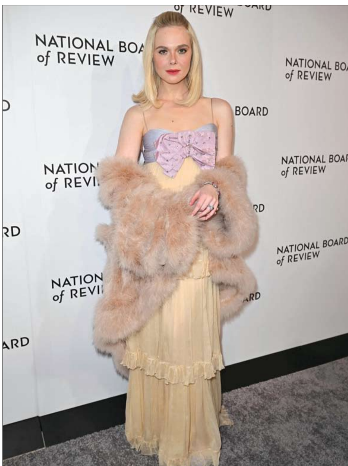
الممثلة الأمريكية إيل فانينج لدى حضورها حفل توزيع جوائز المجلس الوطني للمراجعة في نيويورك.

وينصح أيضاً بقراءة وصف المنتجات وتجنب شراء الأساور التي يعلن عن احتوائها على المطاط الفلوري.