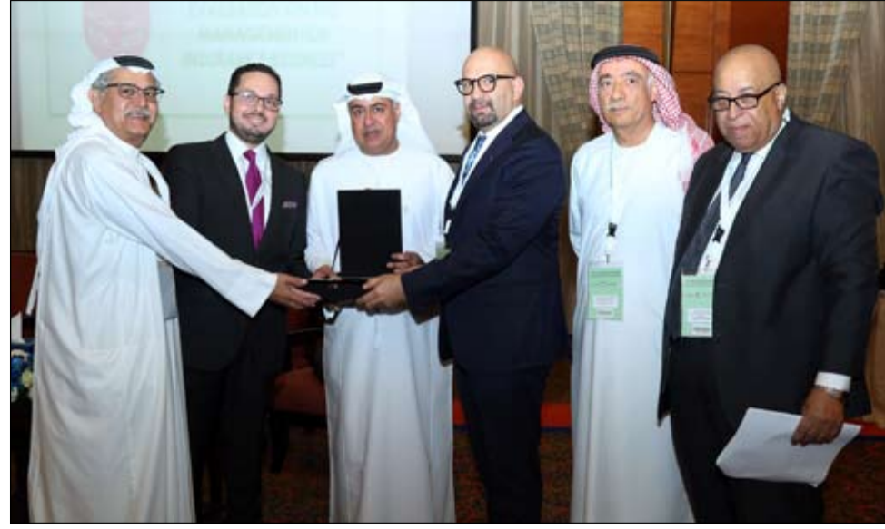
بمشاركة أكثر من 100 قيادي وخبير تأمين وممثلي هيئات الإشراف والرقابة