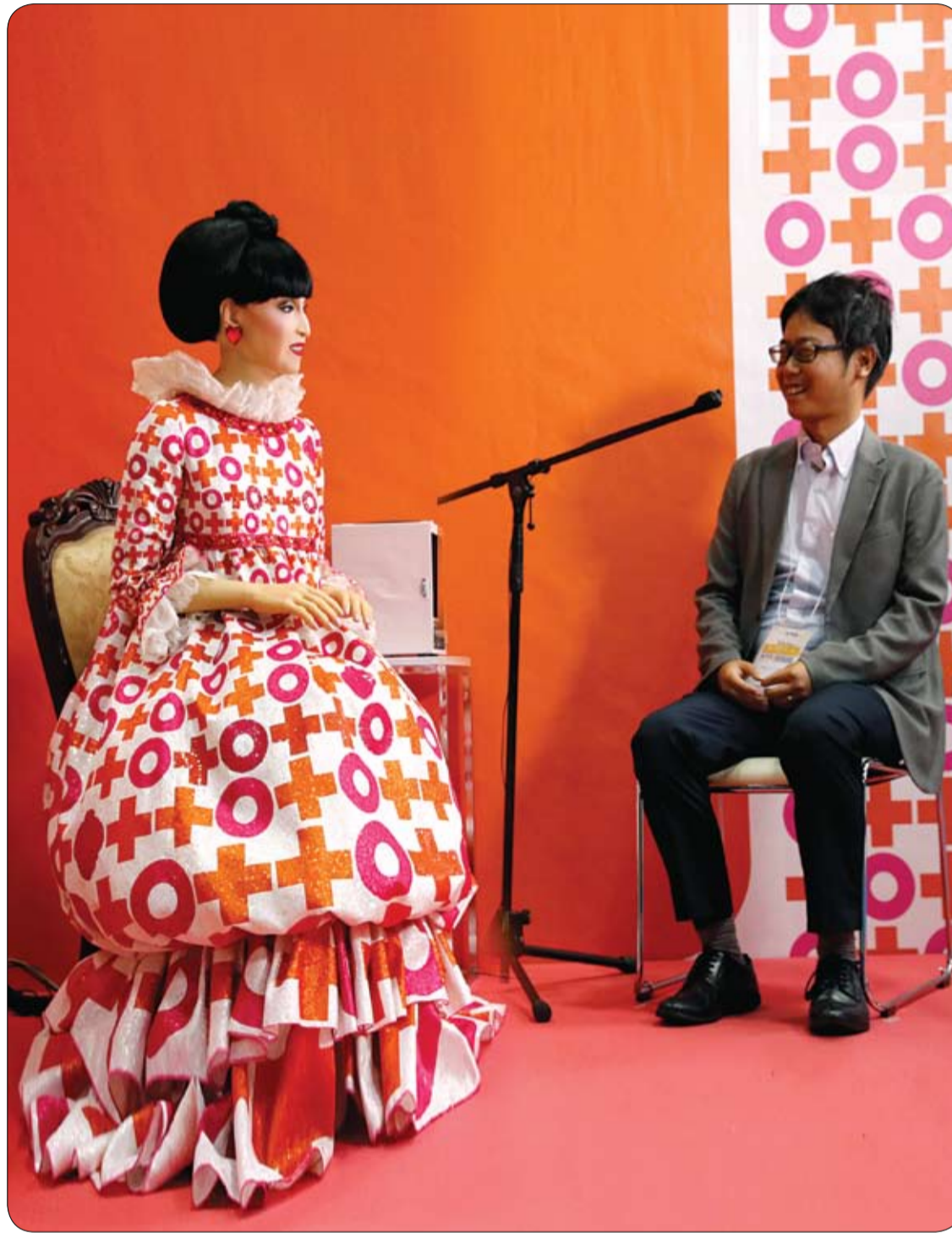
زائر يتحدث مع الروبوت tutto ، الذي تم تصميمه على شكل الشخصية التلفزيونية اليابانية (تيتسوكو كورويانا جي) خلال القمة العالمية للروبوت في طوكيو.

بعد تساقط الشعر في الغالب أمراً طبيعياً جزءاً من دورة نمو الشعر؛ حيث إنه من الطبيعي فقدان ما يتراوح بين 100 و200 خصلة شعر يومياً. وقالت طبيبة أمانية للأمراض الجلدية، إنه في حال سقوط كمية أكبر من ذلك على نحو مفاجئ، فإنه ينبغي مراجعة ما إذا كان المرء قد تعرض لإصابة بعدوى كالانفلونزا مثلاً أو أجرى عملية جراحية خلال آخر ثلاثة شهور. مشيرة إلى أن الشعر يقوم في هذه الحالات بإعادة مزامنة دورة نموه، ما يؤدي إلى سقوط كثير من الشعر دفعة واحدة بعد مرور نحو ثلاثة أشهر. وأوضحت الدكتورة أوتة زيمان هارمس، أنه إذا لم يرجع تساقط الشعر إلى أحد هذه الأسباب، فينبغي حينئذ استشارة الطبيب؛ نظراً لأن تساقط الشعر قد يشير حينئذ إلى نقص الحديد بالجسم أو خلل وظيفي بالغدة الدرقية، إلى جانب العوامل الوراثية. وفي هذه الحالات يجب علاج السبب كي يتوقف تساقط الشعر. وإلى جانب العناية السليمة، يمكن دعم صحة الشعر من خلال التغذية المتوازنة الغنية بالمعادن والفيتامينات، خاصة فيتامين H المعروف أيضاً باسم "البيوتين"، والذي تتمثل مصادره في صفار البيض وكبد الأبقار ورفائق الشوفاط والجوز والحبوب الكاملة.