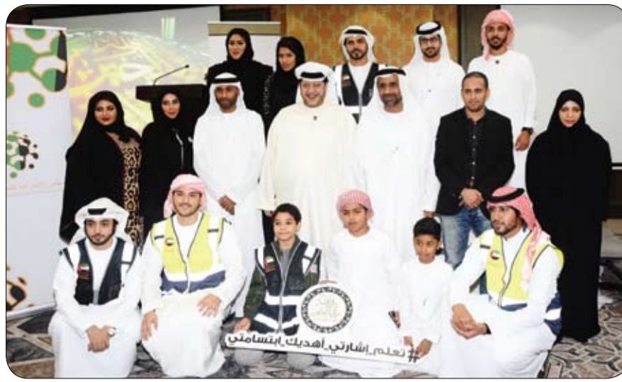
بحضور سعيد بن طحنون آل نهيان