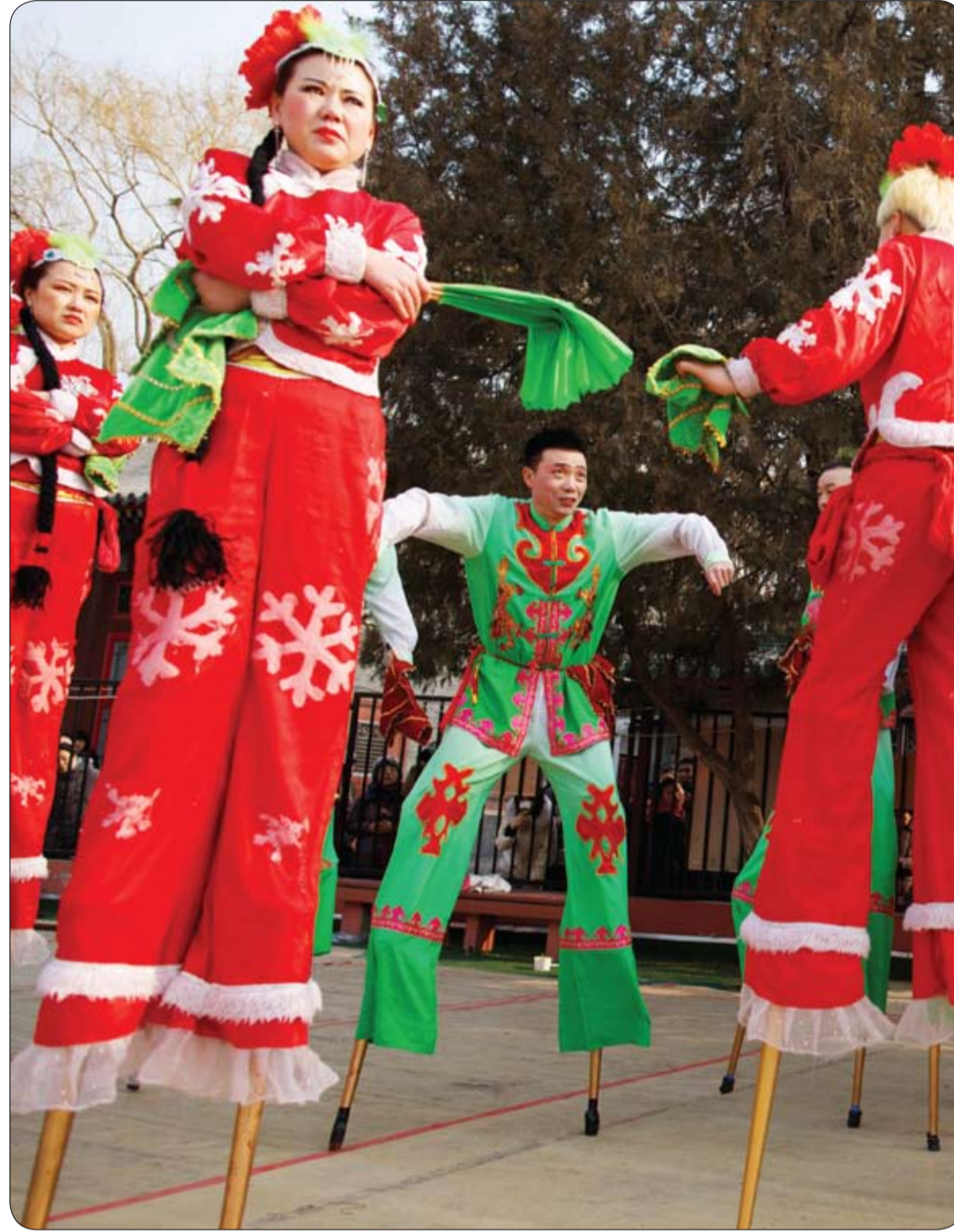
فنانون يقفون على ركائز متينة ينتظرون خلف الكواليس في ديتان باركا استعداداً لأداء عرض خلال احتفالات السنة القمرية الجديدة في بكين، الصين.

5- يمنع امتصاص الحديد قد يصبح عنصر الحديد الذي يحصل عليه الجسم مع المواد الغذائية من دون فائدة بسبب تناول الشاي الأخضر. لأن بعض المكونات الموجودة في الشاي الأخضر، تتفاعل مع عنصر الحديد مكونة مركبات لا يمكن للجسم امتصاصها وتخرج إلى خارج الجسم. لذلك ينصح الخبراء بعدم تناول الشاي الأخضر عند أو بعد تناول مواد غذائية غنية بعنصر الحديد.