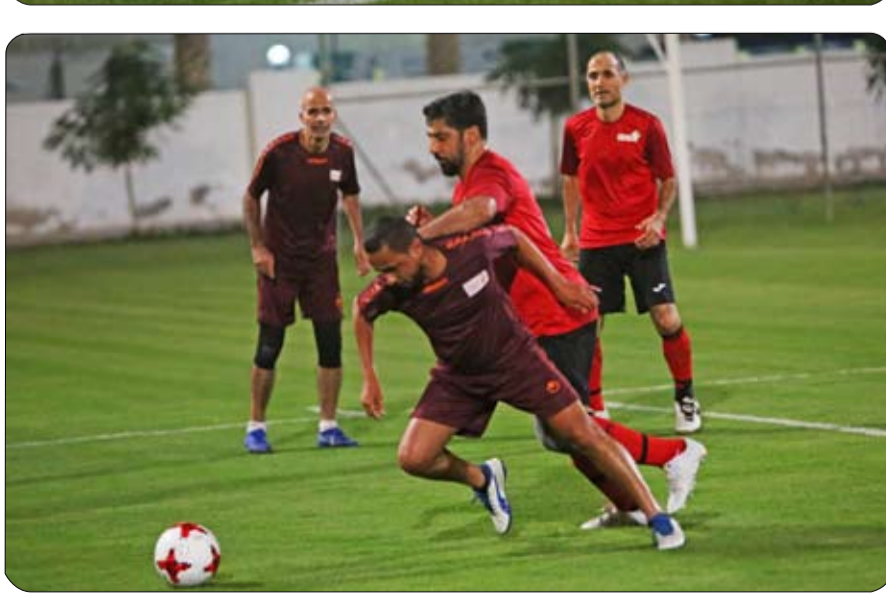
على شوطين والتغيرات مفتوحة للاعبين نقاط والمتعادل نقطة والمنسحب صغراً ومدّة المباراة 30 دقيقة والرابع لتحديد المركزين الخامس والسادس. ويمنح الفريق الفائز 3