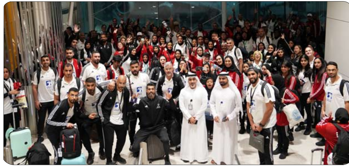
هي المشاركة في فعاليات ماراثون أدوك، ومنتخب الإمارات للتزلج المحبّول، وكذلك مبادرة العالمية للتنس، وبطولة الدولة لفردى الرجال لكرة الطاولة،

وغيرها من البطولات، فيما كانت المشاركات الخارجية ممثلة في دورة الألعاب الوطنية بالنمسا، ودورة ألعاب مالطا العام الماضي، ومشاركة فريق كرة القدم الموحدة للسيدات في معسكر تدريبي باليابان خلال الفترة الماضية. وساهم تدعيم الأولمبياد الخاص للاعبين في ارتفاع مستوى قدراتهم على تقديم الأفضل خاصة من اللاعبين أصحاب التحديات، والإعاقات الذهنية والنمائية، في عدد من الاستحقاقات، بعد النجاح الذي تحقّق في النسخة الأخيرة التي أقيمت بالإمارات 2019، وقبل السفر إلى برلين أعلنت شركة "أدوك" الوطنية عن رعايتها لبعثة الإمارات المشاركة في الألعاب العالمية للأولمبياد الخاص برلين 2023، وهي الانتفاضة التي تدعم من خلالها "أدوك" برامج الأولمبياد الخاص الإماراتي الهادفة لتمكين الرياضيين في مختلف الأنشطة الرياضية، بما يعكس إيجاباً على مجتمع الأولمبياد الخاص الإماراتي وأصحاب الهمم. وأكد طلال الهاشمي المدير الوطني للأولمبياد الخاص الإماراتي جاهزية لاعبينا للمشاركة في منافسات الألعاب العالمية للأولمبياد الخاص، بعد فترة إعداد مميزة على مدار الأشهر الماضية، وسدّ تفاعل كبير من اللاعبين وللإعاقات المشاركين، ودعم كبير من أسرهم من أجل تحقيقهم للإنجازات والوقوف على منصات التتويج. وأضاف: "ما تحقّق في نسخة 2019 التي أقيمت في الإمارات، نقطة انطلاقنا بالنسبة لنا من أجل دعم لاعبينا في النسخة الحالية من الأولمبياد، كلنا متحمسون لتقديم الأفضل وتشريف الرياضة الإماراتية في هذا الحفل العالمي".