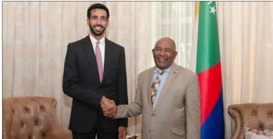
شخبوط بن نهيان إلى جزر القمر مؤخراً ، ضمن جولة معاليه والوفد المرافق له، إلى عدد من دول القارة الأفريقية الشقيقة الصديقة بدأت بجمهورية موريشيوس واختتمت بزيارة جمهورية القمر المتحدة.

قام معالي الشيخ شخبوط بن نهيان بن مبارك آل نهيان وزير دولة، بزيارة إلى جمهورية القمر المتحدة، التقى خلالها فخامة عثمان غزالي رئيس جمهورية القمر المتحدة، حيث بحث الجانبان آفاق التعاون والفرص الاستثمارية المشتركة الواعدة التي تعزز اقتصاد البلدين وازدهارهما. وتناول الجانبان، خلال اللقاء عدداً من المواضيع الإقليمية ذات الاهتمام المشترك من ضمنها رئاسة جمهورية جزر القمر المتحدة الدورية للاتحاد الأفريقي هذا العام.