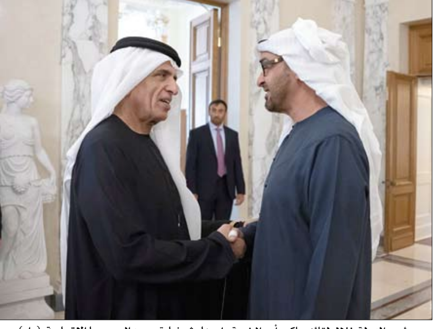
رئيس الدولة خلال لقائه حاكم رأس الخيمة على هامش زيارة سموه الى روسيا الاتحادية (وام)

خالد بن محمد بن زايد يدشن المركز الموحد لخدمات الإسكان (إسكان أبوظبي) في أدنك •• أبوظبي- وام: دشن سمو الشيخ خالد بن محمد بن زايد آل نهيان، ولي عهد أبوظبي رئيس المجلس التنفيذي لإمارة أبوظبي، المركز الموحد لخدمات الإسكان (إسكان أبوظبي) في مركز أبوظبي الوطني للمعارض أدنك، لتعزيز رحلة المتعاملين للحصول على جميع الخدمات السكنية تحت سقف واحد، بما يلبي متطلبات الأسر المواطنين. وأطلع سموه، خلال جولته التفقدية، على خدمات مركز إسكان أبوظبي، التابع لهيئة أبوظبي للإسكان، والتي تشمل منح السكنية، والقروض السكنية، والإعفاءات، وشراء الأراضي السكنية، وخدمات استبدال المنافع السكنية، والخدمات المقدمة من الشركاء الاستراتيجيين. (التفاصيل ص7)