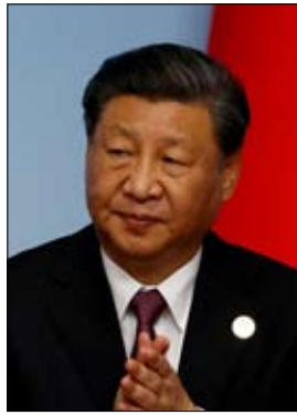
•• بكين-أ ف ب

أكد الرئيس الصيني شي جينبينغ خلال لقاء نادر مع مؤسس مجموعة مايكروسوفت بيل غيتس أن الصين «وضعت دائماً آمالها في الشعب الأميركي» على الرغم من التوتر بين واشنطن وبكين، كما ذكرت وسائل إعلام حكومية. ونقلت صحيفة «بيبولز» اليومية عن شي قوله لغيتس «أنت الأميركي الأول الذي ألتقيه في بكين