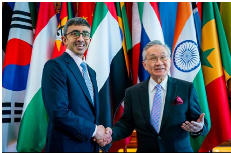
عبيد سعيد الظاهري سفير الدولة لدى مملكة تايلاند .

مشروع نظام ترقيم المباني ، المشروع الساعي لترقيم المباني والوحدات وربط بياناتها في "نظام عمار" مع الشركاء والعقود الاجبارية، متحدثاً عن تفاصيله وتحديات الوضع الحالي وهدف المشروع وأهميته والمتمين بالمشروع والخطة العامة للمشروع والتي تشمل المراحل الرئيسية لتنفيذ المشروع وخط سير الاجراء الحالي والجديد لترقيم المباني. وبين الفلاسي أن الدائرة حرصت على استحداث آلية موحدة لترقيم المباني والوحدات الفرعية داخل المباني في إمارة عجمان، وإنشاء بطاقة بيانات المباني، بحيث يكون النظام المستحدث ثابت ومستقل عن أي متغيرات خارجية للمبنى، لتحسين تجربة التعامل وتوظيف الحلول الذكية في تطوير العمليات وتحقيق التحسين المنشود. تخلل المجلس فتح باب المداخلات والنقاشات والاستفسارات مع الشركاء لمعرفة احتياجاتهم واقتراحاتهم بشأن المشروع .