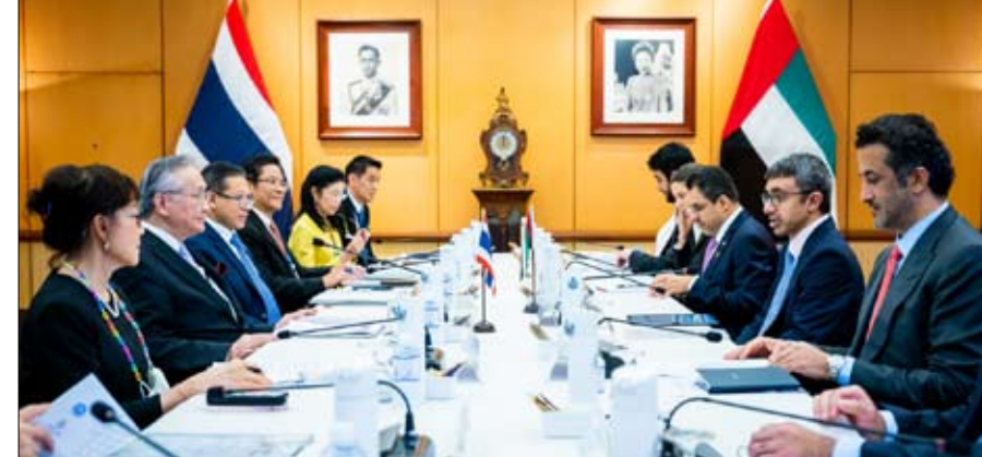
ذات الاهتمام المشترك. ويبحث سمو معالي دون برامودينايا وعدد من القضايا الإقليمية والدولية