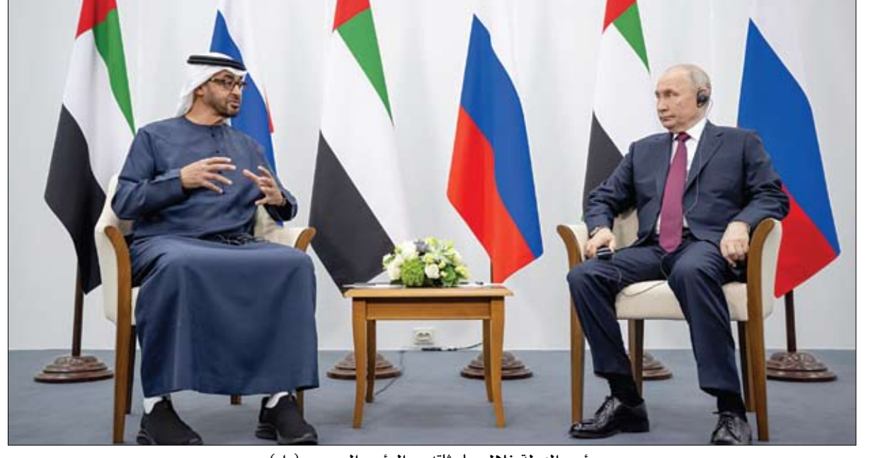
رئيس الدولة خلال مباحثاته مع الرئيس الروسي