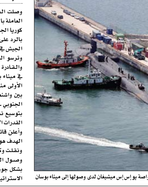
الغواصة يو إس إس ميشيفان لدى وصولها إلى ميناء بوسان