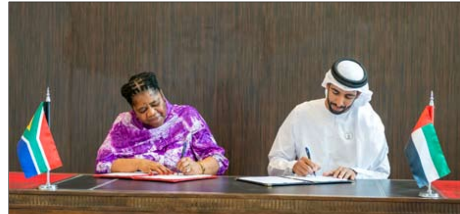
المنقذة بين البلدين نمواً ملحوظاً منذ تأسيس اللجنة المشتركة بين الإمارات وجنوب أفريقيا في أغسطس الاقتصادي والاستثماري.

استقبل معالي الشيخ شخبوط بن نهيان بن مبارك آل نهيان وزير دولة، سعادة كانديث ماشيفو دلاميني، نائبة وزيرة العلاقات الدولية والتعاون في جمهورية جنوب أفريقيا والوفد المرافق لها، المشارك في أعمال الدورة الثالثة للجنة المشتركة بين دولة الإمارات وجنوب أفريقيا المنقذة في مقر وزارة الخارجية في أبوظبي. وبحث الجانبان، أثناء الجلسة، سبل تعزيز العلاقات بين البلدين، وسبل التعاون في مختلف المجالات ذات الاهتمام المشترك. وتؤكد هذه الجلسة المشتركة على الروابط الراضية بين البلدين الصديقين