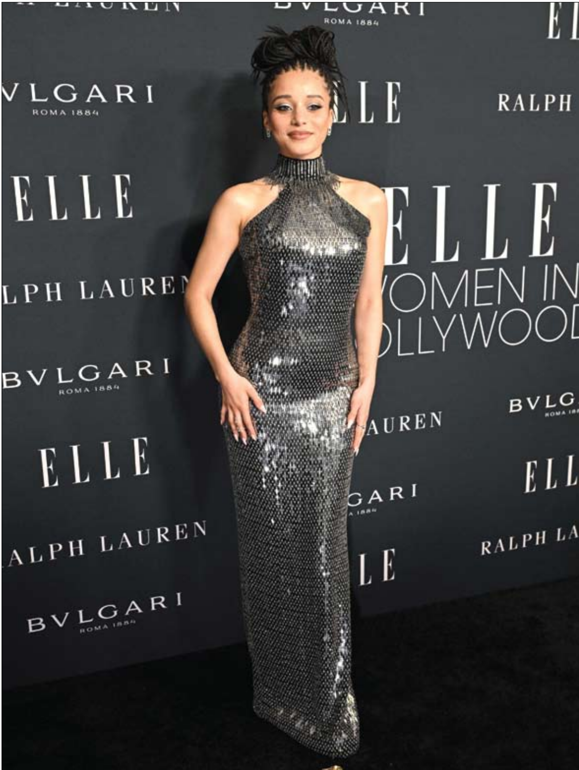
الممثلة الأمريكية تشيس إنفينيتي لدى حضورها احتفال مجلة Elle 2025 للنساء في هوليوود، كاليفورنيا . ا ف ب