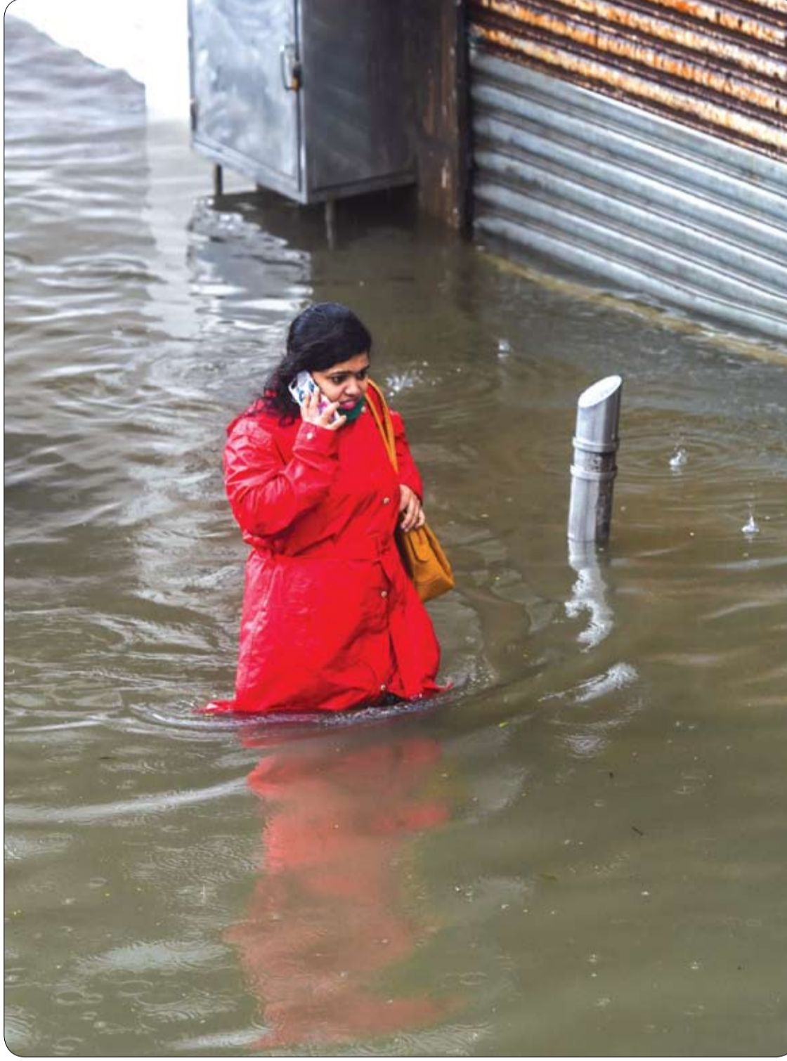
امرأة تتحدث على هاتفها المحمول وهي تتجول في شارع غمرته المياه بعد هطول الأمطار الموسمية في مومباي.

كشف الدكتور أندريه كابرين، كبير أطباء الأورام في وزارة الصحة الروسية، الأعراض التي يجب عدم تجاهلها وتتطلب استشارة الطبيب فوراً. ووفقاً للأخصائي كابرين، يمكن أن تشير علامات مثل الشعور بالتعب خلال فترة طويلة إلى الإصابة بمرض سرطاني، وكذلك فقدان الوزن دون اتباع حمية غذائية معينة، وخاصة عندما يرافقه ارتفاع درجة حرارة الجسم، دون وجود إصابة بأمراض البرد، وأيضا السعال المستمر لفترة طويلة. ويقول، "بالإضافة إلى هذه العلامات، فإن أي إفرازات للدم عند السعال ونزف الأنف لفترة طويلة والدم مع البول ومع الغائط، جميعها أعراض تشير للقلق، وتتطلب استشارة الطبيب بسرعة". وأكد الأخصائي، على ضرورة مراقبة الحالة الصحية للمحيطين بالشخص وحضارهم لإجراء الفحوص الطبية اللازمة أيضا، عند ظهور أي من هذه الأعراض عندهم.